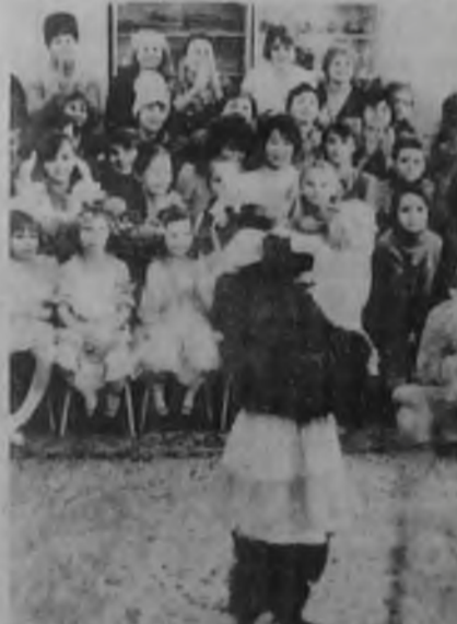
Так почему с детским садом такое возможно? Там что, не люди живут и растут?..

Вы представляете себе такое? Лица этих людей? Ответную их реакцию? А самое главное - их имена?