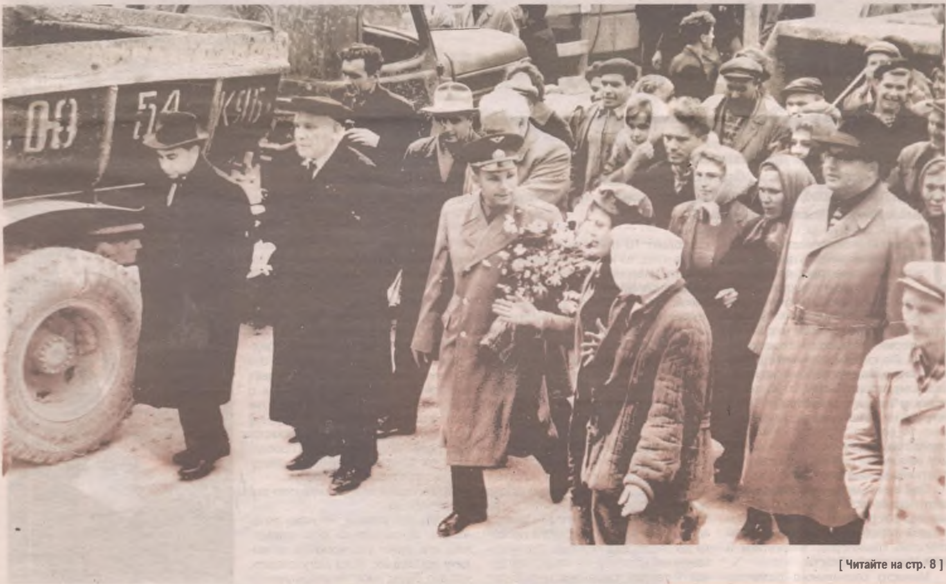
[ Читайте на стр. 8 ]