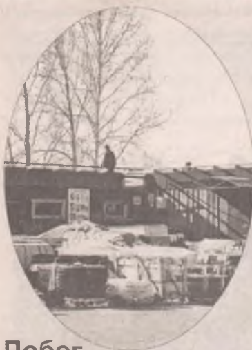
Побег с «Березовой рощи»

Вторник, 23 октября 2012 года, №79 (1267)