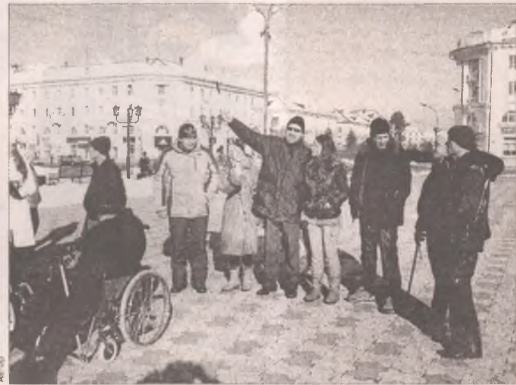
На митинг люди пришли, приехали, прикатили на колясках