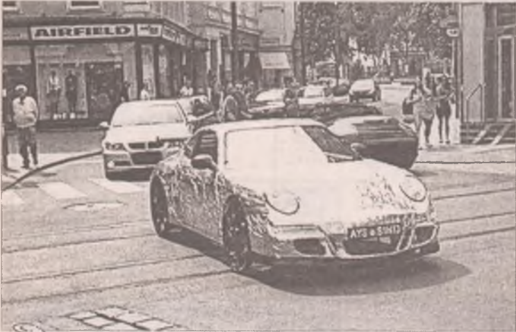
С виду это роскошный спорткар

- Моя тачка произвела настоящий фурор, когда я выкатил ее на улицу, - смеется конструктор. - Девочки так и притягивают, жаль, что показывать в ней я никого не могу.