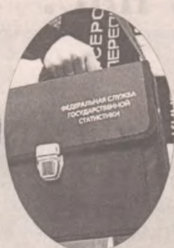
Как ангарчан переписали