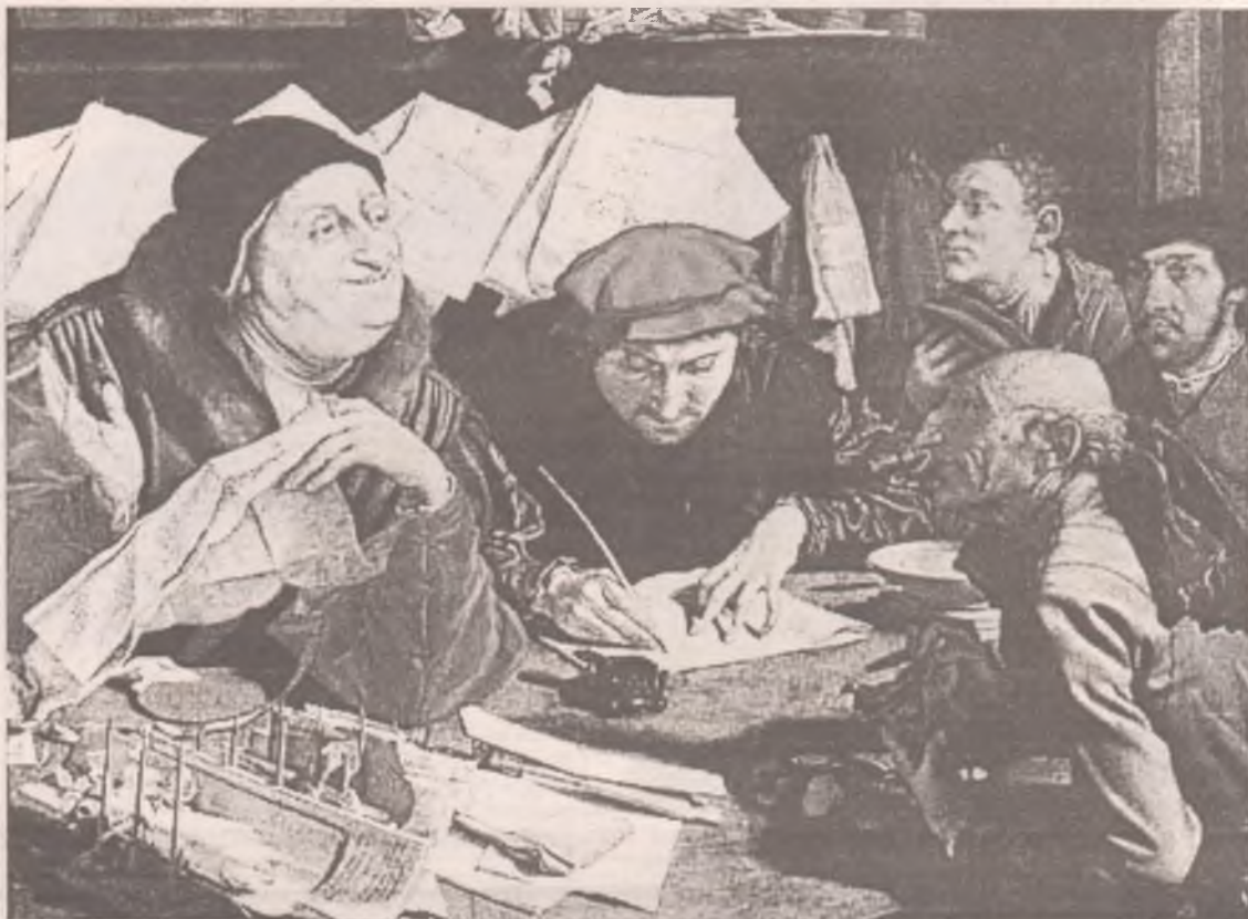
Маринус ван Роймерсвелле. Сборщик налогов. 1542 год

Обособленное подразделение организации - это любое территориально обособленное от нее подразделение, по месту нахождения которого оборудованы стационарные рабочие места. Признание обособленного подразделения организации таковым производится независимо от того, отражено или не отражено его создание в учредительных или иных организационно-распорядительных документах организации, и от полномочий, которыми наделяется указанное подразделение. При этом рабочее место считается стационарным, если