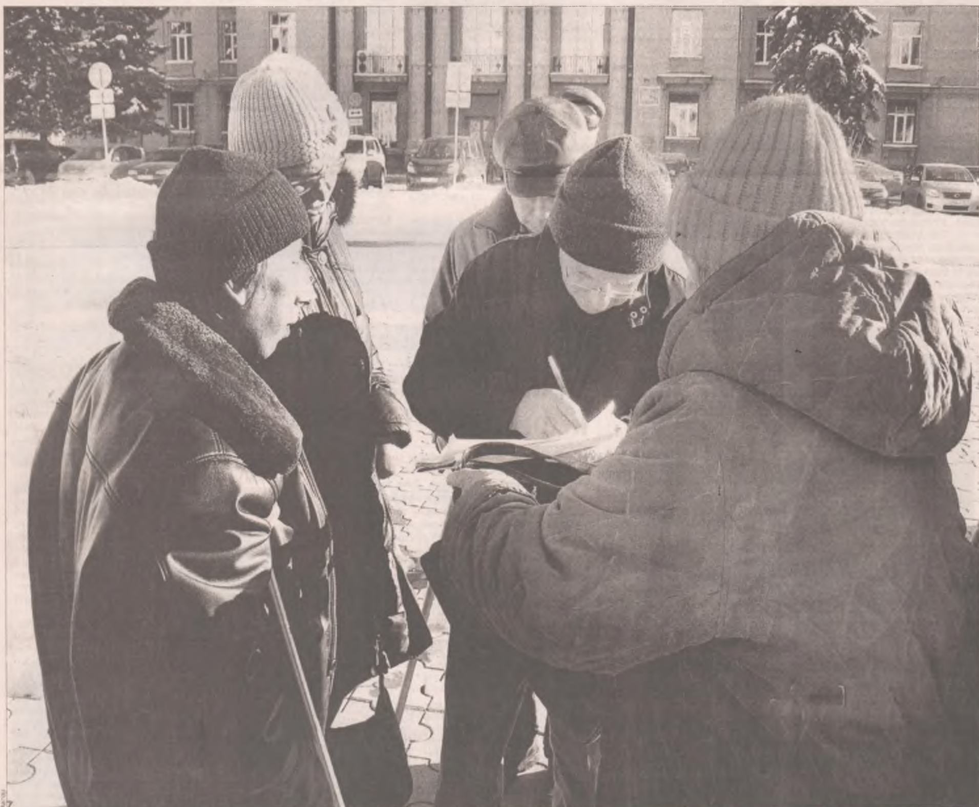
Сбор был проведен легально, согласно действующему законодательству

В пятницу, 19 октября, после 16.00 площадь Ленина нашего города начала наполняться несколько своеобразным народом: в темных очках и с белыми тростями, на костылях и даже в инвалидных колясках.