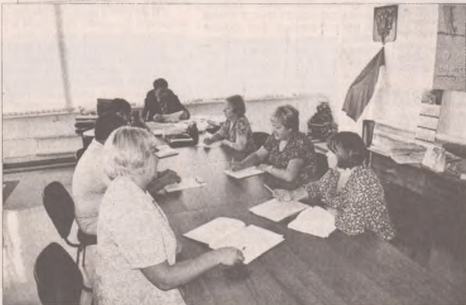
Единым слаженным коллективом сделано много, а предстоит сделать еще больше

Полученные ответы повергли в шок не только депутатов и главу, но и бывалых юристов. Все ветви власти в один голос утверждали о невозможности преобразования Савватеевки. Этот шаг привел бы к нарушению самостоятельности села, потере самобытности, уничтожению культуры, таким образом, как это произошло в Мегете, Китос.