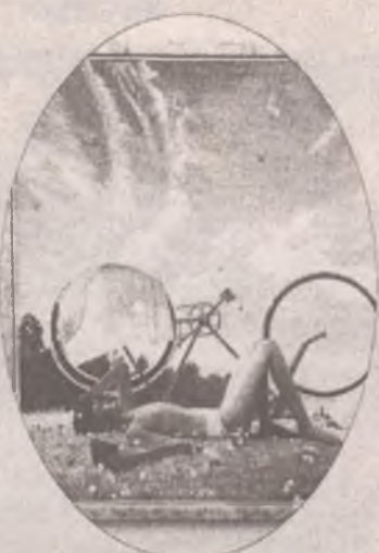
Года по осени считают