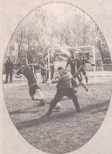
Вместо меча - мяч

Вторник, 9 октября 2012 года, №75 (1263)