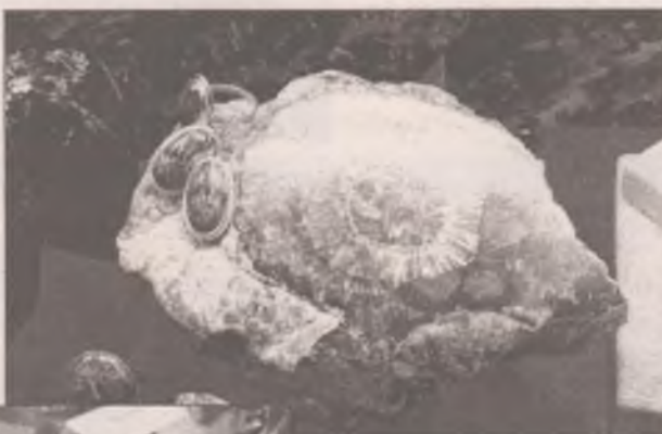
месторождения нефрита и жадеита.

- А самое интересное - экспедиция «Байкал-кварц-самоцветы», за 12 лет поработал здесь и камнерезом, и геологом, и начальником участка, и главным инженером партии. А когда от этой же экспедиции отправился на юг Краснодарского края, словно привез свою удачу с собой: нашел драгоценные проявления и