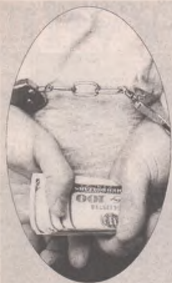
Громкие аресты стр. 2