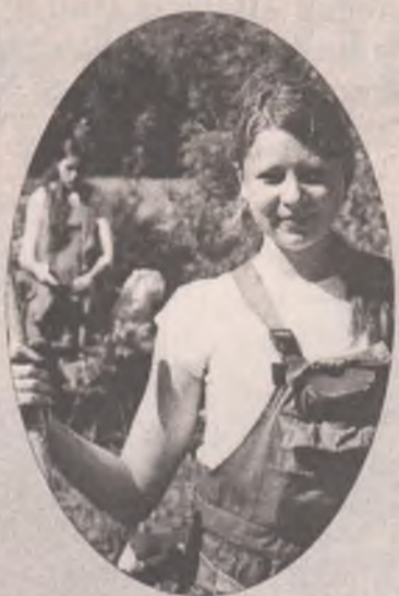
Трудовое лето подростков стр. 4