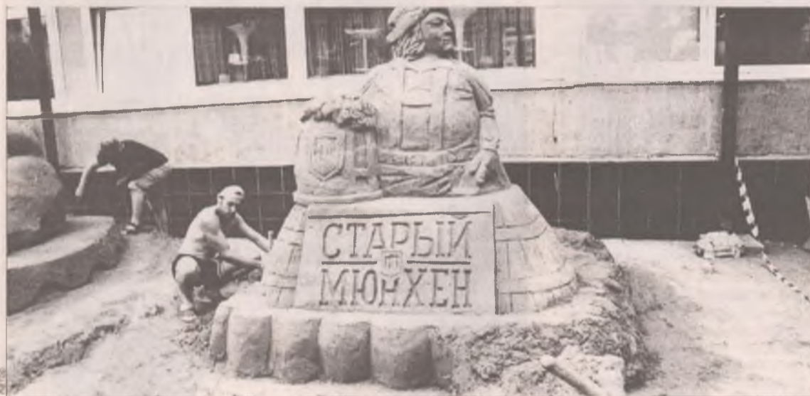
Евгений Тимкович, преподаватель училища искусств, пробует новый для себя материал