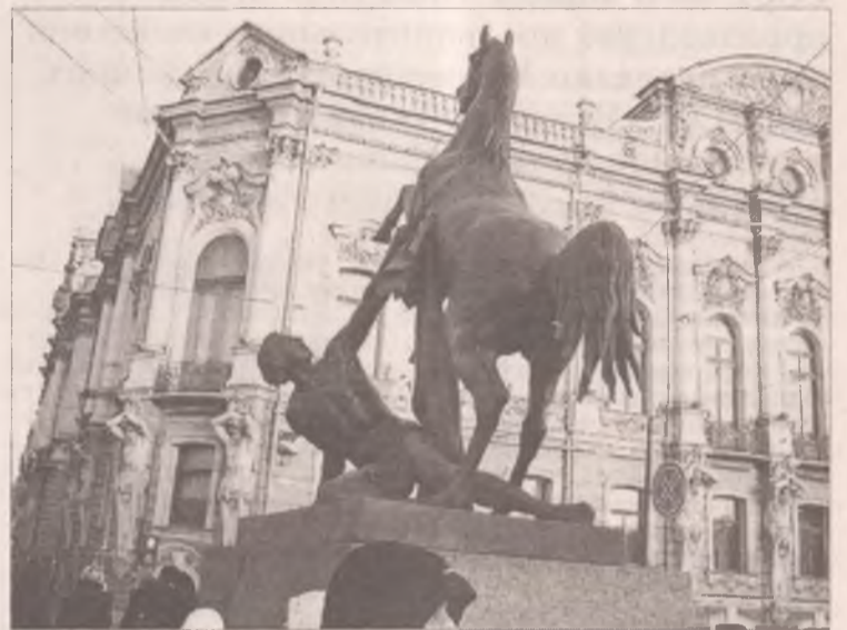
Знаменитый Аничков мост

Часть ангарских экскурсоводов кинулись на площадь искусств. Надо же воочию