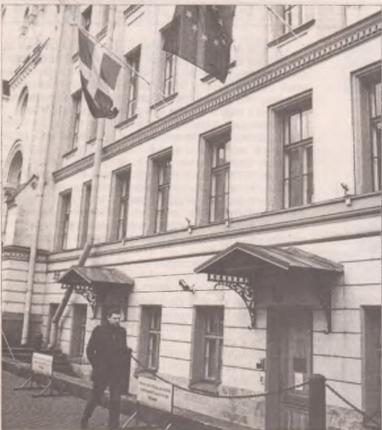
Посольства на Английской набережной