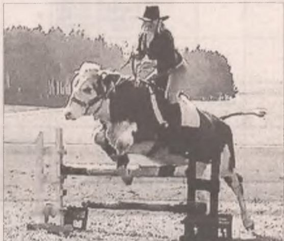
Глядя на эту корову, становится понятно значение слова ковбой (cowboy - англ., коровий человек)