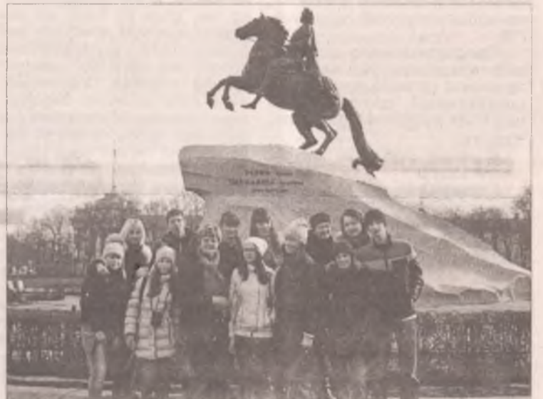
Визитная карточка Петербурга