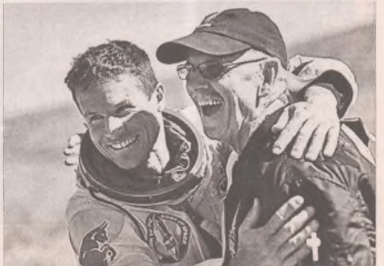
Подготовлено по материалам The Telegraph, РИА «Новости», Дни.ру, «Твой день»

Свободное падение продолжалось чуть менее 4 минут - экстремал развил скорость около 600 километров в час! Следующий тестовый прыжок планируется совершить с высоты 27 километров, а штурм рекордных 36 километров будет проведен до конца 2012 года.