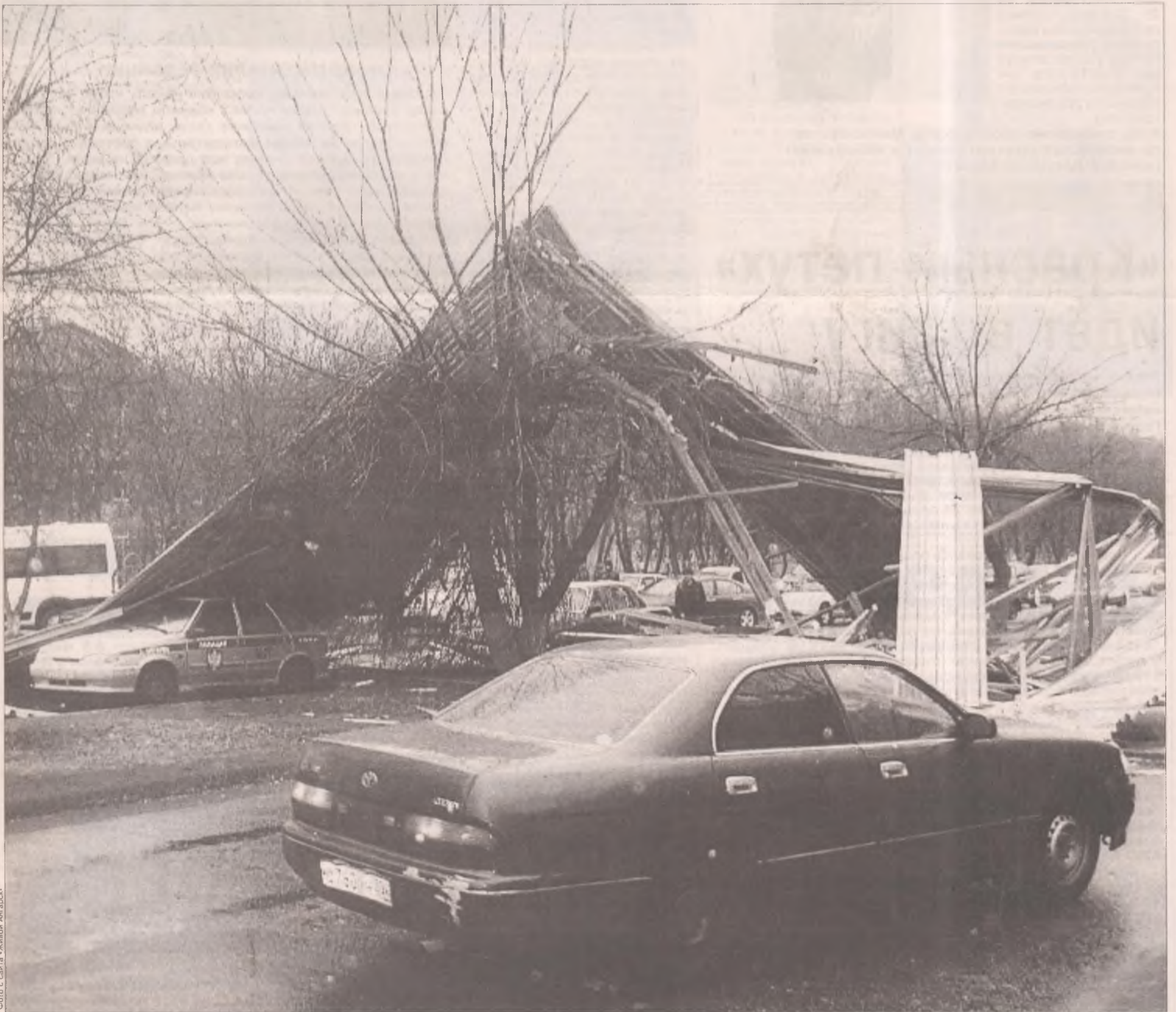
Безалаберность и извечная надежда на русское «авось» могли закончиться трагически...

В пятницу, 6 апреля, в городе стояла жара. Температура воздуха подошла к отметке 20 градусов. Следствием такой аномалии стал штормовой северо-западный ветер, налетевший около шести часов вечера. Он наделал много неприятностей в городе. Разрушены рекламные конструкции, кровли частных домов и гаражей.