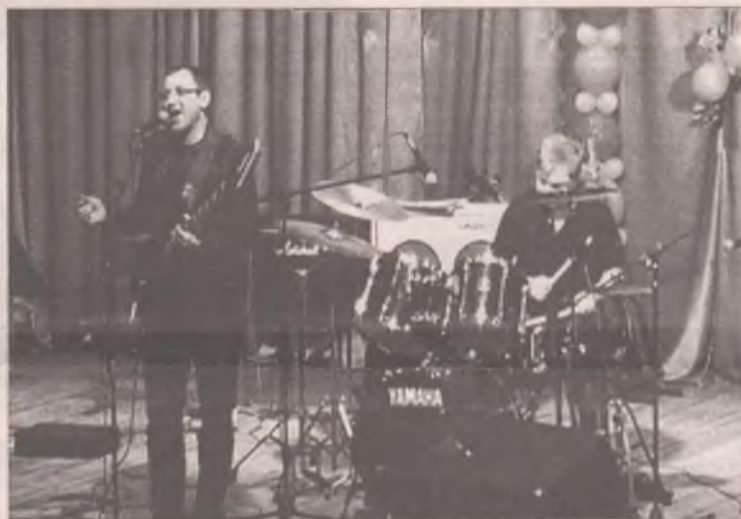
Концерт-реквием и его участники