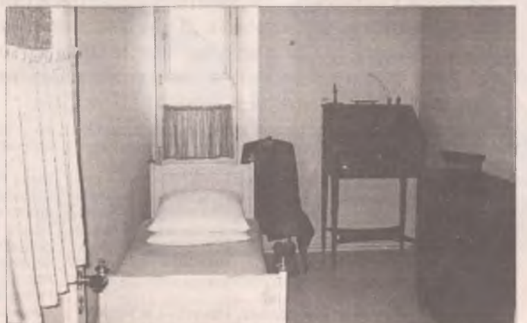
В таких комнатах жили лицейцы в Царском селе