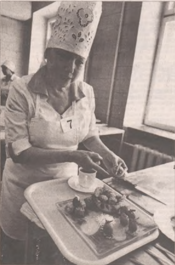
В умелых руках блюдо становится художественной композицией