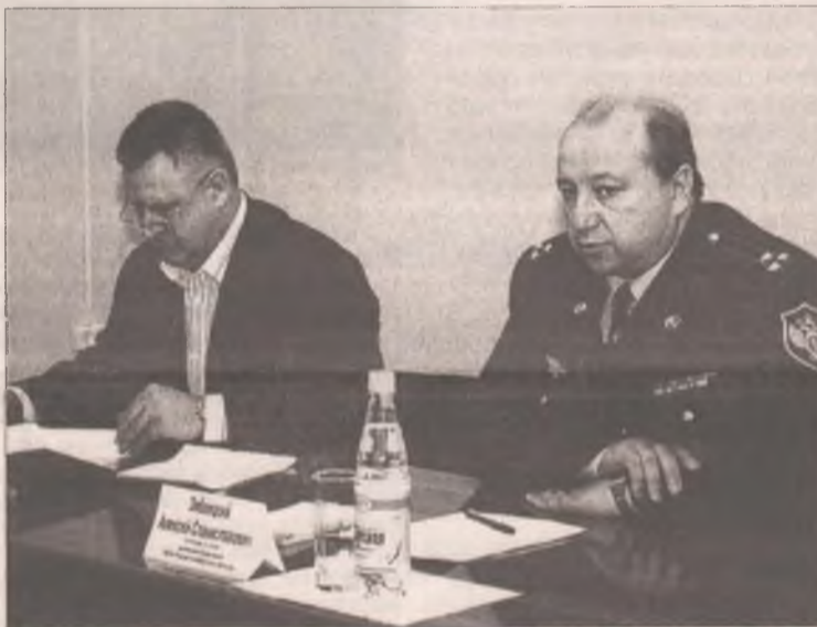
На основании утвержденного плана совместных оперативно-розыскных и профилактических мероприятий взаимодействие ведомств в 2012 году продолжится.