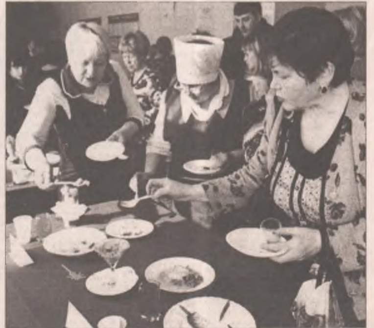
Дегустация: и где тут самое вкусное?