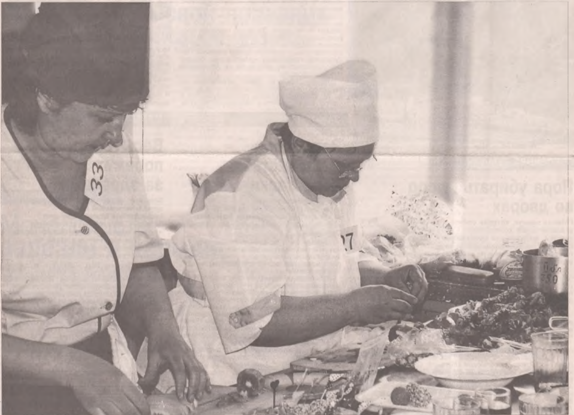
Идет рождение конкурсного шедевра

Каждый заботливый родитель желает дать ребенку с момента его рождения все самое лучшее: удобную коляску, одежду из натуральных тканей, игрушки, не представляющие опасности, и многое, многое другое. Их голова день и ночь забита хлопотами о своем чаде - с чуткостью и сноровкой сыщика они отбирают все предметы, которым предстоит окружить жизнь их малыша. Когда же их плоть и кровь отдают в детский сад, то сердце родителей опять не знает покоя: как же позаботятся незнакомые люди об их ребенке? Сыт и здоров ли будет малыш? Ведь именно то, чем питается ребенок, так важно для развития маленького организма.