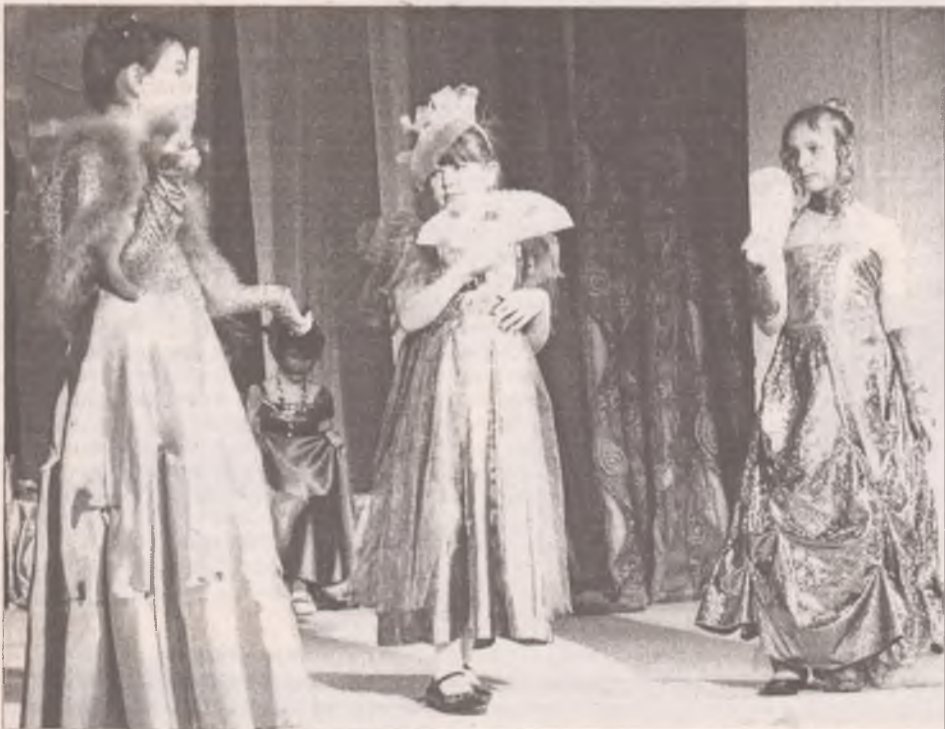
«Гостиная барона Мюнхгаузена»