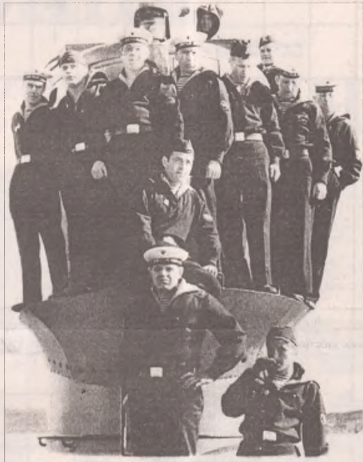
Дембельское фото на добрую память

После защиты диплома, работая юрисконсульт, набирался опыта, зарабатывал