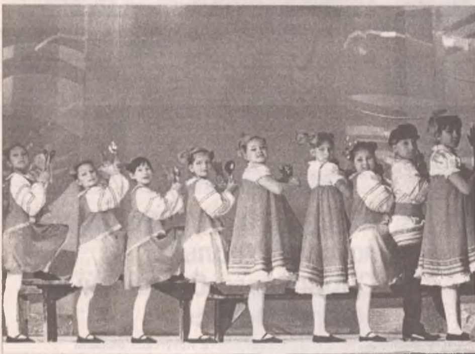
«Про что шутили в старину»