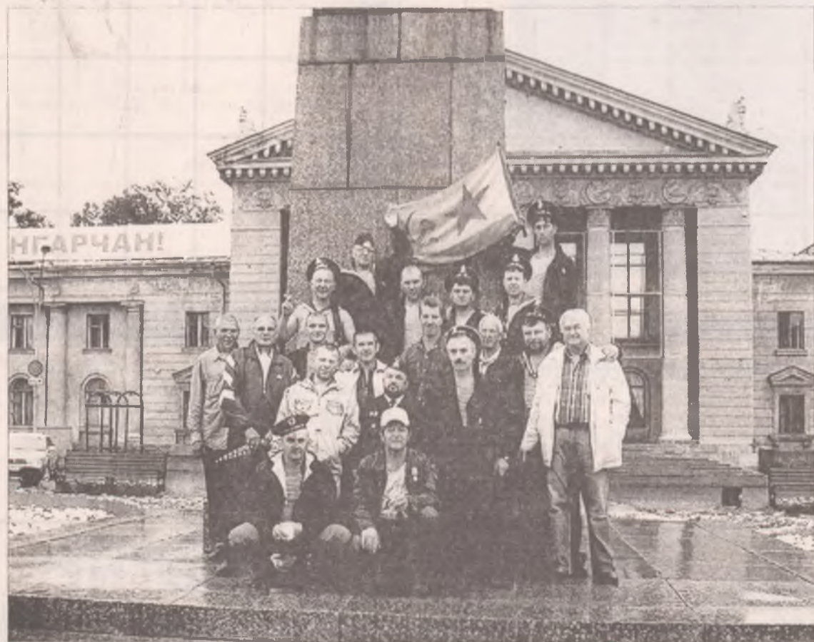
Ангарские ветераны ВМФ каждый год встречаются «у вождя»