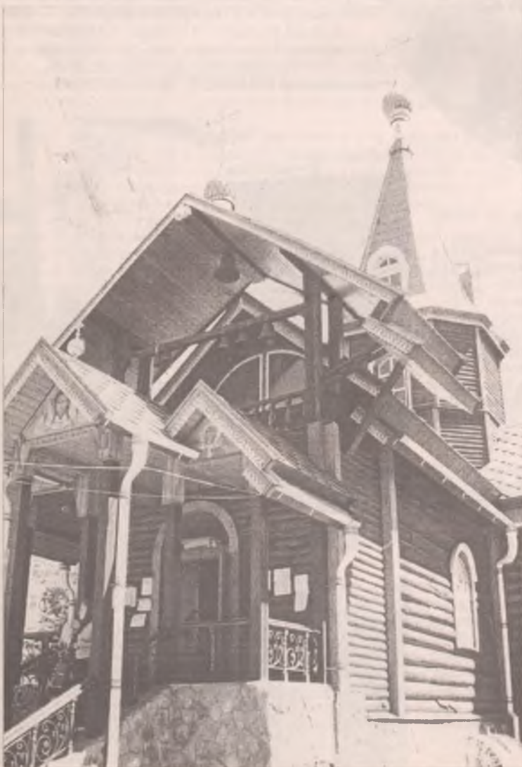
Церковь блаженной Ксении Петербургской