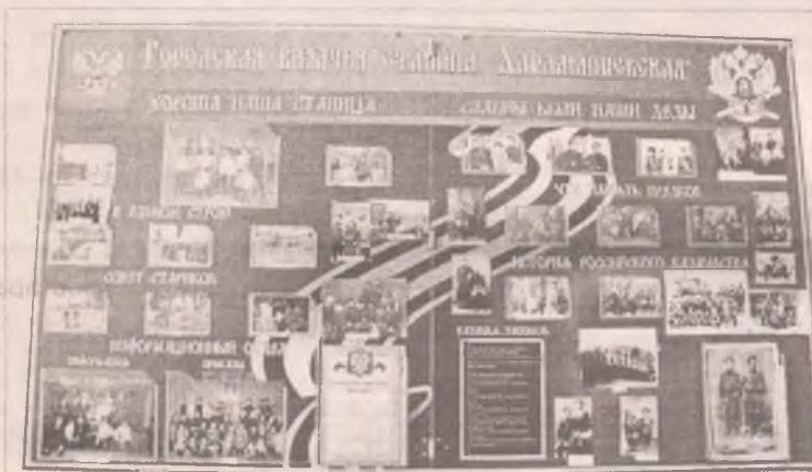
Стенд Казачьего войска в Харлампиевской церкви