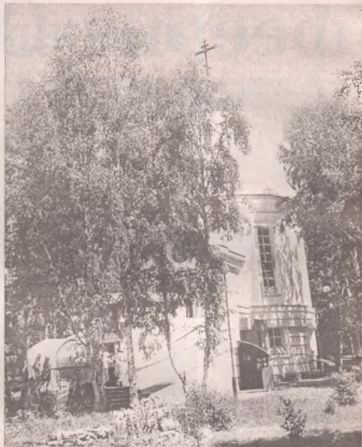
Храм во имя святых Веры, Надежды, Любви и матери их Софии