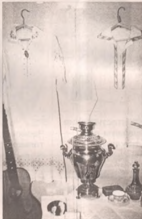
Свадебный наряд 30-х годов