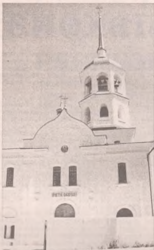
Харлампиевский собор все еще достраивается (июль 2011 года)

Харлампиевская церковь когда-то была самой большой в Иркутске