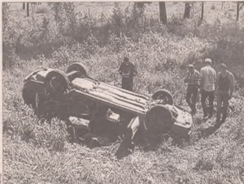
По какой причине один из автомобилей оказался на полосе встречного движения, сейчас разбирается Усольская ГИБДД