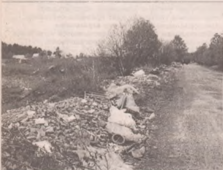
Плата за утилизацию строительного мусора составляет всего 1 рубль за тонну

Ежемесячно сотрудники лесного надзора составляют по несколько протоколов. Схваченные за руку нарушители по решению административной комиссии подвергаются штрафным санкциям. Если мусор в лесной зоне решит оставить частное лицо, то за свою безответственность оно поплатится суммой в 1500 рублей. С юридических лиц спрос строже - 25 тысяч рублей. Добавьте к этому риск для деловой репутации: работники отдела охотно сообщают журналистам о «мусорных» тружениках. Как показывают рейды, недобросовестные ангарчане часто сваливают мусор вдоль дорог, ведущих к действующему полигону ТБО. В четверг, 22 июля, было обнаружено несколько свежих мусорных куч, появившихся в начале этой недели. Одна из алох строительного мусора зафиксирована буквально в 600 метрах от полигона. По тарифам ООО «Сиб-Транс-Петроил», плата за утилизацию строительного мусора составляет всего 1 рубль за тонну. Логика нарушителя непонятна: довези он мусор до места назначения, заплатить пришлось бы от силы 100 рублей. Сваливая мусор в лесу, можно раскошелиться на сумму как минимум в 15 раз больше.