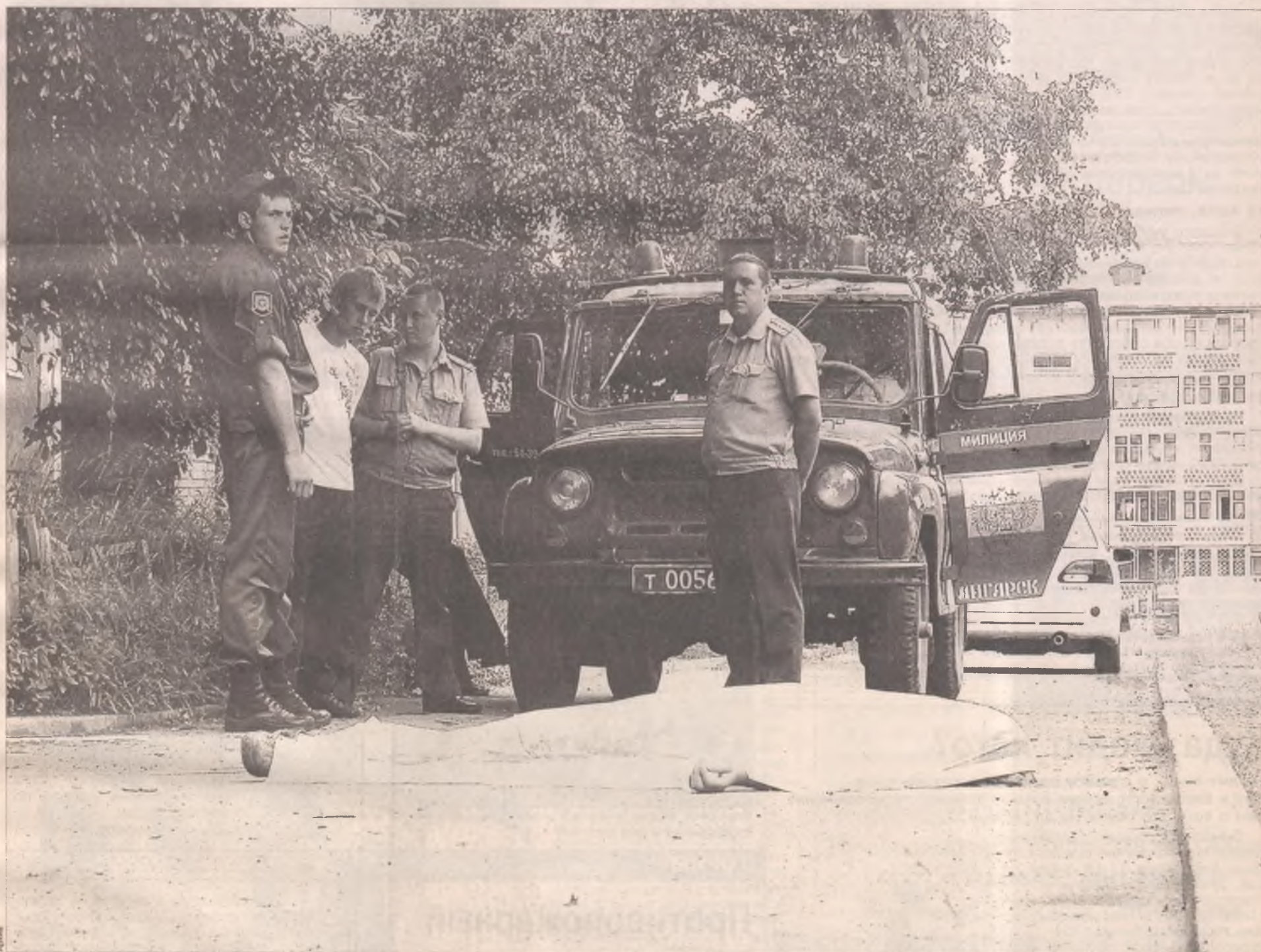
Спешка обернулась трагедией

В течение суток в Ангарске произошло две трагедии, которые объединяет схожий сценарий. Мера вины и степень ответственности участников событий установят следствие и суд, а вот причину происшествий можно назвать уже сейчас - преступная халатность.