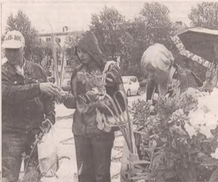
Дождь настоящих любителей цветов не испугал

Несмотря на прохладную погоду и проливной дождь, в минувшее воскресенье состоялся праздник цветов. На площади у ДК «Современник» свое мастерство в выращивании декоративных цветочных культур показали более трех десятков флористов и садоводов.