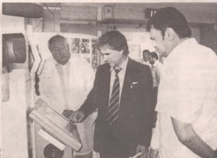
Финансирование проведенных мероприятий осуществлялось из бюджета АМО в рамках муниципальной целевой программы «Совершенствование системы здравоохранения на территории Ангарского муниципального образования»