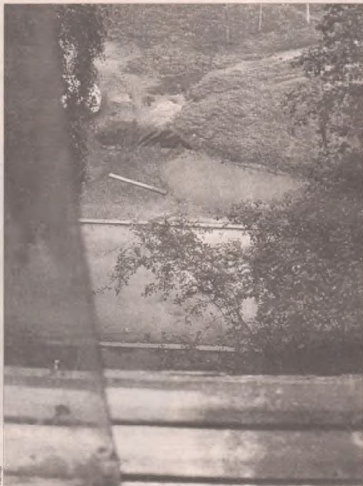
На месте происшествия в 95 квартале: роковая доска

На другой день точно такой же случай происходит в 95 квартале. Здесь затеяли замену полов. Семейная пара, вызвавшаяся помочь хозяину квартиры избавиться от старых половых реек, приступила к работе. Мужчина сбрасывал доски из подъездного окна, напарница стояла под козырьком того же подъезда. Наблюдала, чтобы летящий вниз хлам не наделал беды. Сейчас уже невозможно выяснить, что за причина толкнула женщину выйти из-под укрытия. Очевидцы говорят, что хотела убрать в сторонку «неправильно» упавшую рейку.