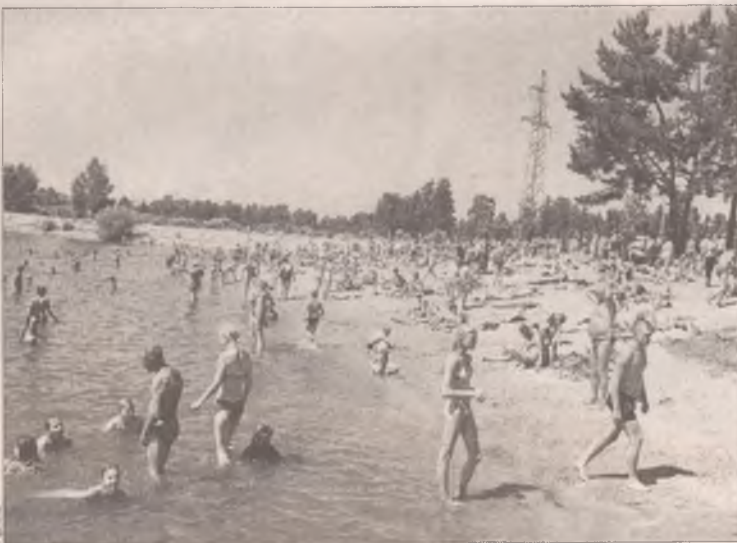
Еловское водохранилище - единственное место в Ангарске, разрешенное для купания