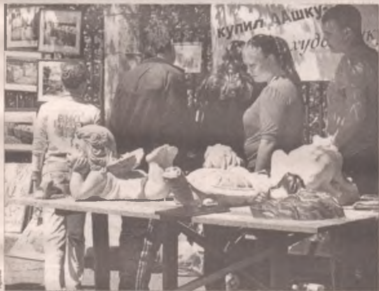
...не прошел комом