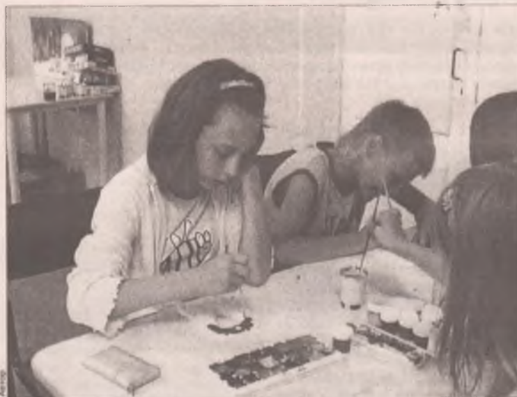
Этим детям повезло - они проводят лето в лагере

И хотя в этом году лагерь принял в три раза меньше ребят, чем в прошлом, организация досуга идет по всем правилам. В лагере ра-