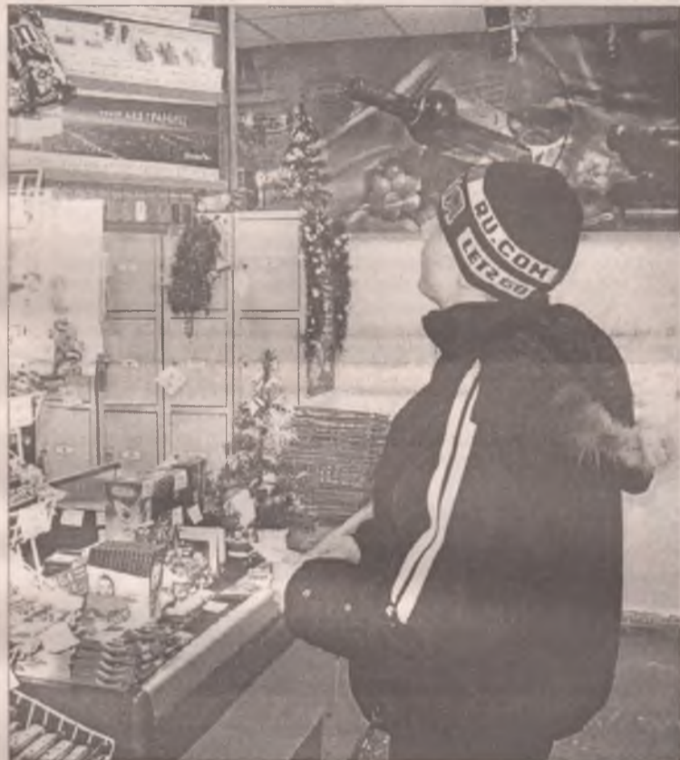
Юноша долго выбирал, какую же марку сигарет ему приобрести, но, увы, купить их на сей раз ему не удалось...

Следовательно, факт жалобы не подтвердился.