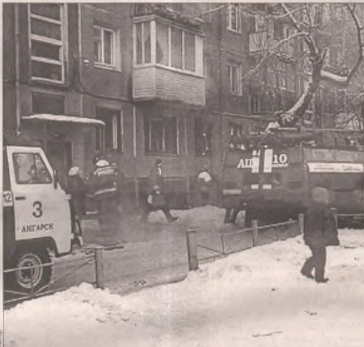
Субботним утром 19 декабря на пульт пожарной охраны позвонили жители 13 микрорайона: в подъезде густой дым!