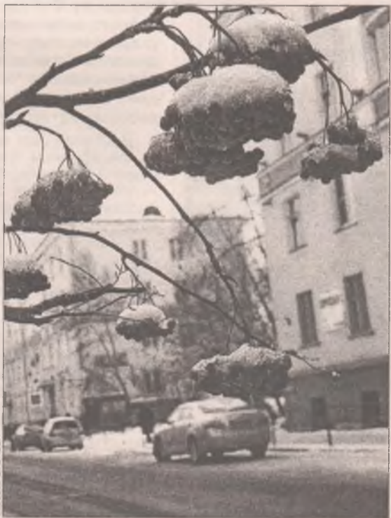
По прогнозам синоптиков, сорокаградусные морозы продержатся всего три-четыре дня, так что мерзнуть будем недолго