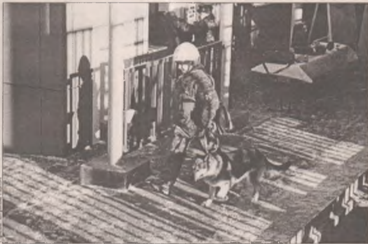
Найду взрывчатку - конфетку дадут