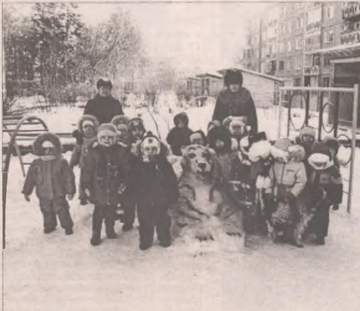
Гулять стало веселее среди забавных зверей