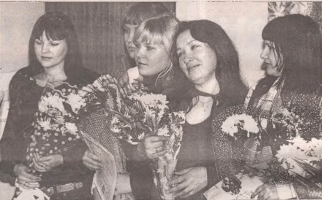
В конкурсе приняли участие те педагоги, которые способны дерзнуть, нарушать привычное

В пятницу, 18 декабря, в гимназии №8 состоялось торжественное награждение победителей смотра-конкурса «Современный урок-2009».