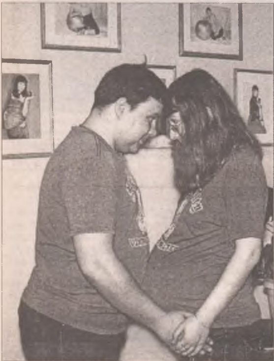
На конкурс стройся! Пузо к пузу, равнение друг на друга...

В прошлый четверг ровно в 19.00 в фойе ДК «Энергетик» торжественно открылась выставка снимков ангарчанок-участниц в инте-