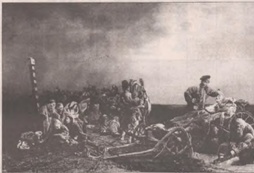
Картина художника Якоби «Привал арестантов», 1861 год