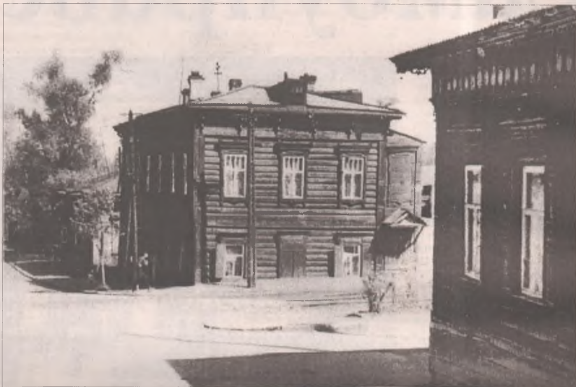
Иркутск, около 1960 года. Тимирязева, 7 - дом, где жила семья с 1918 года

Перед Новым годом на кухне «вздыхает» огромная глиняная квашня. Тесто, поставленное с вечера, подошло. Оно дышит, пузырится, все время увеличиваясь в объеме. Жерло печи полыхает, дрова, сухие, смолистые, дружно горят, и вся кухня озарена пламенем. И вот уже дров нет, только прозрачные розовые мерцающие угли. Их подгребают к плите. На длин-