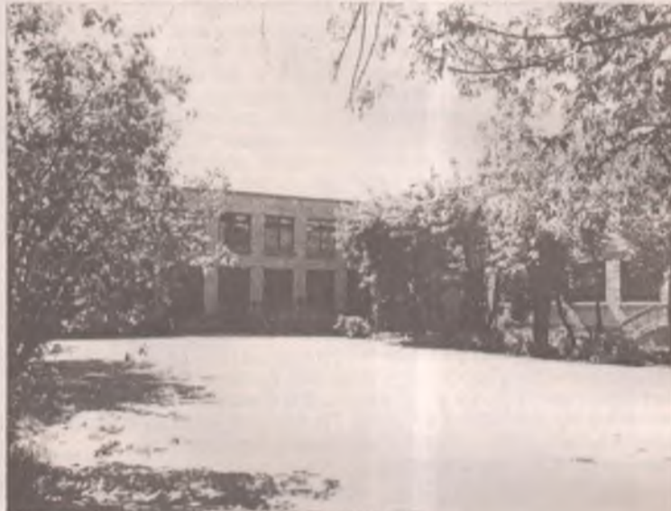
Школы вышли на «линейку» готовности

■ По материалам пресс-службы администрации АМО