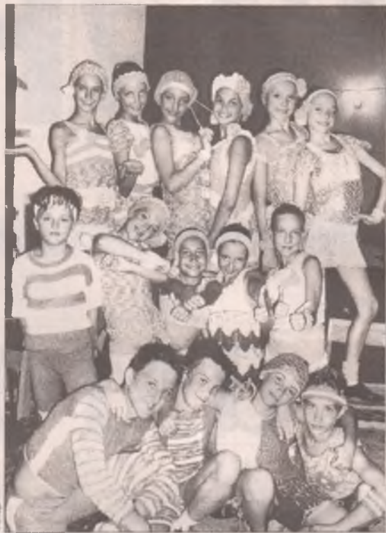
В музыкальной среде победа в конкурсе - это билет в будущее. Приглашение в Санкт-Петербург - яркое тому подтверждение