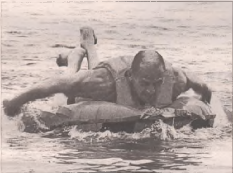
Спорт спасёт мир... и принесёт удовольствие!