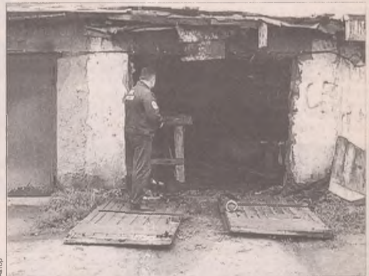
«Из искры возгорится пламя»... Иногда эта красивая фраза превращается в не слишком радостную реальность...

вянную крышу и рубероидное покрытие, отчего верх конструкции задымился и начал гореть. Самостоятельно поту-