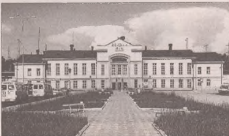
Ночной вокзал способен на сюрпризы