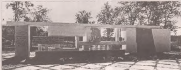
...а так - в Ангарске

P. S. О том, как декабристы и политкаторжане шли по этапу, читайте в следующий вторник.