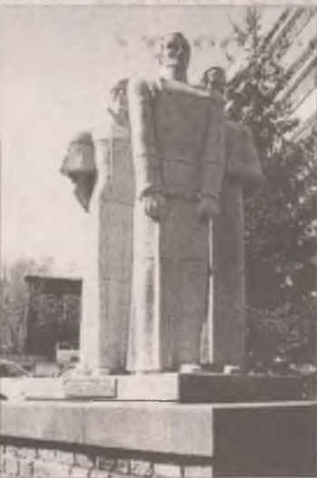
Так выглядит памятник декабристам в Екатеринбурге...

Ситуация с ангарским памятником политкаторжанам переросла городские рамки и заинтересовала областные СМИ. Дело в том, что в начале лета возле монумента начались ремонтные работы. Порадоваться бы - в последний раз внимание монументу уделяли более тридцати лет назад! Однако эффект получился противоположный.