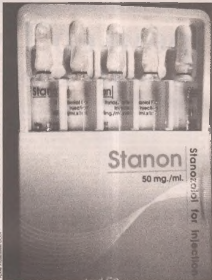
С виду стероиды - обычные лекарства, а последствия их приема ужасны

Как известно, спрос рождает предложение. В погоне за красивой фигурой человечество закрывает глаза на свое здоровье. В каких условиях были изготовлены анаболики и что они содержат - об этом любители спорта почему-то не задумываются. Как впрочем, и о последствиях приема... Любителей стероидов ожидают многочисленные проблемы со здоровьем, которые могут проявиться через несколько лет. Последствиями приема анаболиков могут быть тошнота, рвота, головокружения, гипертония, поражения печени, нарушения сердечной деятельности, агрессивность и раздражительность. У мужчин развивается импотенция, возникают другие нарушения половой сферы. Возможна гинекомастия - значительное развитие тканей