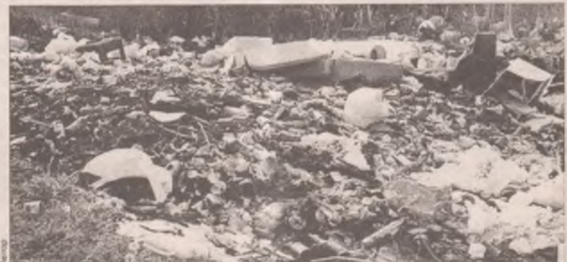
Прополоть свои грядки и нагадить за забором

В июле 2007 года человечество выбрало посредством интернет-голосования семь рукотворных чудес света. Победителями прошлого конкурса стали пирамиды Гизы в Египте, Колизей в Италии, Великая китайская стена, Тадж-Махал в Индии, Петра в Иордании, статуя Христа на горе Корковаду в Рио-де-Жанейро, Бразилия, Мачу-Пикчу в Перу и пирамида Чичен-Ица в Мексике.