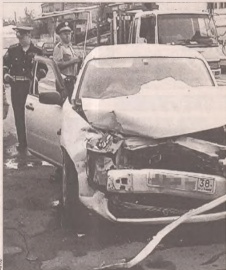
На светофор надейся, но и сам не зевай!