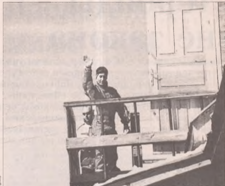
Впервые Путин побывал в Байкальске в 2002 году

Мезенцев немедленно сообщил о планах укрепления экономической базы. Так, в лесной промышленности не-