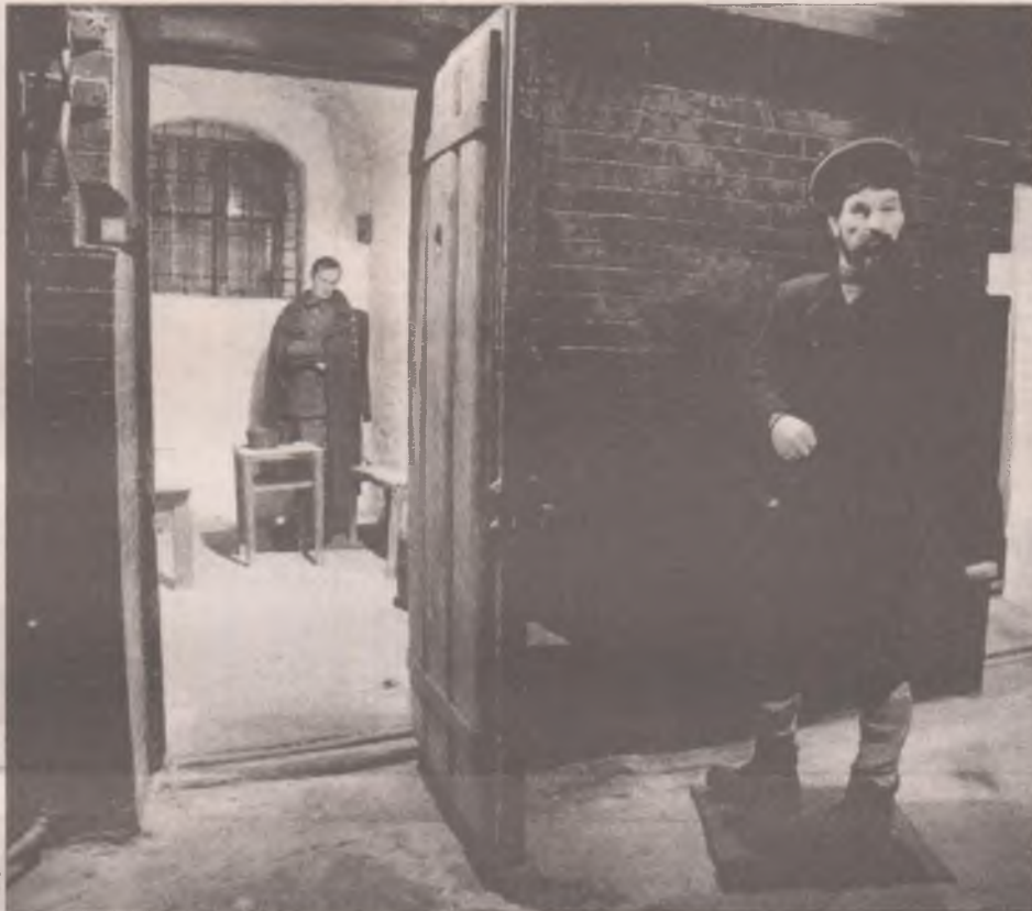
Питерские мастера воссоздали образ живого Адмирала. Но и он обречен отбывать пожизненный срок в камере иркутской тюрьмы

Задолго до того, как Адмирал стал героем одноименного фильма (который я, признаюсь, не смотрел), он мог бы быть сыгран Дворжецким в культовой «Земле Санникова». Именно Колчак возглавил спасательную экспедицию, когда барон Толль (фамилия переводится с немецкого как «Бешеный») затерялся во льдах во время поисков мифической страны. Тридцатилетний гардемарин за 42 дня на соба-