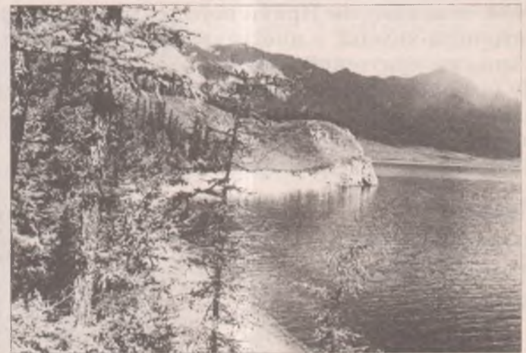
Сибиряки и без интернет-голосования знают, что Байкал - самое удивительное по красоте место на планете