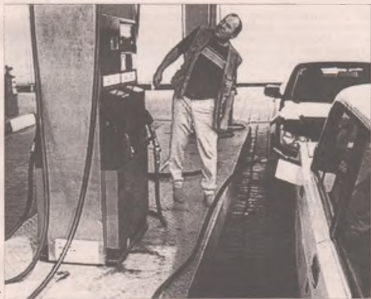
Куда задрали цены?