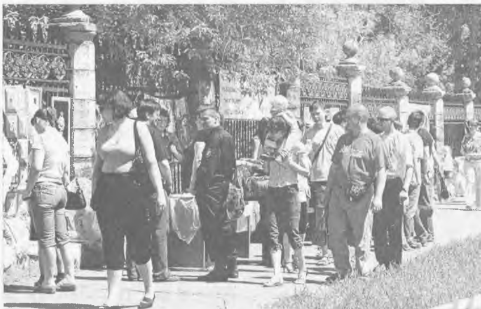
Пешеходы твои — люди не великие, каблуками стучат — по делам спешат. Ах, Арбат, мой Арбат, ты — моя религия, мостовые твои подо мной лежат. (Булат Окуджава)