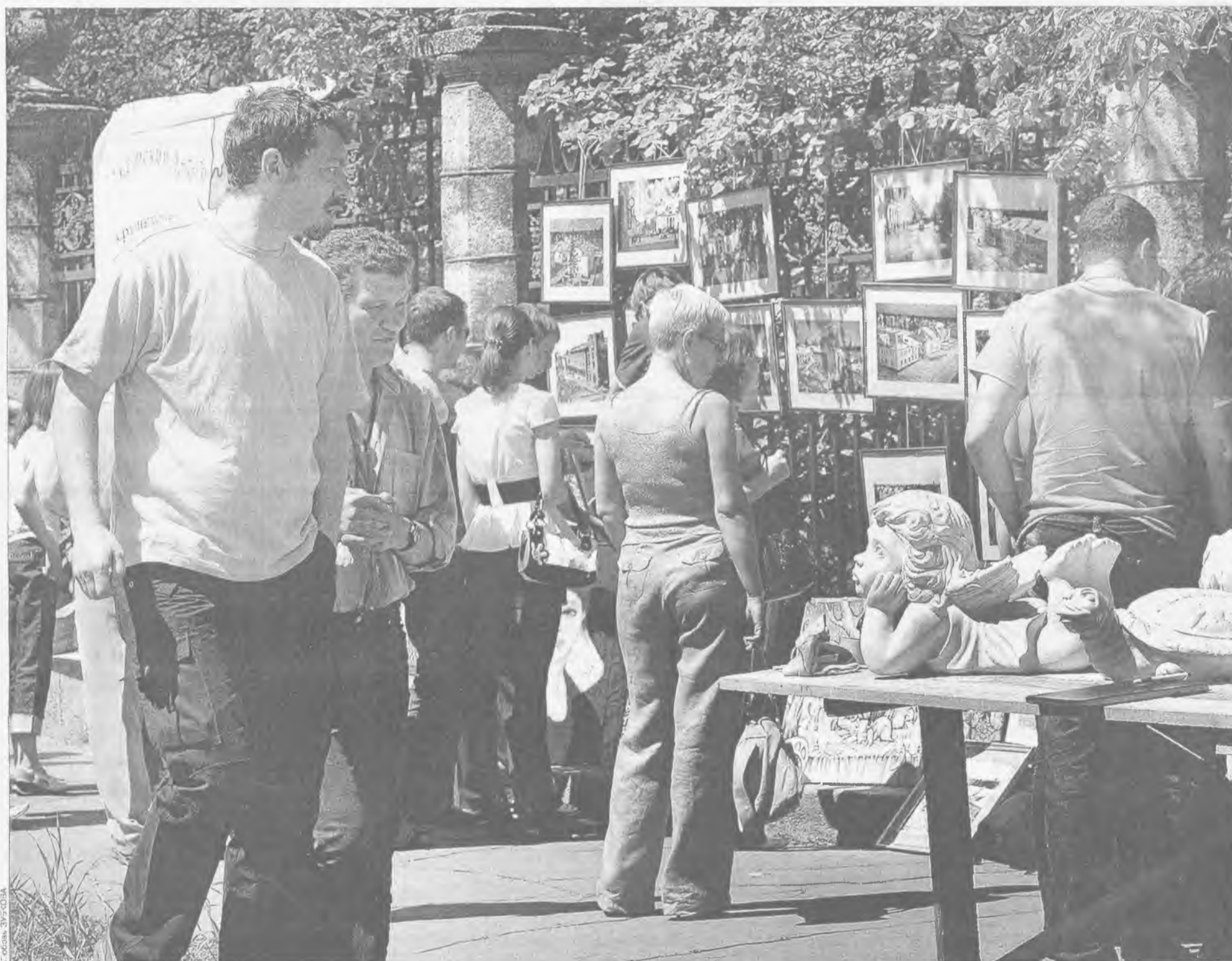
Ангарский Арбат под ангельским присмотром