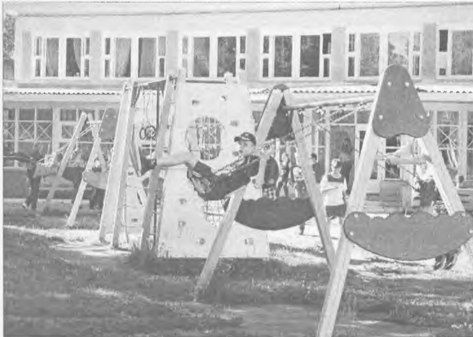
В лагерях АНХК и АЭХК можно отдохнуть с комфортом. Но путёвка обойдётся вам больше чем в 19 тысяч рублей за сезон. Дорого? Ищите другие варианты

Те, кто в бесплатные или льготные программы не попал, отдыхали за свой счёт. Работники АЭХК, АНХК, Сбербанка, ТЭЦ и АУС традиционно вывозили детей в свои ведомственные лагеря за