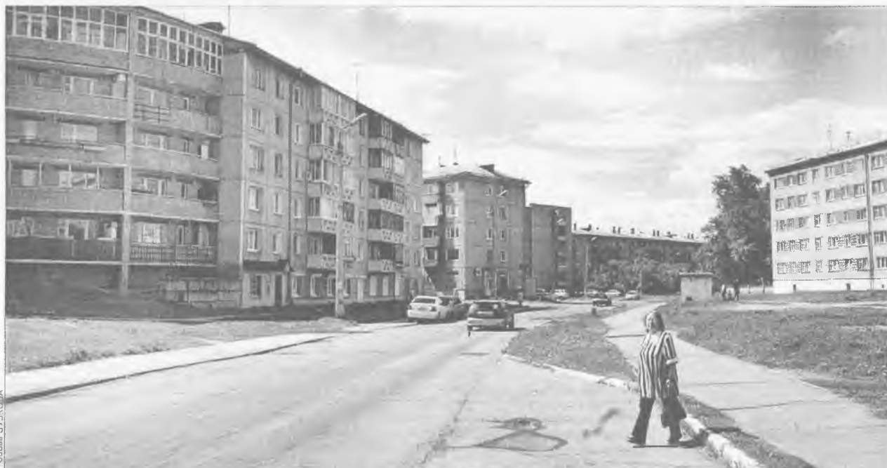
Город помнит бы свою героиню Ольгу Потапову, даже если бы в Ангарске не было улицы в ее честь