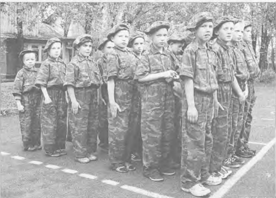
В «Казачьем войске» почти все дети отдыхают бесплатно - по направлению из соцзащиты (как малообеспеченные) или состоящие на учёте в КДН

■ Яна АРХИПОВА, Вячеслав БРЮХАНОВ (фото)