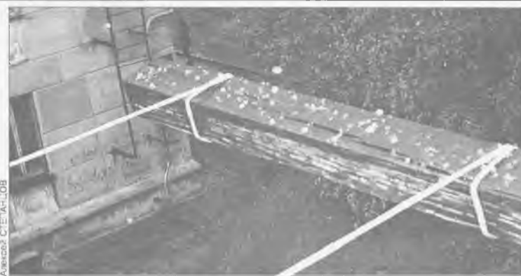
«Подарок» природы запечатлел один из читателей нашей газеты