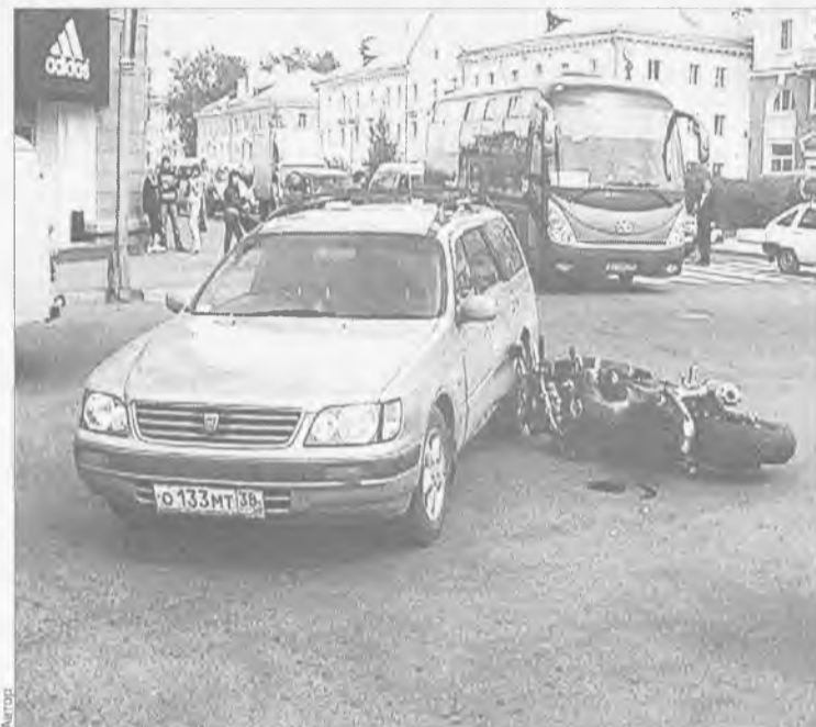
Лихач от помощи отказался