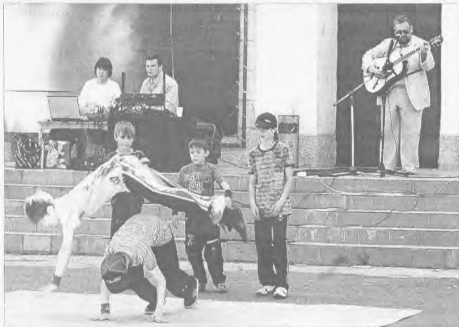
Брейк под авторскую песню