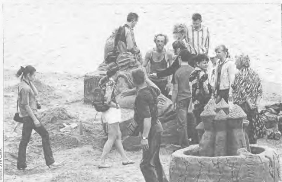
Не стоит путать шоу и детскую песочницу