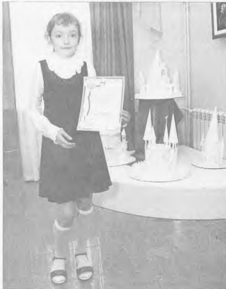
Вот такие дипломы получили все юные авторы, участвовавшие в городском фестивале. И поэты, и художники, и музыканты