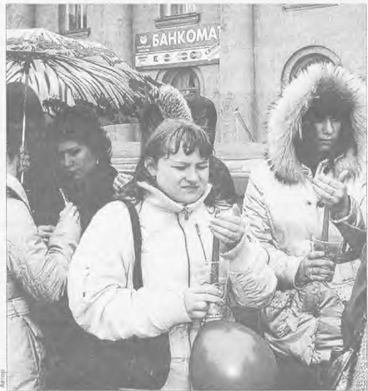
Красные ленточки и свечи - символы памяти