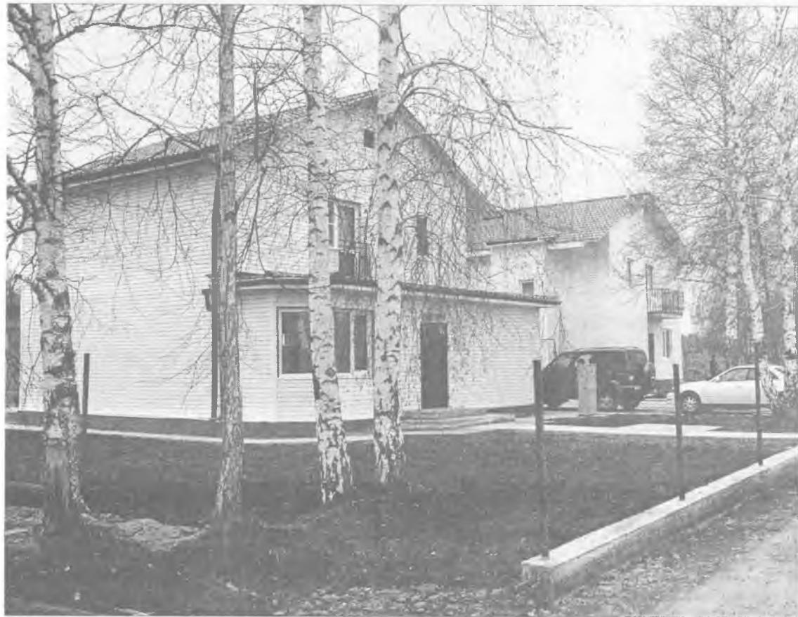
«Молодежные домики» еще в проекте, но деньги на подведение к ним коммуникаций в бюджете уже заложены, так что скоро молодые ангарчане смогут приобрести жилье по цене не более 20 тысяч рублей за квадратный метр