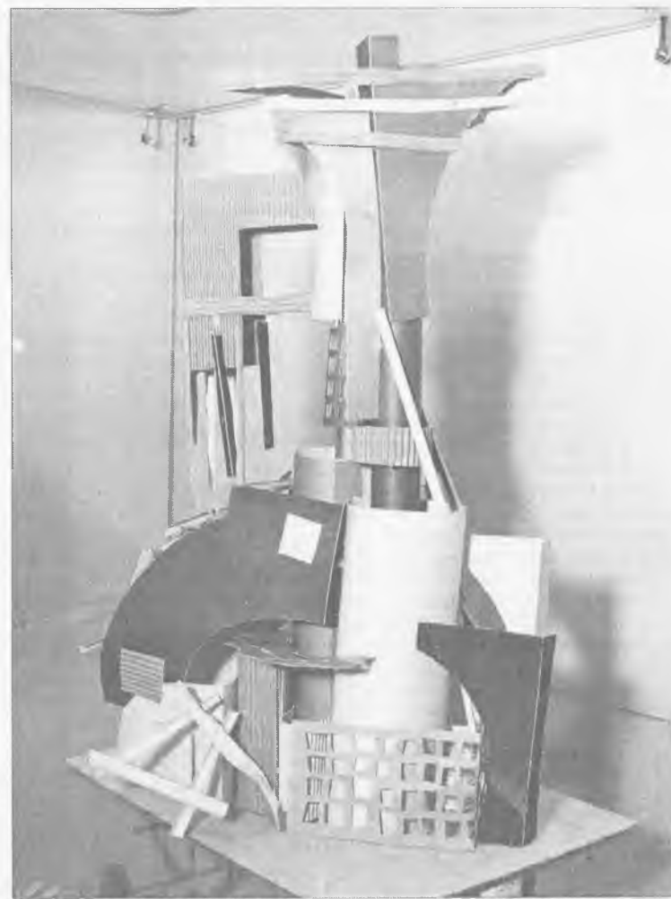
Вообще-то это кофейник. Вы его тут видите? А юные архитекторы видят!