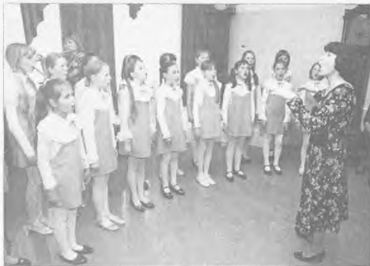
Школа искусств №3 дружно поёт песню про хоббита