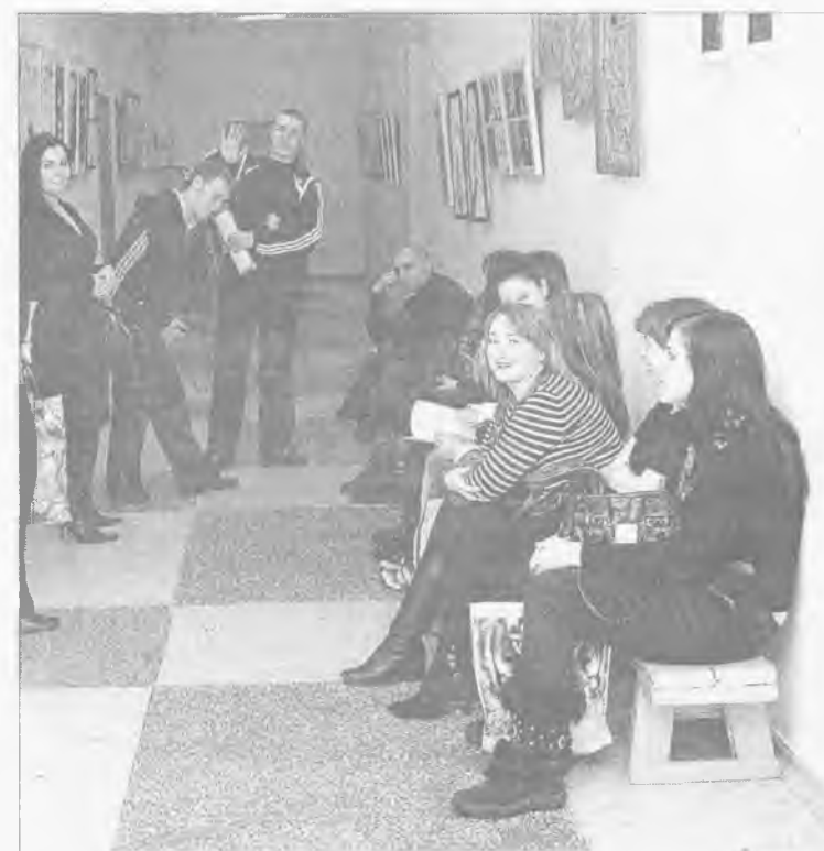
Жизнь полна неожиданностей... Некогда престижные вузовские дипломы сейчас стали никому не нужны, зато выпускники училищ, лицеев и техникумов работодатели ой как рады!