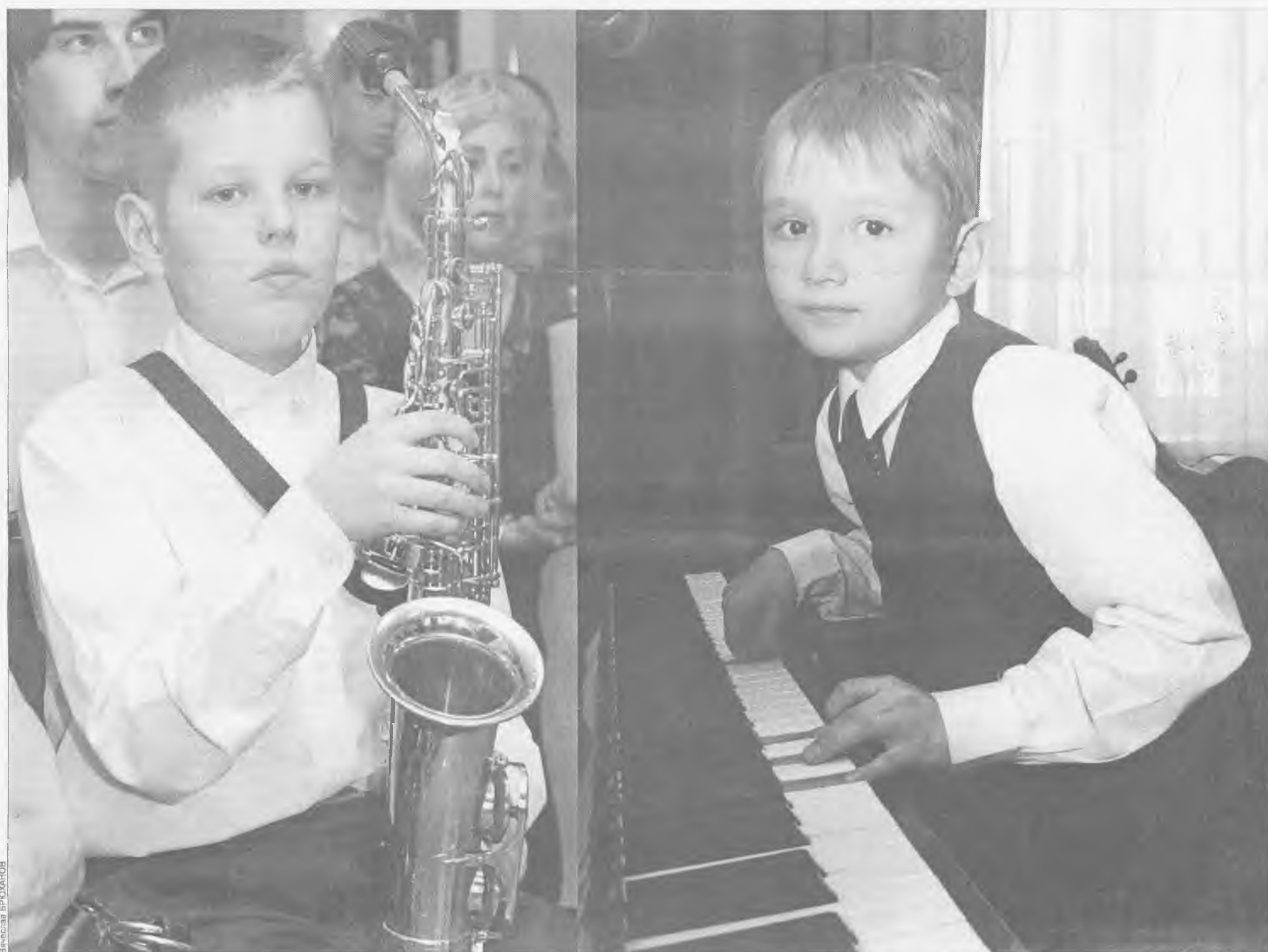
Учат юных композиторов в Центральной детской школе искусств и школе искусств №3. Мелодии у ребят рождаются для «своих» инструментов, а вот аранжировки для хора или квартета - помощь педагогов