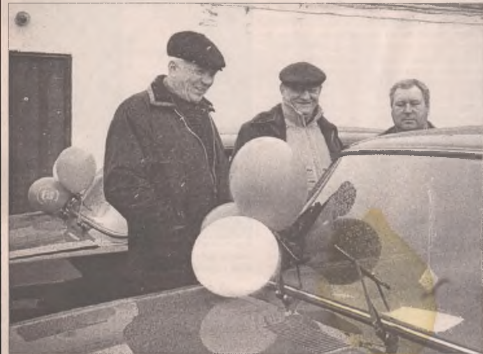
Усть-илимские мужики. Весёлые, деловитые. Увидишь такого - ни за что не поверишь, что инвалид. Только если опознавательный знак на машине выдаст...