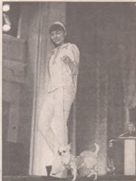
Вы поклонница Пэрис Хилтон? Писк моды для вас и вашей собачки. Как гламурненько!

Ну а лучше всех представили свои коллекции зрители, ателье «Север» и Ангарский промышленно-экономический техникум. С техникумом всё понятно: у этого учебного заведения, единственного в городе, где учат на модельеров, есть прекрасный ресурс - молодые, красивые и творческие студентки. А вот «Север» «подтянул» к своему показу чуть ли не весь город. Вот что значит продвижение коллекции! Пусть и не особо актуаль-