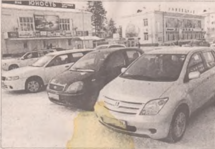
В последнее время в городе наблюдается всплеск автоугонов

Сотрудники милиции считают, что обычной сигнализации часто бывает недостаточно, поэтому желательнее предусмотреть комбинированную систему защиты своего транспорта - сигнализация плюс блокировка. Кроме того, старайтесь не оставлять машину на ночь возле дома: пока вы спите, у преступников будет достаточно времени для того, чтобы отключить