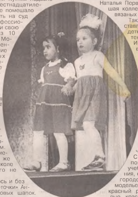
Самые маленькие модели дефилировали по подиуму, держась за руки. Давай, подружка, вместе не так страшно!