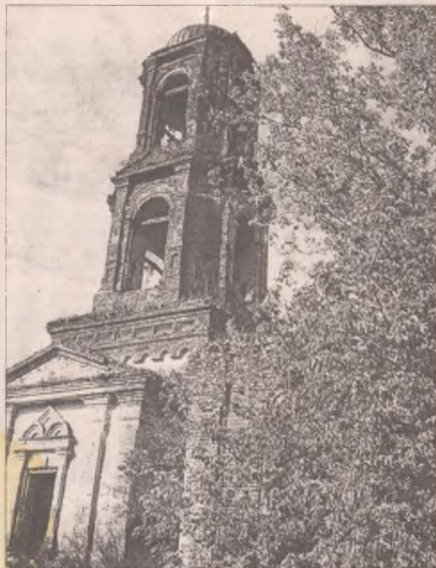
В России еще немало храмов ждут своих духовных хозяев

Когда в 1959 году 67-летнего Й. Слипия суд в очередной, третий раз приговорил к семи годам лишения свободы с отбытием в ИТЛ, он написал: