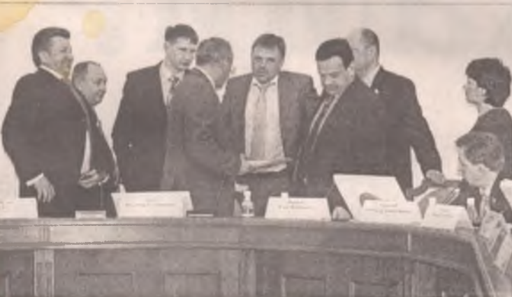
Словосочетание «Единая Россия» стало паролем для пропуска в органы власти

Имя нового главы местного парламента было названо в прессе заранее. Все вопросы еще до сессии Думы были обсуждены на политсовете «Единой России», избранныкам народа оставалось только официально проголосовать за утвержденную кандидатуру.