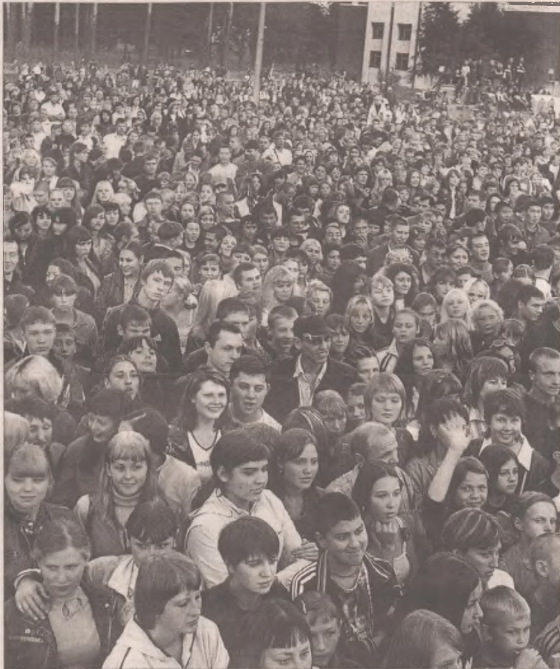
Пусть имен будет много и разных - от этого мир станет краше!