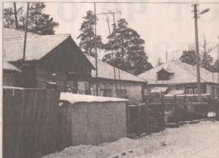
Поселок Юго-Восточный включен в программу переселения

В итоге Ангарск первым из муниципалитетов Иркутской области подал документы в региональную комиссию. Согласно заявке город претендовал на 239 миллионов рублей. На эти деньги можно было приобрести 7380 квадратных метров жилья для переселения людей, проживающих в