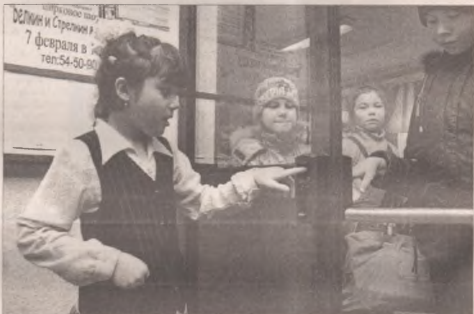
Ткну пальчиком - дверь и откроется!

Белоус, несмотря на эти плюсы системы, она останется единственной в городе.