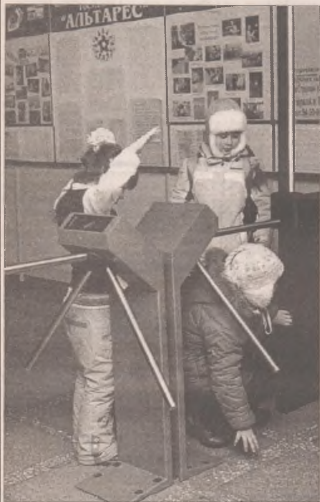
Малыши, устав стоять, могут и под турникетом пролезть, а вот пятиклассник уже не пройдет