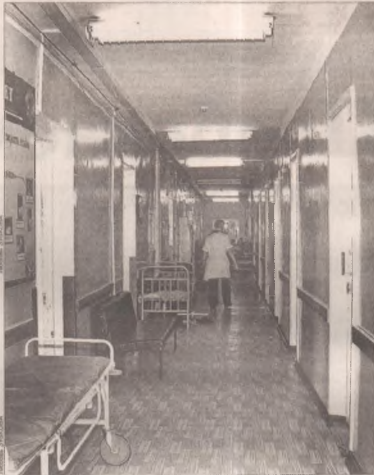
Предложили оплатить лечение лично в руки доктору? Жалуйтесь!

Телефон горячей линии в Управлении здравоохранения: 52-27-18. Ваши сообщения готовы принять с 8 до 17 часов, перерыв с 12 до 13 часов.