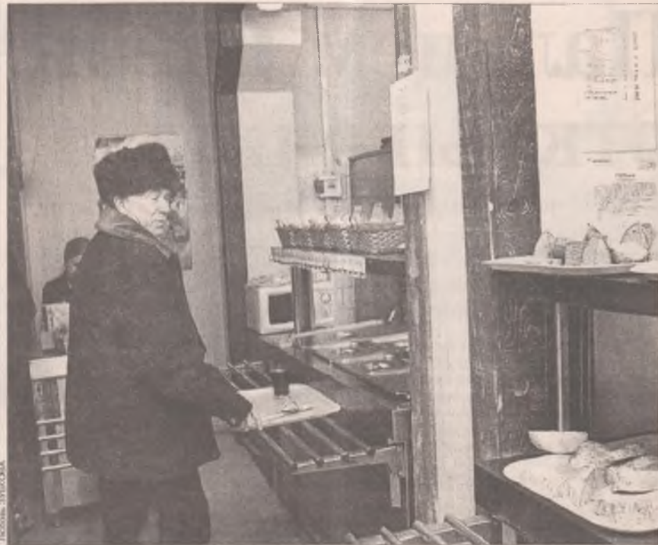
Обед из трех блюд можно купить за 40 рублей!

- Мы сами производим продукцию, поэтому появилась возможность убрать торговую надбавку с отдельных изделий полностью. Ват-