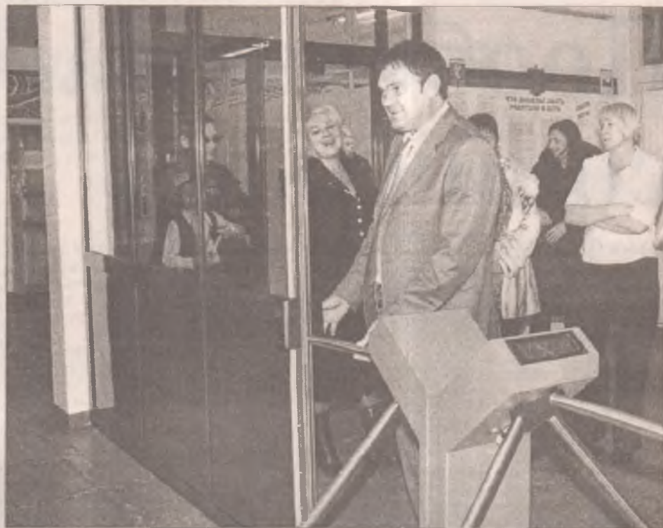
Система безопасности не пропустит в школу даже мэра