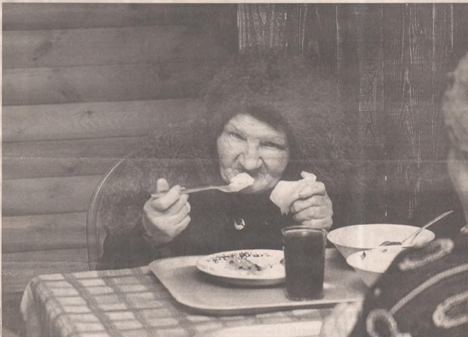
Клиентами социальных кафе станут малообеспеченные ангарчане, в основном пенсионеры. А вот бомжам здесь не место!

С 1 февраля в городе, кроме социальных магазинов, появились ещё и социальные заведения общепита, а также предприятия обслуживающей сферы. Что это значит? Да то, что обед из трёх блюд можно теперь откусать за 40 рублей, а вполне сносно постричься - за полтинник!