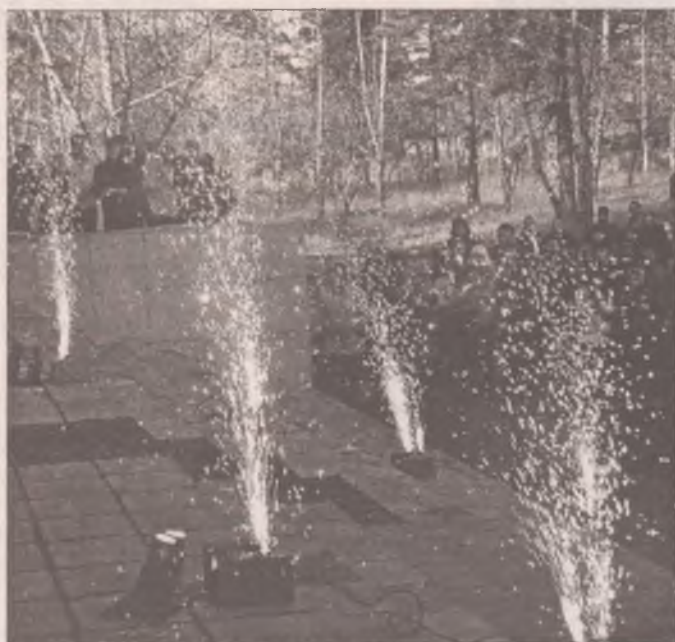
Пиротехника: из искры не возгорится пламя

Чтобы не испортить людям настроение и обезопасить их жизнь и здоровье от опасных пиротехнических изделий и некачественного алкоголя, по приказу Министерства экономического развития, труда, науки и высшей школы Иркутской области проводятся предновогодняя акция