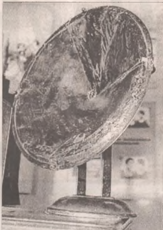
Проводное радио - позавчерашний день средств массовой информации