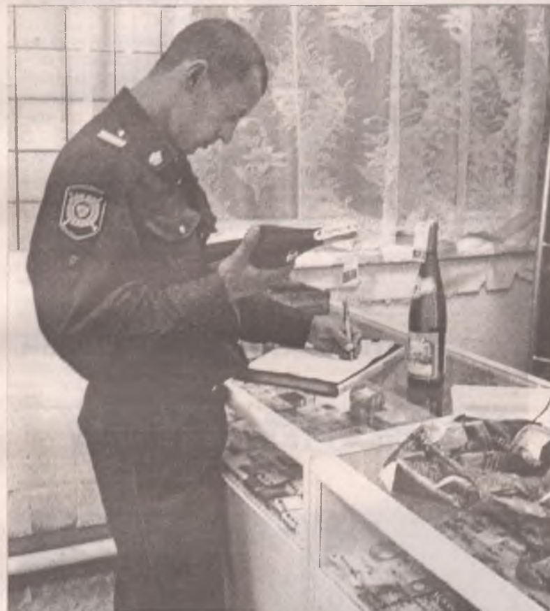
А документы на шампанское где?

«Пиротехника» и месячник контроля за оборотом и качеством алкогольной продукции.