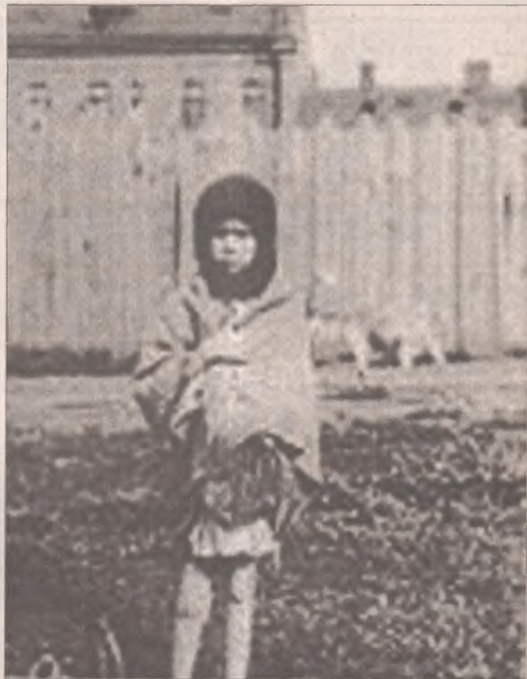
На Украине рассекречены архивы ГПУ о голодоморе, дело - за Россией

Как и война, голодомор прошелся по каждому второму или третьему человеку в России. Раньше я плотно занимался темой репрессий, тюрем, ссылок, концентрационных лагерей в Иркутской области, нынче переключу внимание на исследование того,