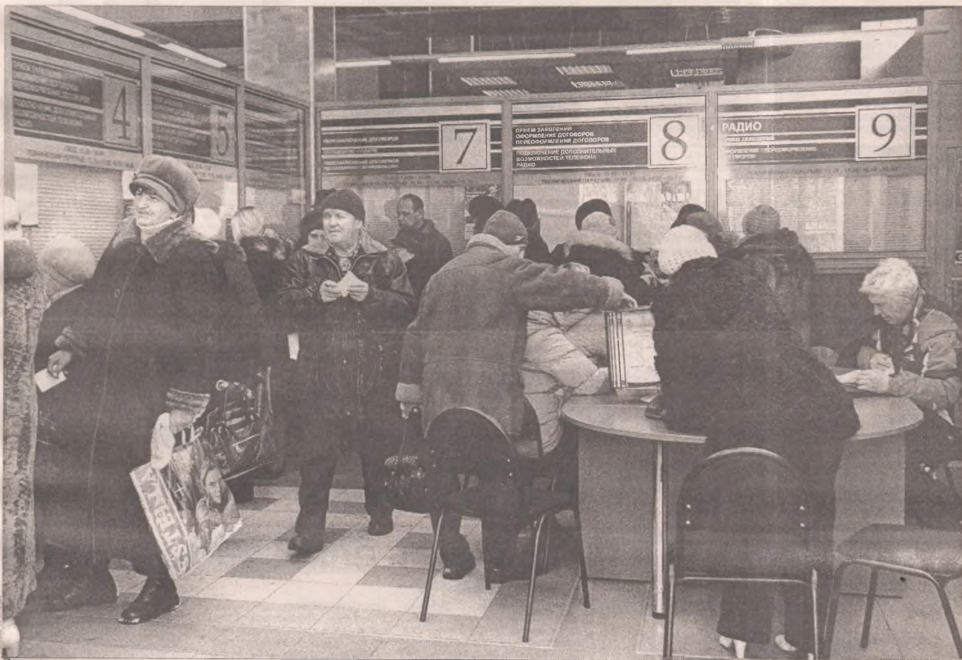
Пенсионеры в массовом порядке отказываются от радиоточек: есть другие способы слушать радио и при этом платить меньше

В агентстве по предоставлению услуг связи населению ОАО «Сибирьтелеком» пенсионеры выстраиваются в очередь с заявлениями на отключение радиоточки. Это связано с тем, что с 1 декабря 2008 года «Сибирьтелеком» ввел единый тариф на услуги проводного вещания. Теперь за радиотрансляционную точку придется платить 60 рублей в месяц - почти в три раза больше, чем по прежнему тарифу - 20 рублей 50 копеек.