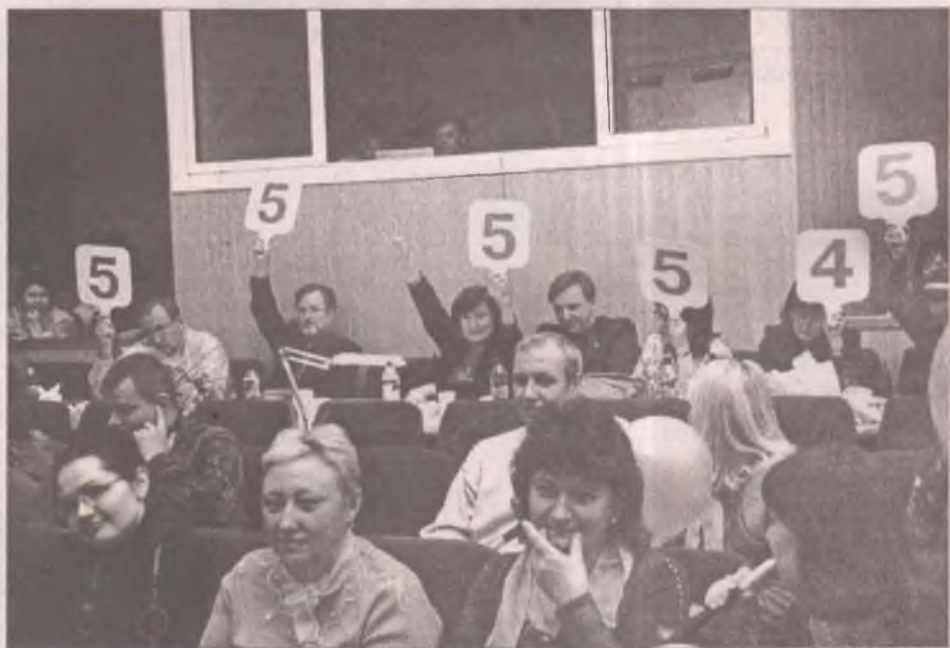
Строгое жюри троек не ставило. Все участницы стали отличницами и ударницами