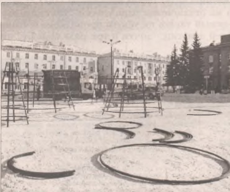
Ёлку на площади уже собирают. Лёд завозят. А значит, кризис Новому году не помеха

центральной площади города будут бык - символ наступающего 2009 года, разных размеров горки, сказочные персонажи и необычный лабиринт. Новшеством станет ка-