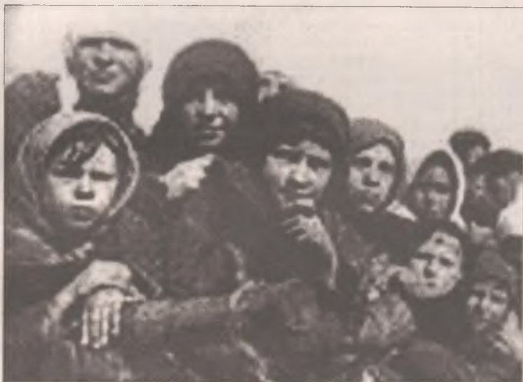
Как и война, голодомор прошелся по каждому второму или третьему человеку в России

Несколько лет назад я побывал на родине мамы и поразился, как славно здесь живут люди. На Черноземье хорошо растут хлеб, подсолнухи, фрукты. Голодать может только самый ленивый и неспособный человек. Однако Сталин довел людей до такого состояния, что они, живя на плодородной земле, не могли себя прокормить. Сколько могла, семья терпела испытания, унижения и голод, а потом согласилась на переезд в Сибирь. Агитаторы из Иркутской области рассказывали (сейчас бы выразились иначе: вешали лапшу на уши) крестьянам о сытой жизни, о перспективах, о работе, и из Тамбовской, а также из Воронежской области и других голодных краев потекли целые эшелоны за Урал. Конечно, в Сибири голодные люди увидели лагеря, зек, но при этом получили возможность работать и получать кусок хлеба не как крепостные крестьяне.