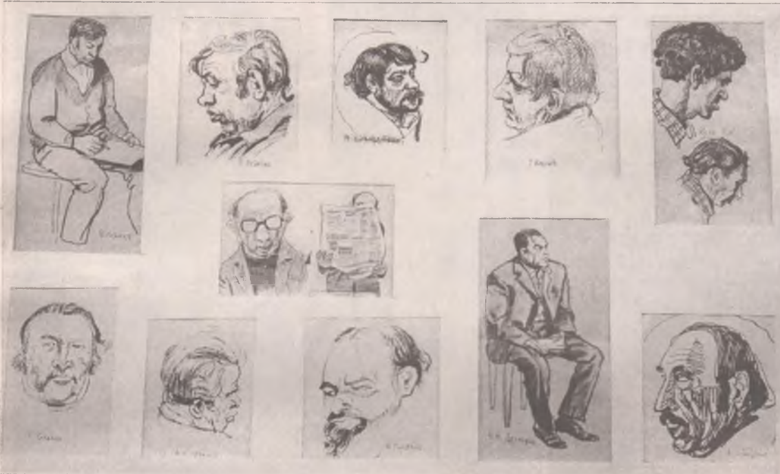
Геннадий Козлов: зарисовки с политзанятий

Выставка графики открылась 4 декабря в ангарском Художественном центре.