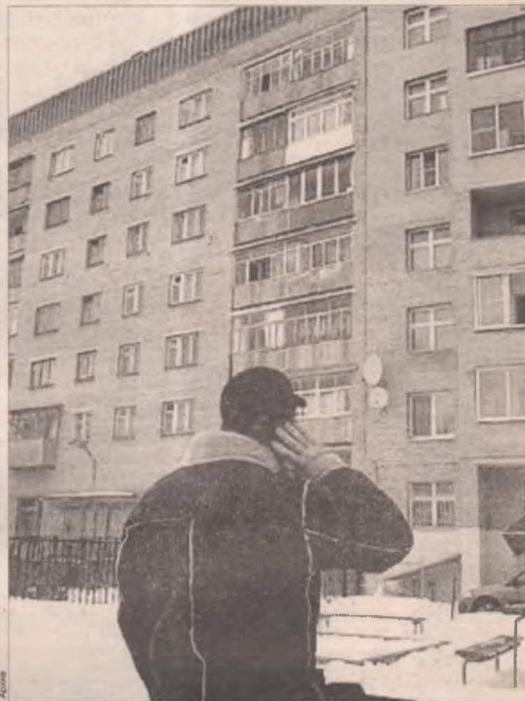
Собственнику жилья предстоит сложный выбор

- Собственник квартиры подписал договор с управляющей компанией на пять лет, а компания год прора-