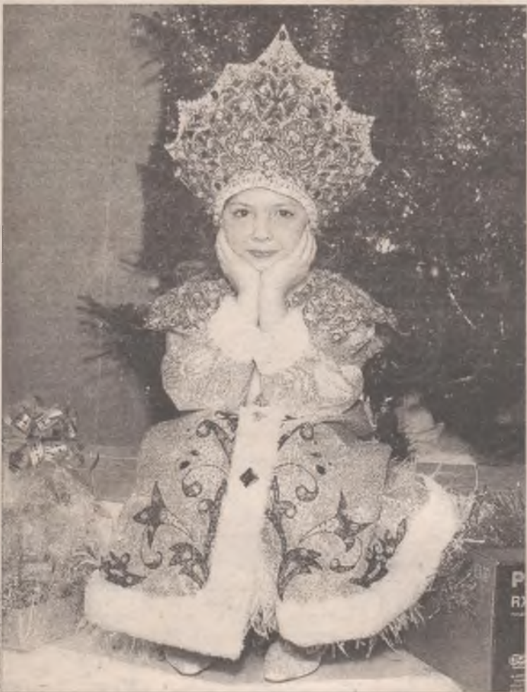
Теперь мы знаем, что внучку Деда Мороза зовут Полина

Шестнадцать маленьких снежинок кружили 25 декабря по сцене ДК нефтехимиков. Все они были очаровательны, но лишь одной предстояло стать победительницей конкурса «Мисс Снегурочка-2006».