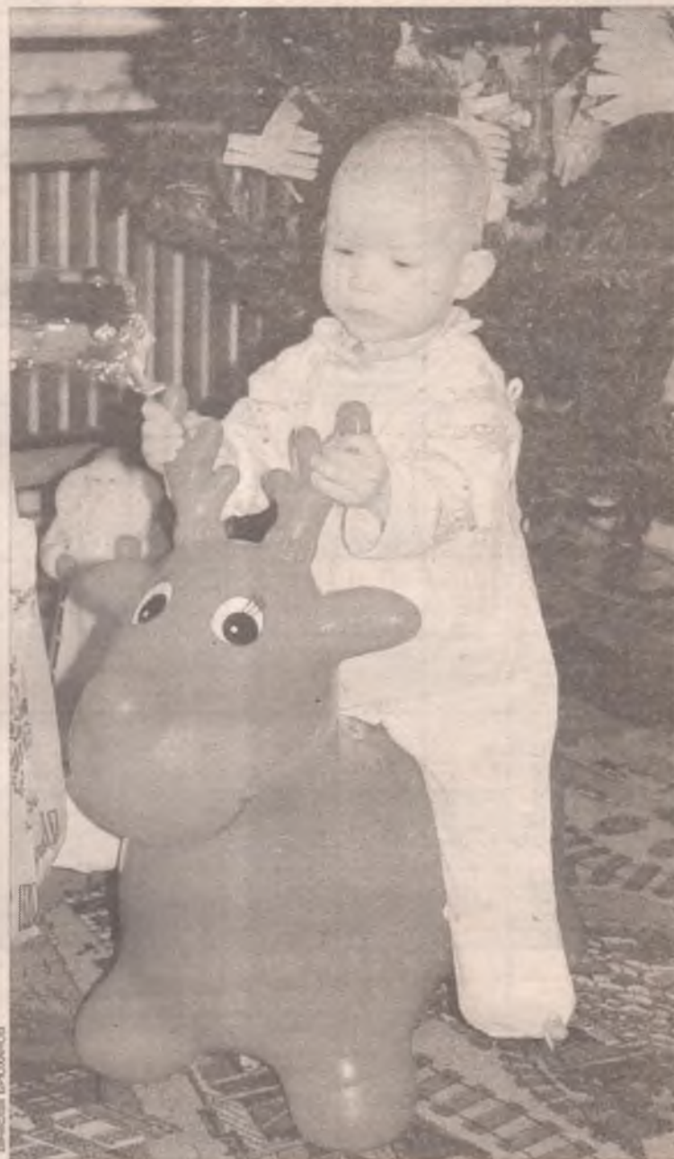
Мне так плохо одному...

- В Москве мы имели возможность познакомиться с опытом работы организации «Приют детства», которая была образована в 1999 году. Главные ее цели - выявить те