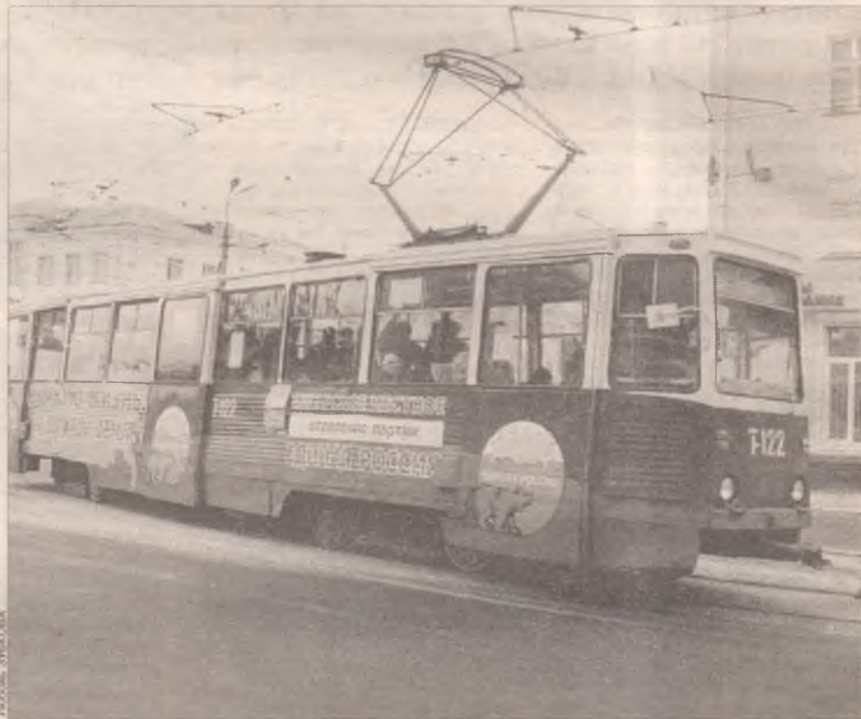
Рекламу на транспорте обложили ЕНВД

понятия розничной торговли для целей ЕНВД не будут иметь значения ни форма (она может быть наличной или безналичной), ни лицо (физическое или юридическое), которому продан товар. Главным критерий – это осуществление продавцом предпринимательской деятельности по продаже товаров на основании договоров розничной купли-продажи. То есть со следующего года определение розницы в