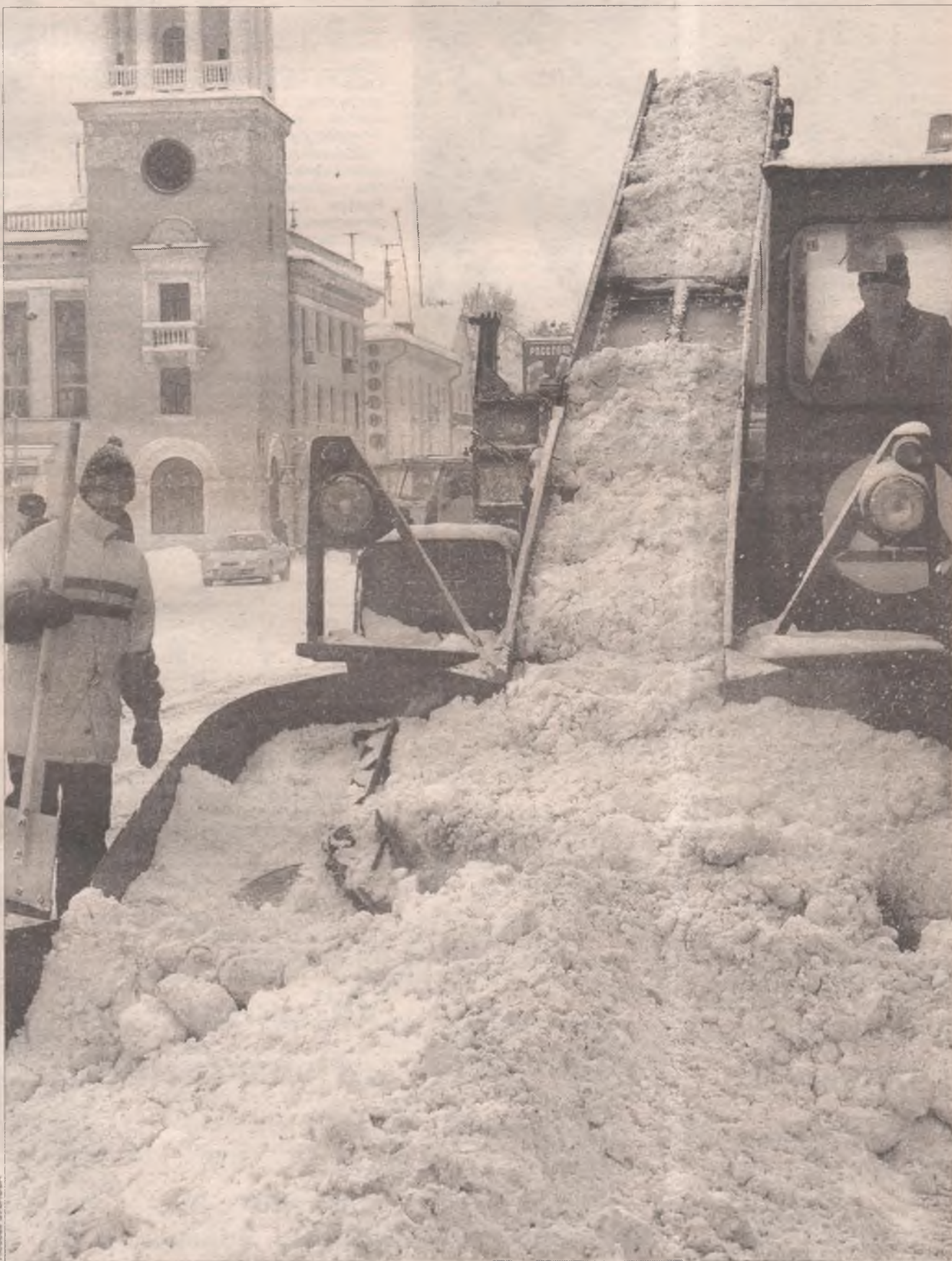
Коммунальные службы работают в усиленном режиме

Прошедший над Иркутской областью теплый фронт, ставший причиной выпадения обильных осадков, сдвинулся на Урал, оставив в Сибири морозную погоду и горы снега, которого за неделю выпало больше месячной нормы. Коммунальные службы Ангарска переведены на круглосуточный режим работы. Ежедневно за город вывозят более двухсот грузовиков снега, но это не спасает ситуацию. Город по-прежнему утопает в сугробах.