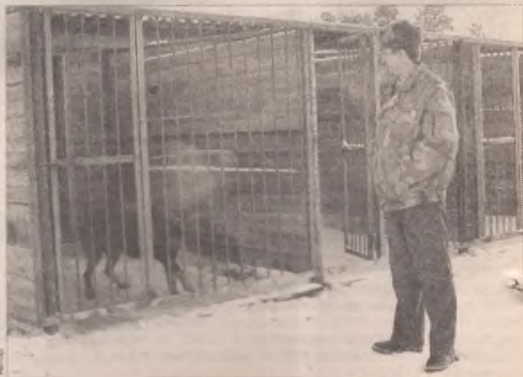
Пока в питомнике один постоялец