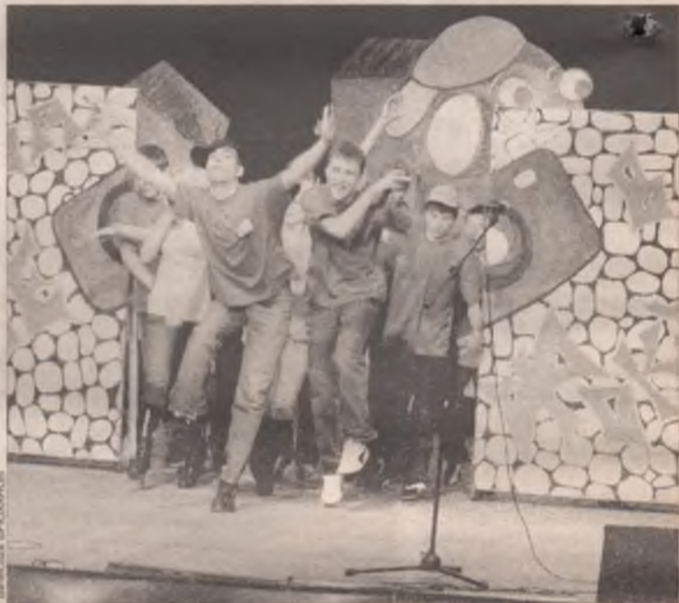
Уровень ангарского КВН неуклонно растет. Жить стало веселей?

- Зачем проводить мотокросс за городом, когда улица Чайковского ничуть не лучше?!