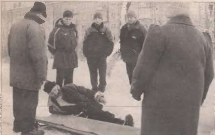
Спешка довела до беды

Вечером 21 декабря на улице Горького пострадал пешеход. Пожилой мужчина поторопился перейти дорогу в неустановленном месте и попал под машину. Неосторожный участник дорожного движения доставлен в БСМП с переломами ног. Обстоятельства происшествия расследует группа дознания Ангарской ГИБДД.