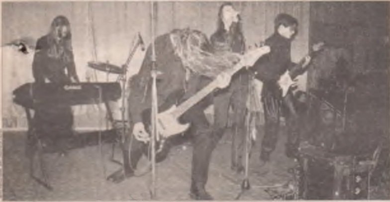
Изгиб гитары черной я сотрясаю нежно...

В зале ДК «Энергетик» все хрипело и рычало. Здесь прошел рок-концерт. Досталось и аппаратуре, и публике.