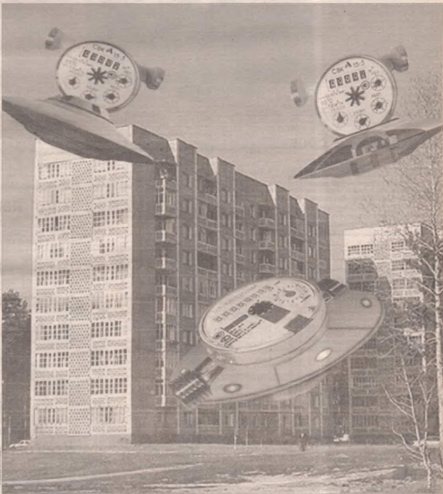
В 2006 году Ангарск ожидает «нашествие»... счетчиков

Уже в будущем году Ангарское муниципальное образование может получить около 130 миллионов рублей на осуществление программы энергоресурсосбережений. Это станет возможным благодаря подписанному в ноябре 2005 года соглашению на выделение кредита в 30 миллионов евро между Иркутской областью и Европейским банком реконструкции и развития (ЕБРР).