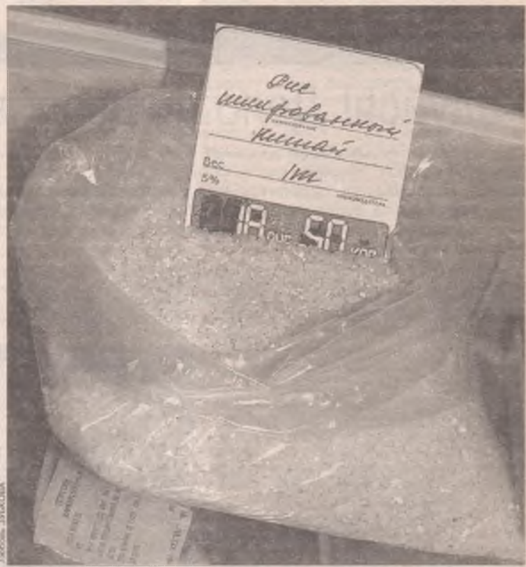
Сегодня 18.50, а завтра?

Специалисты отмечают, что если по объему продукции отечественные производители сумеют заменить зарубеж-