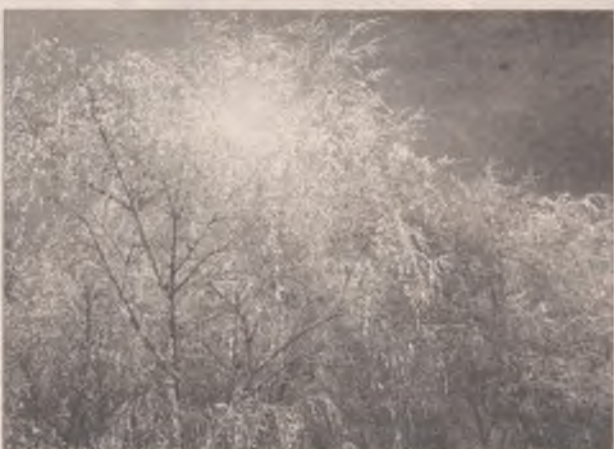
Впереди январская стужа, но время уже покатилось к весне

друга римляне. - Еще один год прошел, дело к весне... - И шли радоваться.