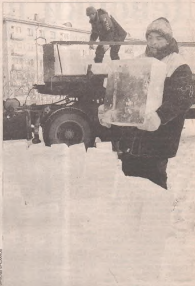
В минувший четверг Управляющая компания «ДОСТ» совместно с ангарскими предпринимателями приступила к возведению ледового городка рядом с ДК «Современник»