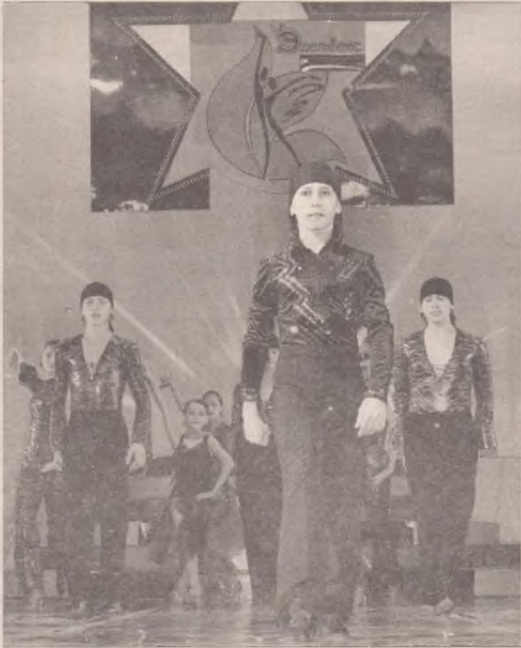
Испанские страсти в Ангарске