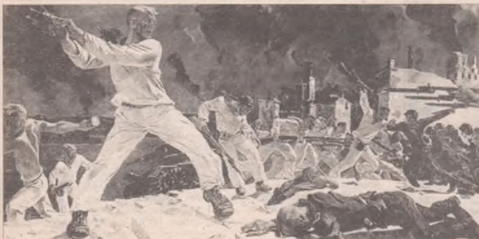
Дейнека «Оборона Севастополя»

В трудные минуты боя, когда враг находился в полусотне шагов, красноармейцы пускали в ход «карманную артиллерию» - так бойцы прозвали ручные гранаты. Этот вид оружия не претерпел изменений за годы войны. Пожалуй, самую большую известность получила «лимонка». Из-за характерной формы корпуса такое прозвище солдаты дали гранате Ф-1.