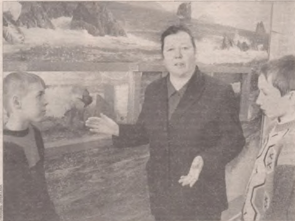
В квартире - кусочек моря

Прежде всего при выборе рыбок следует учесть собственный темперамент. Далее (обязательно!) - совместимость ваших будущих питомцев, поскольку среди них есть хищники, например, все представители цихлидовых (кроме скалярий). Они способны закусить любой рыбкой. В то же время такие хищники как барбусы в большом аквариуме практически безопасны. Есть экземпляры, которые едят и своих, и чужих мальков. Кроме того, рыбы одного вида предпочитают определенный ярус своего дома: верхний слой - щучки, гурами, в середине аквариума - данио рерио, неоны и, наконец, придонные - сомки, лабео. В результате получаем населенный во-