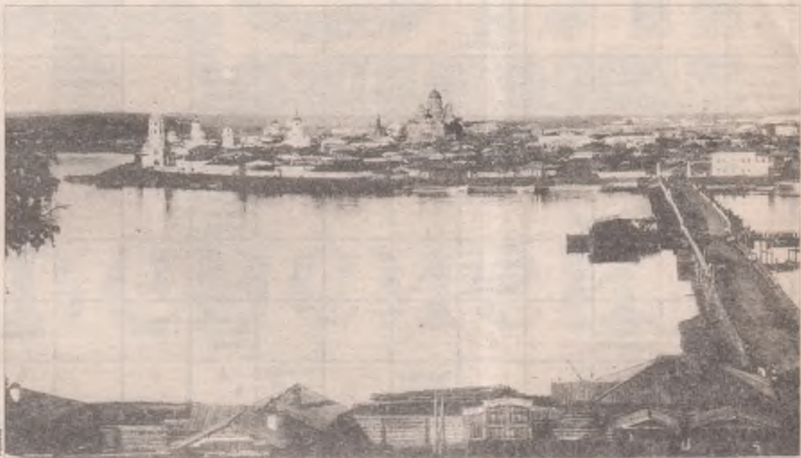
Иркутск. Понтонный мост с Глазковского предместья, за который в декабре 1917 года шли кровопролитные бои

Получив такое подкрепление, большевики стали повсеместно теснить офицеров и юнкеров. Оборона Белого дома продолжалась семь дней, жаркие бои велись возле понтонного моста у прогимназии Гайдук, у военного училища, 2-й школы прапорщиков, в расположении казачьего дивизиона и детской больницы. Вскоре красными был захвачен Тихвинский собор, на колокольне которого стоял юнкерский пулемет. Кольцо вокруг юнкеров в центре Иркутска сжималось. Затем красные уничтожили еще один вражеский пулемет, установ-