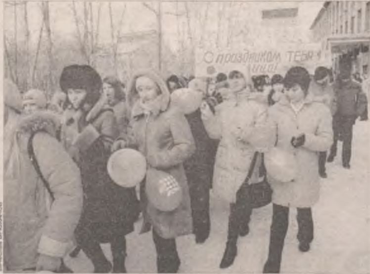
Праздник начался торжественным шествием по улице Жаднова, которая была украшена шарами и плакатами

- Во время краеведческих изысканий мы с ребятами обнаружили, что улица Жаднова