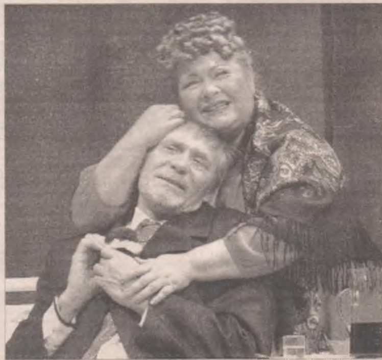
Нина Усатова и Александр Михайлов не только талантливо играют, но и замечательно поют