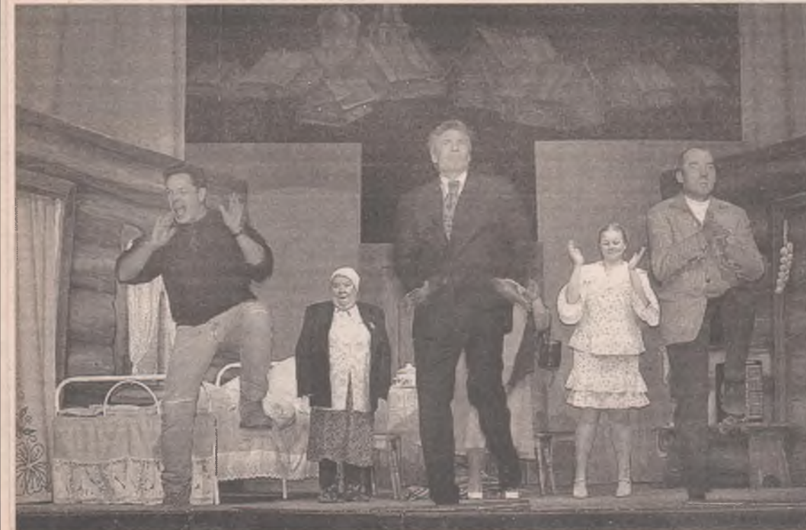
Всё хорошо, что хорошо кончается