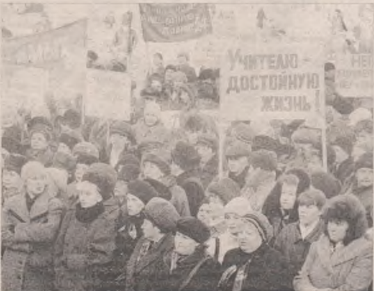
Митинг. Октябрь 2002 года