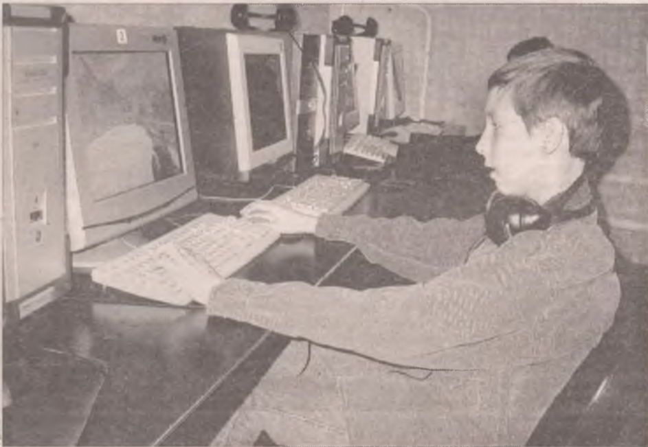
Интересно, родители знают, что дети играют?