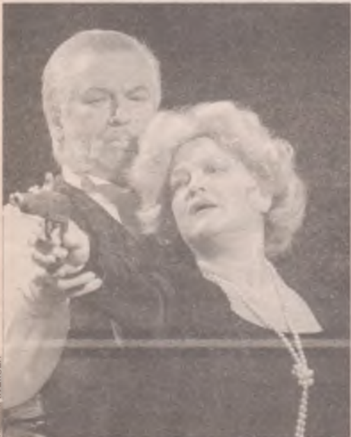
«Ах, учите меня, учите!»