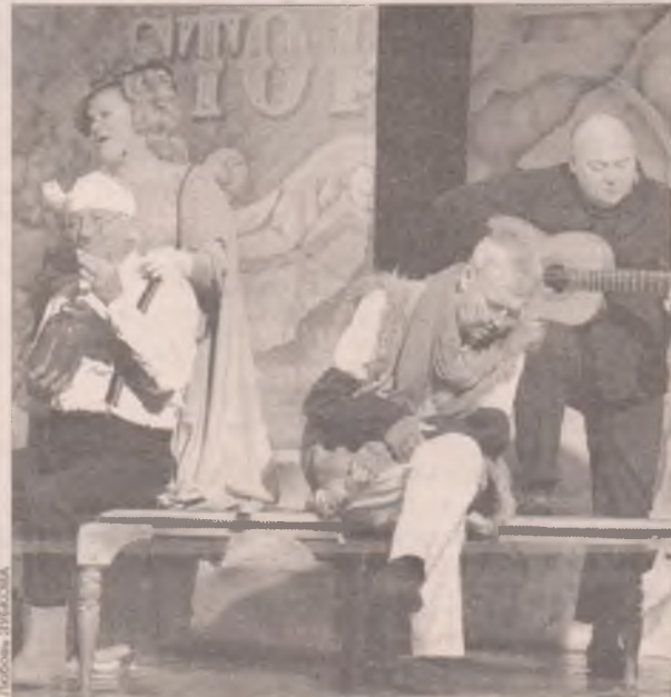
Праздник актерского мастерства