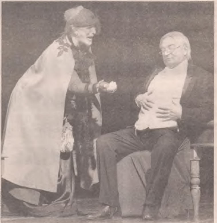
- Подайте, Христом Богом прошу!