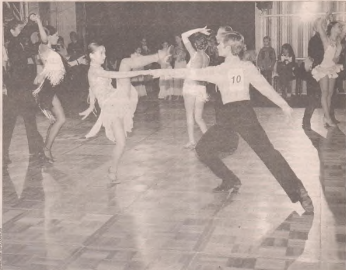
В воскресенье, 4 декабря, в ДК нефтехимиков кипела жизнь, царил страсть: здесь проходил 3-й турнир по спортивным танцам «Кубок мэра-2005». Более 200 пар из 22 клубов Ангарска, Иркутска, Красноярска, Улан-Удэ, Усть-Илимска и Читы скользили по паркету, покоряя жюри и зрителей. Ангарские танцоры галантно уступили призовые места гостям соревнований: три кубка достались иркутянам, еще один уехал в Читу.