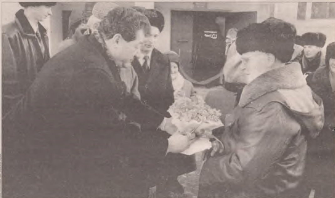
В Ангарске с начала года справили новоселье 25 семей фронтовиков, до конца года к ним присоединятся еще 22 семьи.