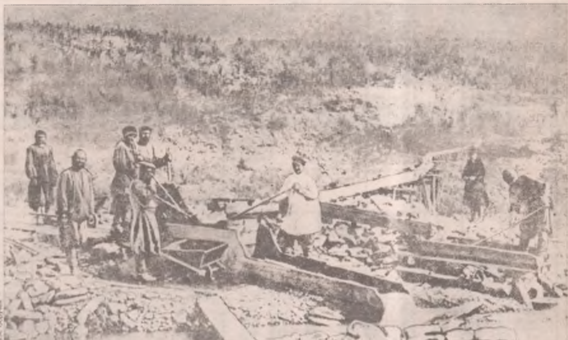
Отработка россыпи на реке Лене, 1891 год

Вторая алмазная россыпь на Урале была обнаружена у села Промысел, третья – у деревни Северной, рядом с Кре-