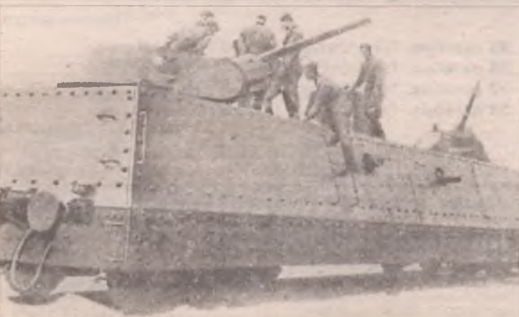
Бронеплощадка боевой части советского бронепоезда

В начале Великой Отечественной войны, стараясь восполнить большие потери в танках, командование Красной армии широко использовало изготовленные в Брянске бронепоезда. Каждый из них представлял сложный комплекс, состоявший из боевой части и базы. Боевая часть включала бронепаровоз, две бронеплощадки и 2-4 контрольные платформы для защиты от мин.