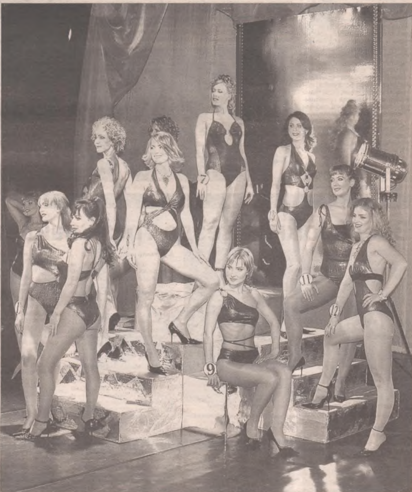
Вот такие красавицы работают на Ангарском электролизном химическом комбинате!

Женщина – музыка, загадка, искушение, бесконечное искусство перевоплощения. Это блестяще доказали участницы конкурса красоты «Мисс АЭХК-2005», который проходил в ДК «Современник» 21 октября.