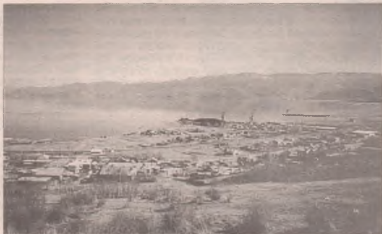
Култук - по-тюркски буквально означает подмышка, а также угол, тупик, залив моря или озера

Бутырки (деревня). От русского слова бутырки - дом на отшибе; селитьба, отдельная от общего поселения. Бутырки, возникшие в стороне от большого села Оёк, разрослись в крупный населенный пункт.