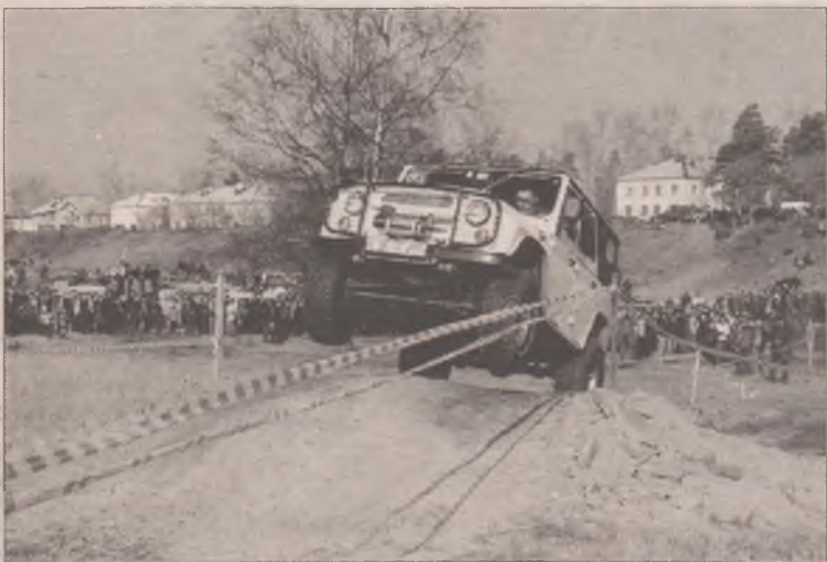
Лошадиные силы в умелых руках - залог яркого зрелища