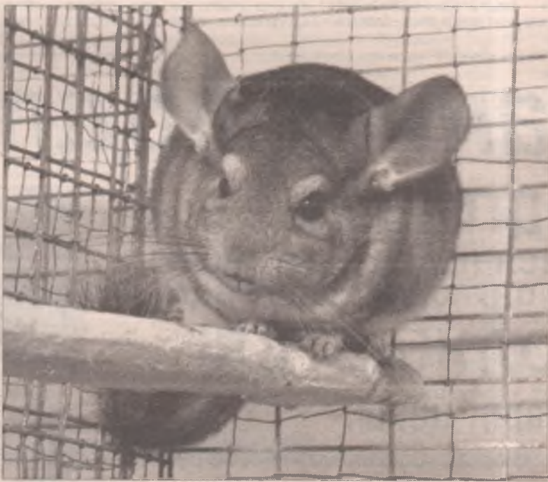
Такая очаровашка на шубу не годится