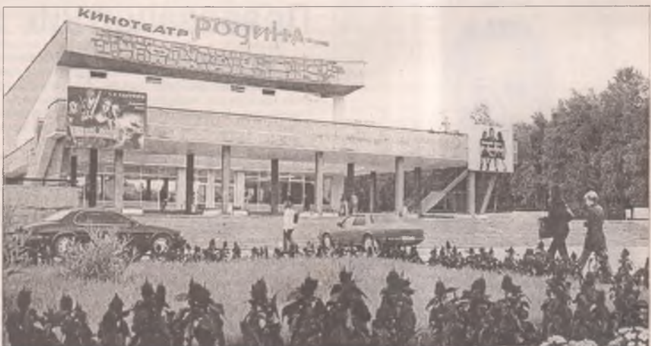
Музей, часовня, парк. Не каждый город может похвастать даже этим. Мы взяли за дело, и теперь кинотеатр "Родина" и прилегающая территория - один из культурных центров Ангарска. Абсолютно мирный мемориал Победы лег словно пластырь на рану. Но еще предстоит немало потрудиться, чтобы воплотить все задумки...