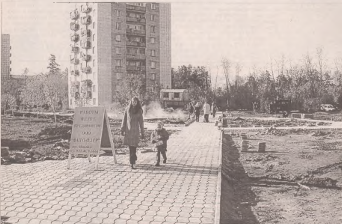
Велика Сибирь. Может, поэтому в Ангарске долгие десятилетия гектары земли оставались неосвоенными, причем не на окраинах, а почти в самом центре. Сиротливые "плешины" использовались жителями окрестных домов для выгула собак...