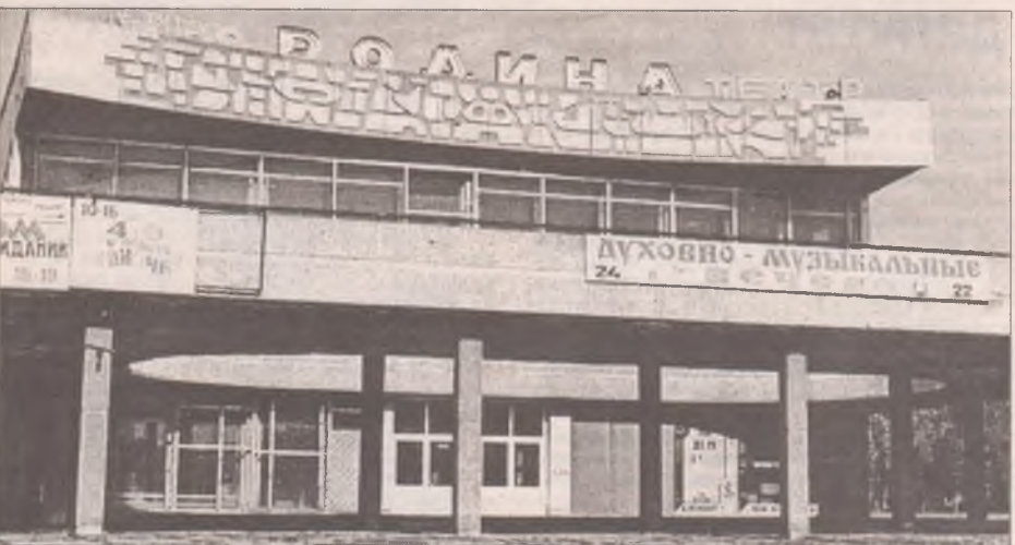
Родина. Сколько спето песен и снято фильмов о подвигах нашего великого Отечества. В тяжелые годы становления новой России за чем-то большим мы не видели малого и теряли его, не понимая, что теряем все. В самом большом кинотеатре области продавали мебель, окрестности превратились в "горячую точку". Ради наркотиков, продающихся здесь почти в открытую, вас могли покалечить и ограбить даже днем. Кажется, что это было так давно...