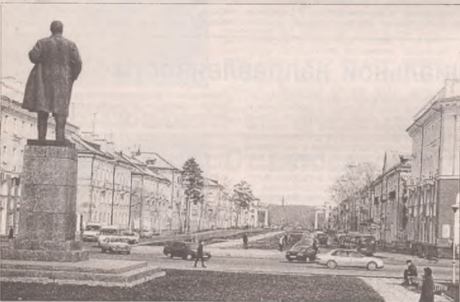
Самым долговечным наследием революционного восстания 1917 года оказалось имя вождя. Площадь Ленина - визитная карточка Ангарска. От железнодорожного вокзала до знаменитого шпиля, вознесшегося над площадью, по прямой меньше двух минут езды. Совсем недавно эти места выглядели обшарпанно и уныло. У многих ангарчан, возвращавшихся домой из отпусков, первые минуты в родном городе провоцировали депрессию...