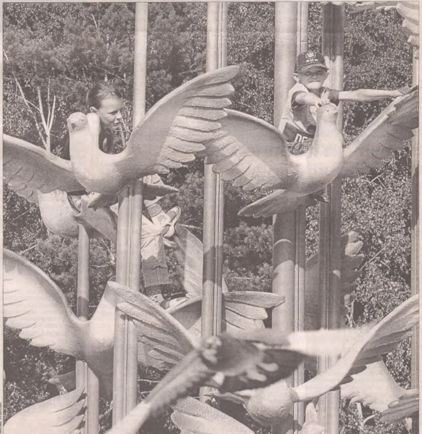
Как хорошо, что наши дети видят Ангарск таким...