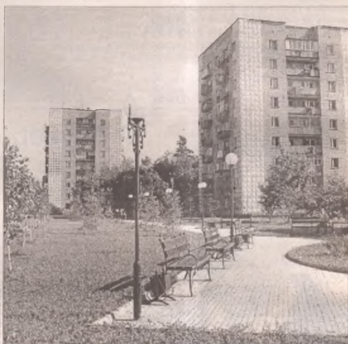
Теперь многие бывшие пустыри превратились в уютные места для прогулок, отдыха и свиданий. Ярким примером этого служит сквер, ставший "изюминкой" 85 квартала. Рядом спортивный клуб, Аллея любви и... ЗАГС. А из животных на лужайке среди скамеек можно увидеть только веселого бронзового сурка