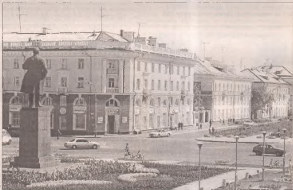
Теперь на улице и на площади имени Ленина можно проводить сеансы релаксации. Ничто здесь не способно утомить ни взгляд, ни мысли (если не брать в расчет каменного мужчину в пальто). И вроде невзначай, но совершенно закономерно не так давно мы узнали, что ансамбль буквально за год помолодевших зданий в этой части города давным-давно причислен к памятникам архитектуры. Приятно. А главное - просто красиво!