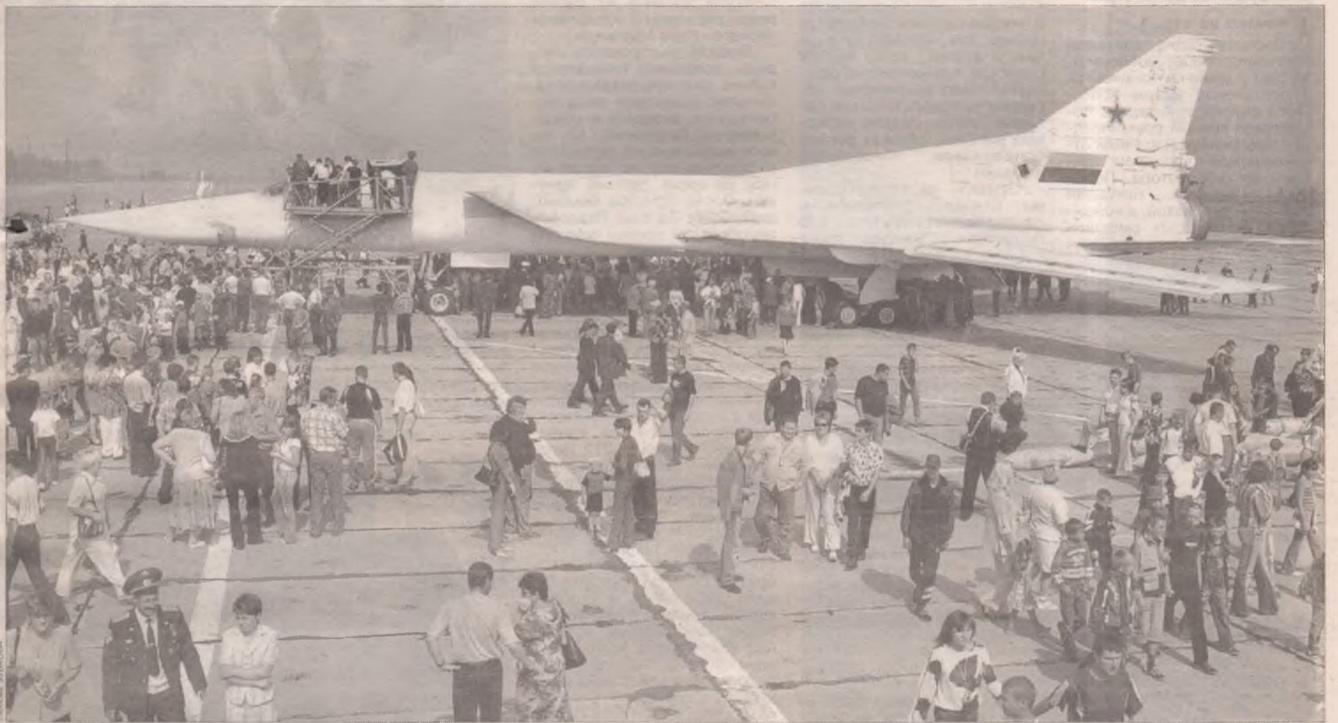
Герой дня - сверхзвуковой бомбардировщик ТУ-22М3

Полосатый шлагбаум смотрел в зенит, а часовые, экипированные по всей форме – автомат, бронежилет, безучастно глядели на то, как через КПП авиабазы «Белая» шел поток автомашин. Посторонние лица проникали на стратегический объект даже с воздуха: здесь совершили посадку три мотодельтаплана ангарского клуба «Окно в небо». Как радушный хозяин, командование 200-го Брестского авиационного полка дальней авиации 21 августа сняло запрет для гостей. В этот день летчики отмечали свой праздник - День Военно-воздушных сил.