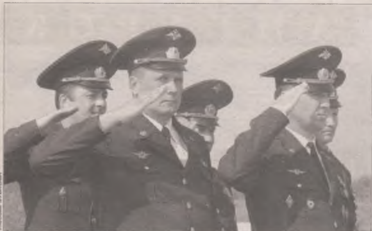
Авиаторы в парадном строю