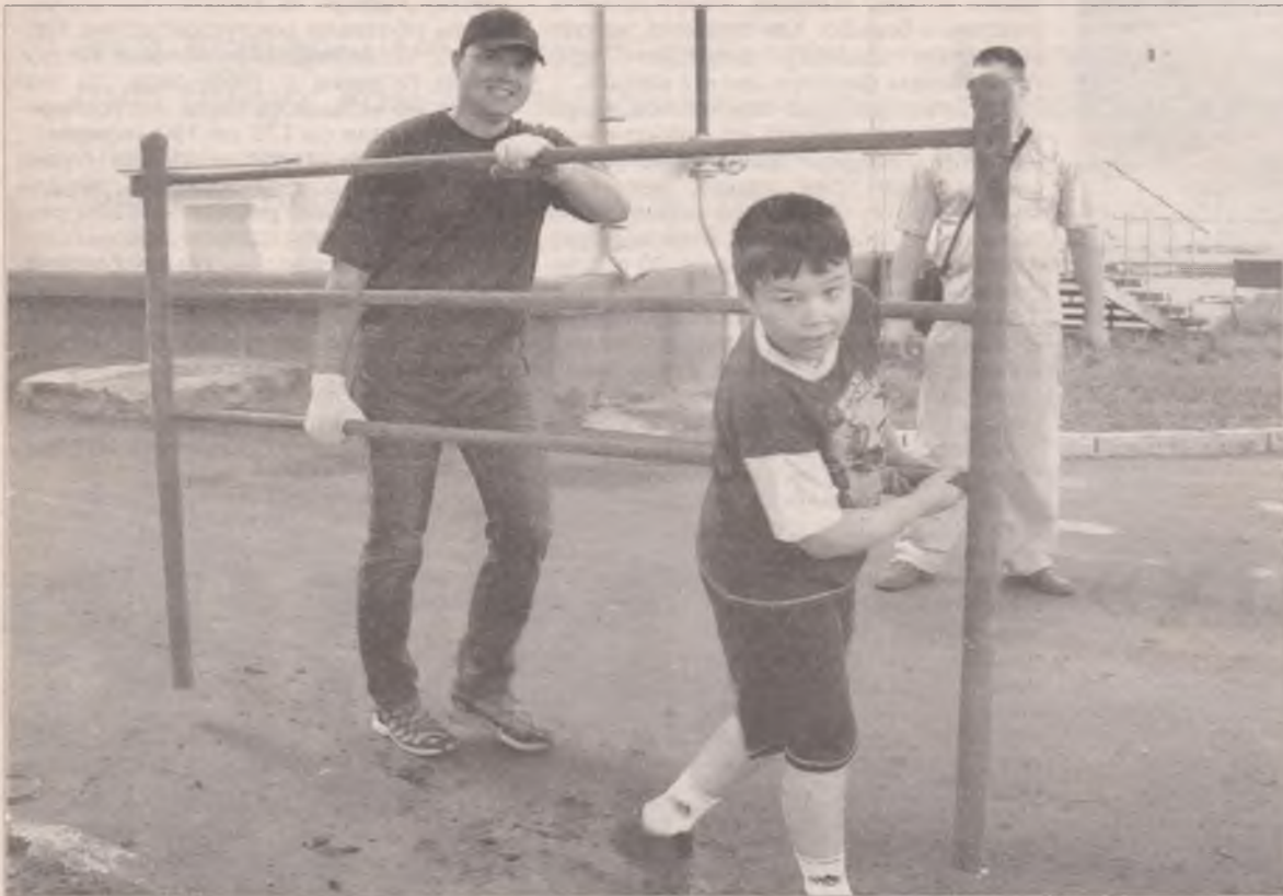
Теперь и наш двор как сад

Хороший пример тоже может быть заразительным! Это доказали жители двора между домами 16, 18 и 20 в 51 квартале. В минувшую субботу этот двор отпраздновал второй день рождения.