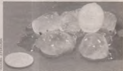
Калибр некоторых «небесных льдинок» около 20 миллиметров