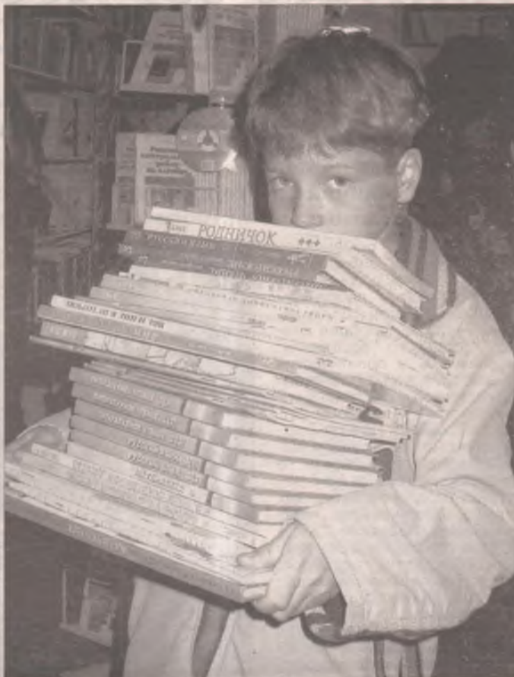
Тяжела ты, ноша школьника

К 1 сентября родительские кошельки «похудеют» на 1000 рублей. Именно такую сумму придется потратить на приобретение учебников.