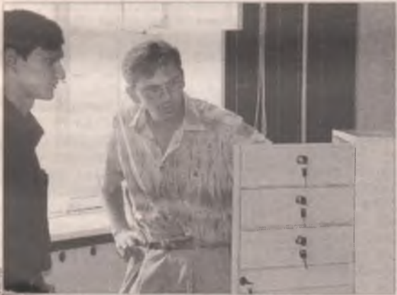
Почтовый ящик: сделано в Ангарске

Замену «классических» почтовых ящиков в подъездах домов «антивандальными» продолжает Ангарский почтамт совместно с жилищными организациями. Шестьсот ящиков московского производства уже установлены в домах, а также приобретены строительными организациями для новостроек.