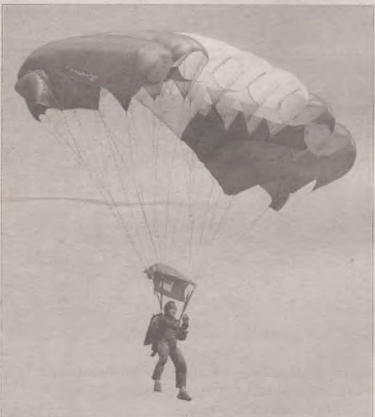
В небе флаг России