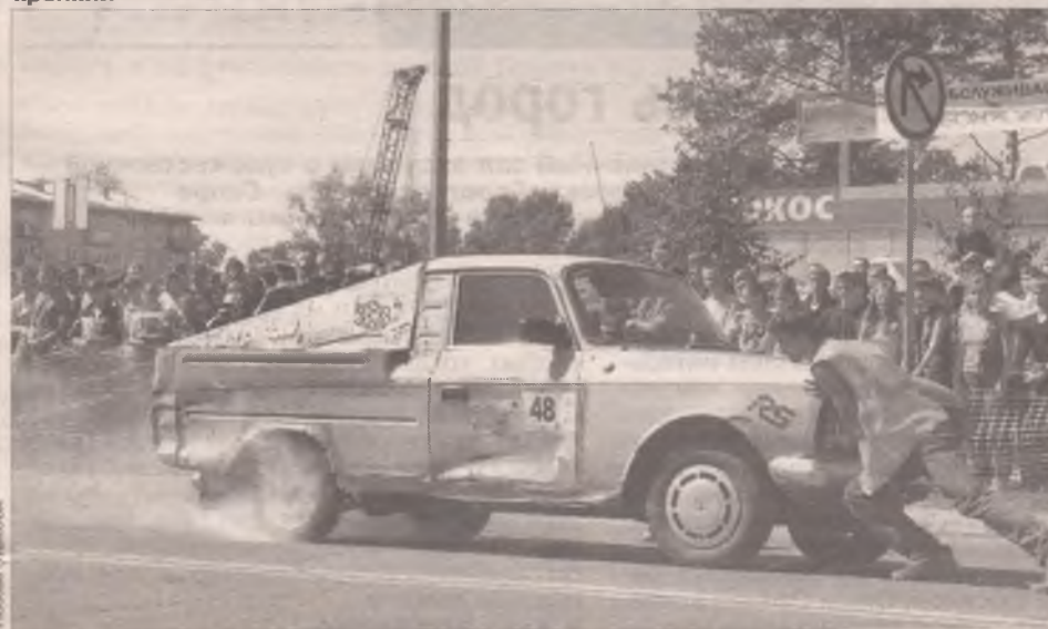
Вот таким интересом пользуется в Ангарске драгрейсинг. Хорошо, что шифер крепкий