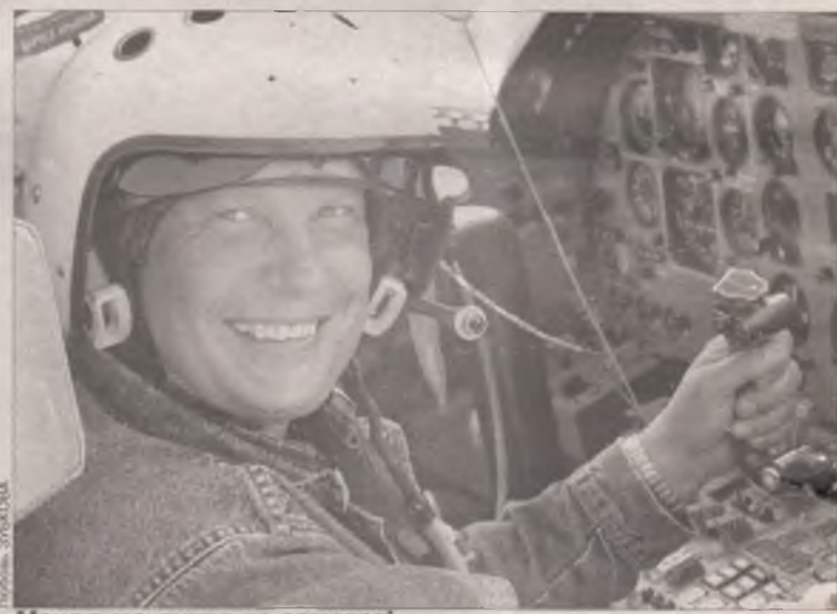
Меняю мотоцикл на самолет!