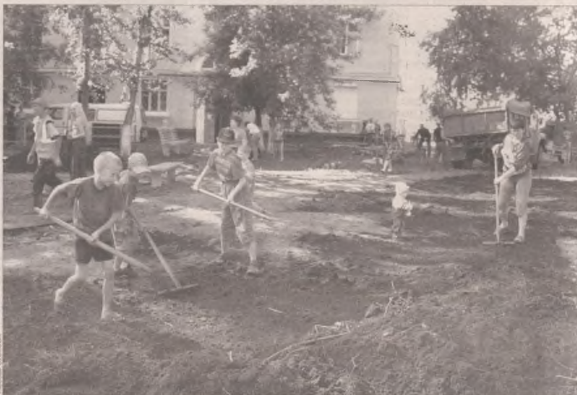
Особая гордость сегодняшнего Ангарска - жилищно-коммунальное хозяйство, которое еще четыре года назад было в состоянии полной разрухи

Перемены коснулись буквально всех сфер жиз-