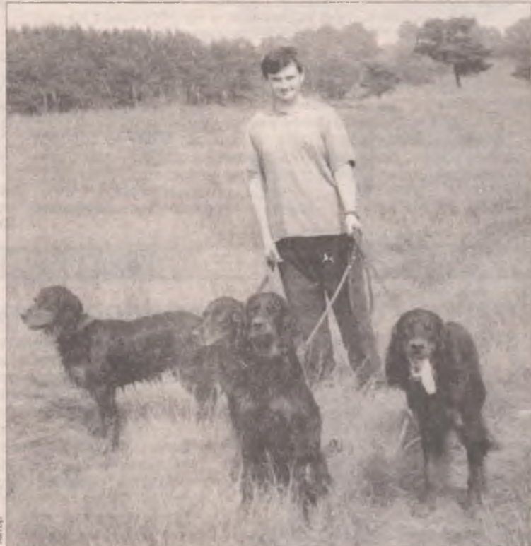
Семейство шотландских сеттеров