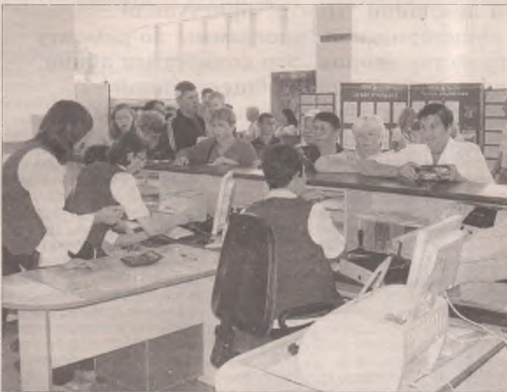
Работа в новом офисе закипела сразу после открытия

В течение двух месяцев здесь проходило переоборудование в соответствии с