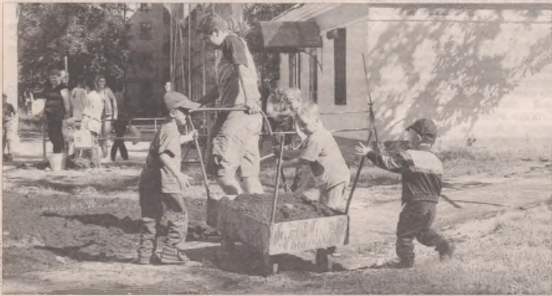
И стар и млад благоустроить двор свой рад