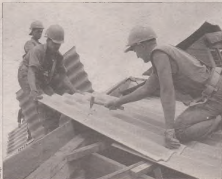
Успеем до дождя!