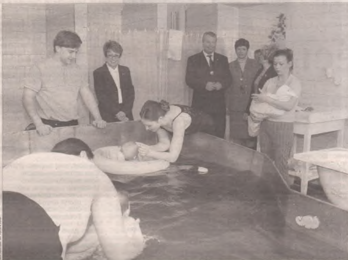
Ремонт бассейна в детской больнице – результат рационального использования бюджетных средств

от новых квартир, а в 2005 году рядом с достроенными домами появился современный коттеджный городок. При возведении домов использовали канадскую технологию, что позволило значительно снизить стоимость одного квадратного