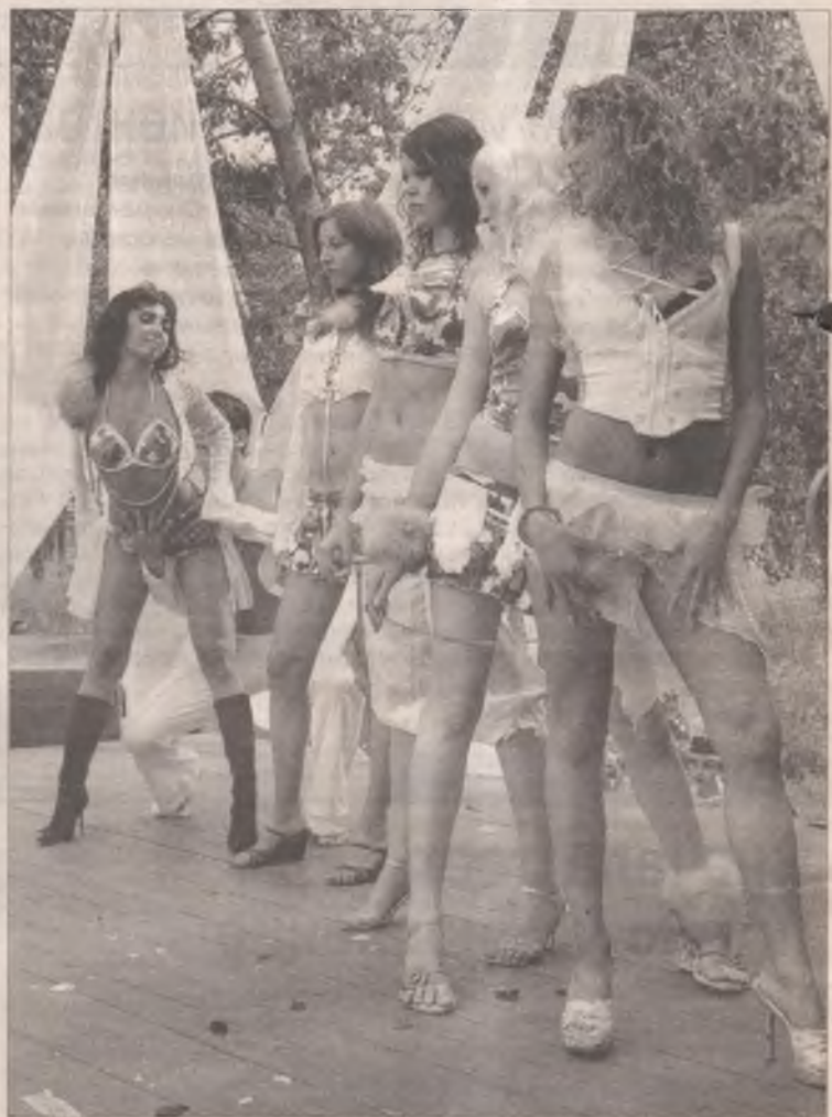
Гвоздем шоу стало триумфальное выступление «валькирий»