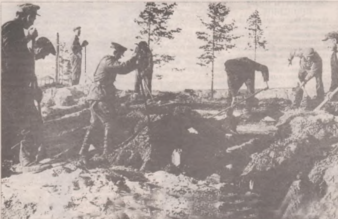
Заключенные раскорчевывают пни, готовят место для будущего комбината. В центре - подполковник И.И. Служов