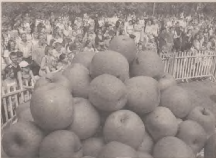
По завершении конкурса зрителей ждал десерт

Конкурсанты представили коллекции сезона 2004-2005.