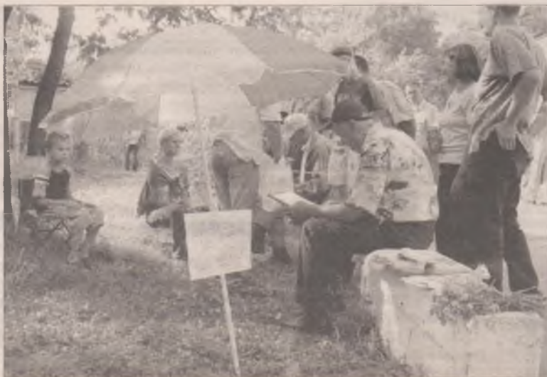
Портретисты тоже без внимания не остались