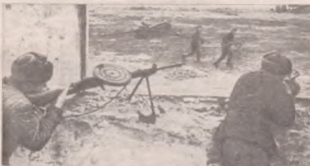
Ручной пулемет Дегтярева Вес - 11,2 килограмма Боевая скорострельность - 90 выстрелов в минуту

- Эх, играйте, мои гусли - сорок семь струн! - с такой прибауткой обычно начинал бой Демьян Танцура, красноармеец-пулеметчик и по совместительству - мой дед.