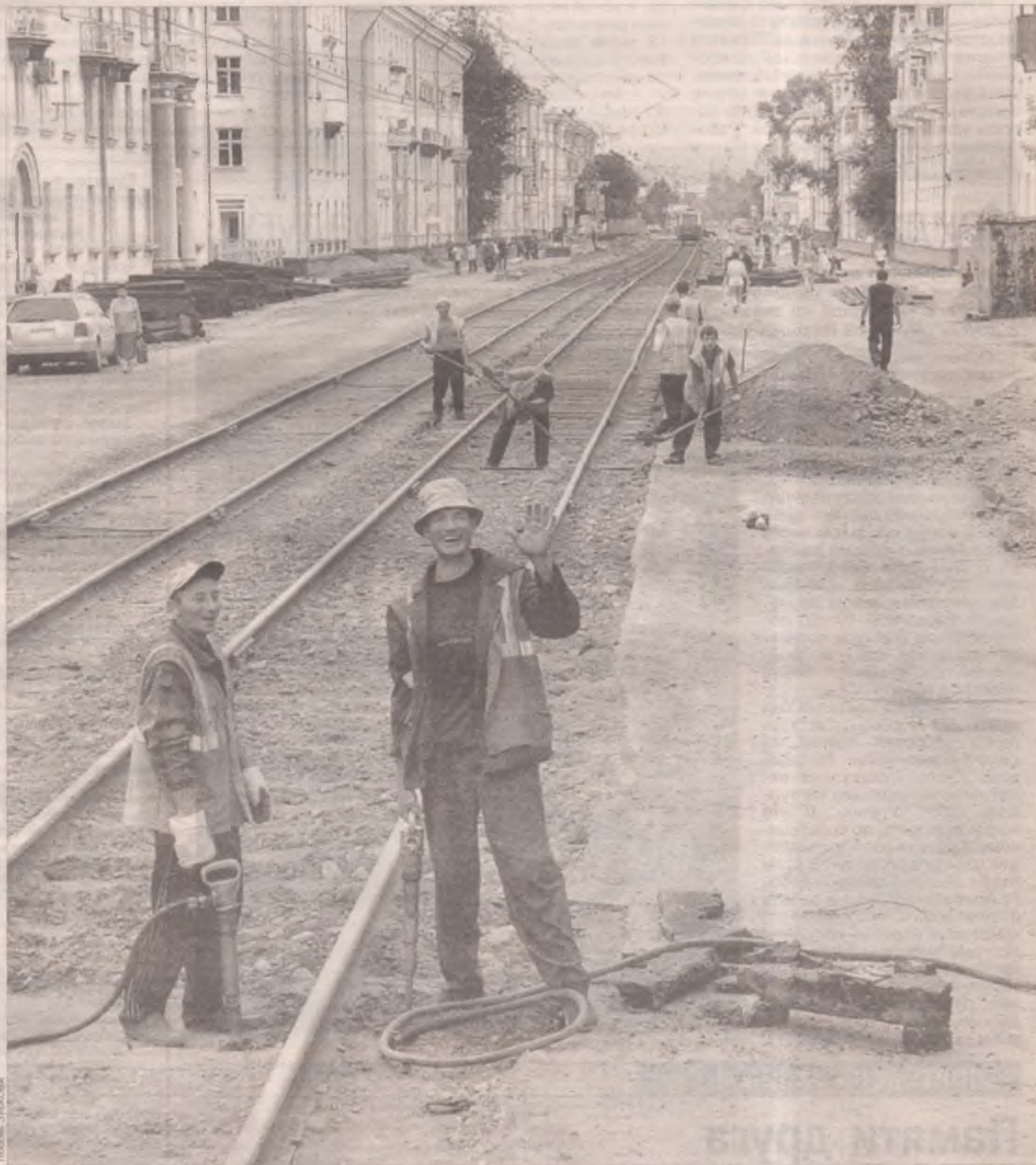
«В августе дорогу обязательно откроем!»

Россия всегда славилась дорогами, а вернее, их состоянием, которое стало притчей во языцех. «Колдобины», «ухабы», «загогулины» - чуть ли не основные (вместе с крепкими ругательствами) слова в лексиконе любого водителя. Ангарск с недавнего времени стал исключением из правил. В нынешнем году уже выполнен план по текущему ремонту городских улиц. Сейчас работники МУП «Дорожное ремонтно-строительное управление» бросили все силы на реконструкцию улицы Горького и строительство второй полосы движения транспорта на Социалистической.