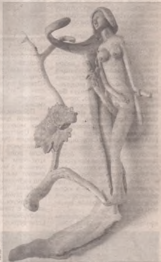
Венера: прекрасное из безобразного