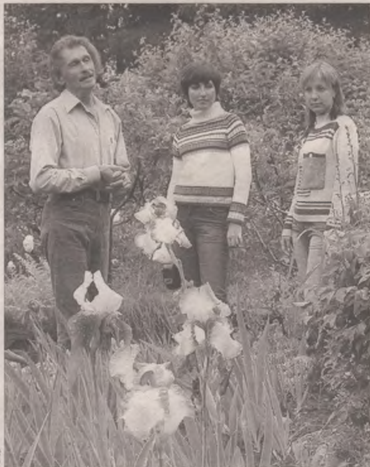
Ирис – дитя радуги