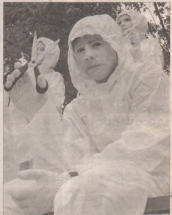
Добрые «призраки» не устрашали, а призывали творить