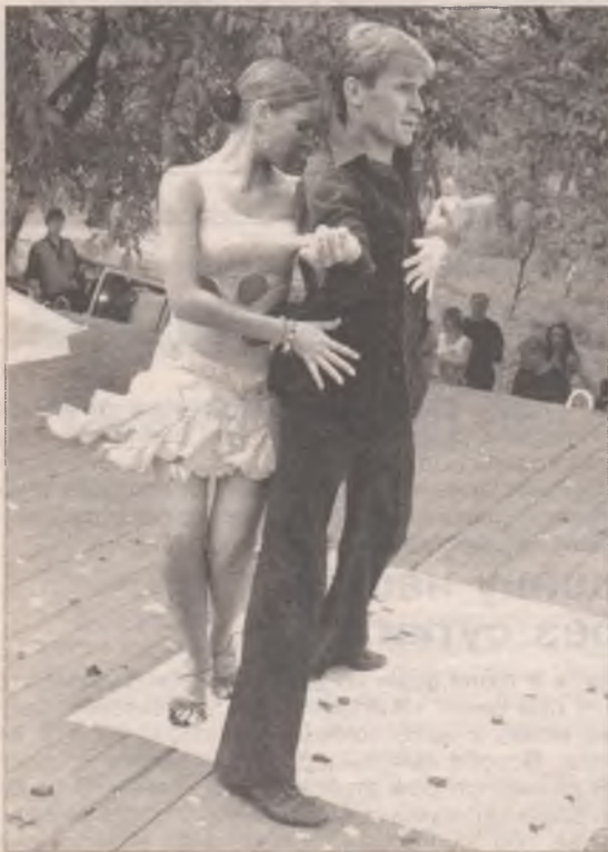
Танцевальный коллектив «Лотос» из Иркутска бил ключом страсти и огня