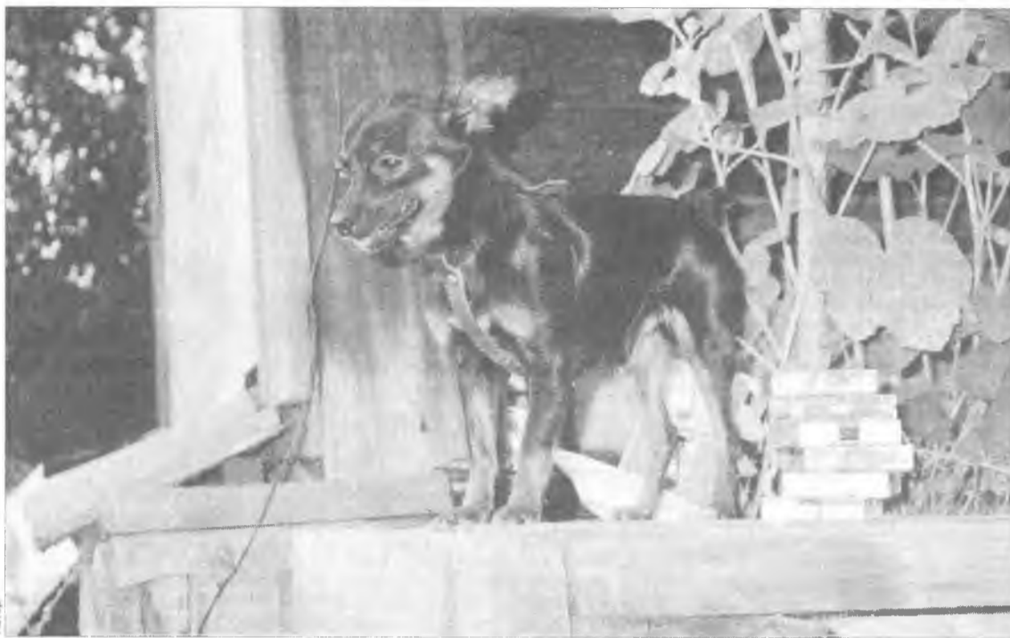
В редкие минуты спокойствия и сосредоточенности

Приключения начались, когда Мурке исполнилось четыре месяца. Однажды ранним субботним утром весь наш двор был разбужен истошным визгом. Чья-то собака "вопила" на одной ноте, ни на се-