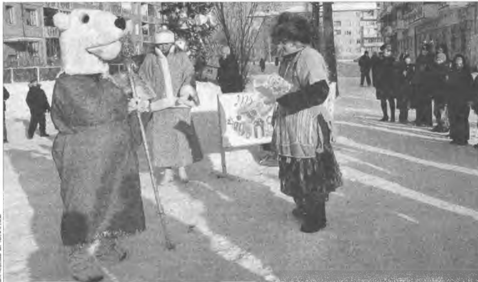
С хорошим жэком праздник приходит в каждый дом

ООО "Наш дом" - неоднократный победитель городских конкурсов по бла-