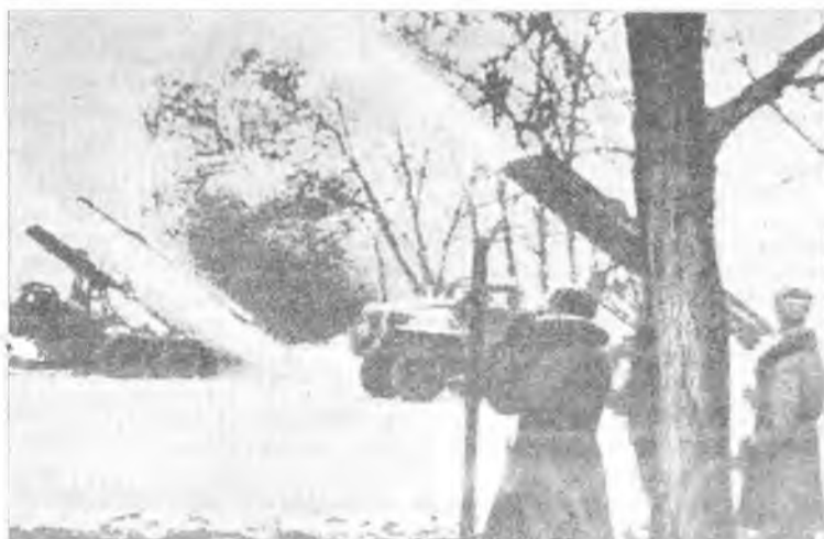
Количество снарядов в одном залпе – 8-16 Время залпа – 7-8 секунд Дальность стрельбы – 8-12 километров Боевой расчет – 6 человек

Шел 23-й день войны. На белорусской станции Орша – столпотворение: пути забиты цистернами, платформами с танками и орудиями. Немцы неслабо разгружаются: при абсолютном господстве в воздухе можно не бояться налетов советской авиации. Вдруг в нескольких километрах от станции над кромкой леса взмывают десятки огней. Через несколько минут станция тонет в шквале разрывов... Лишь два часа спустя, опомнившись от шока, гитлеровцы подняли в воздух самолеты для поиска неведомого врага. Так прошел дебют одного из самых известных видов советского оружия.