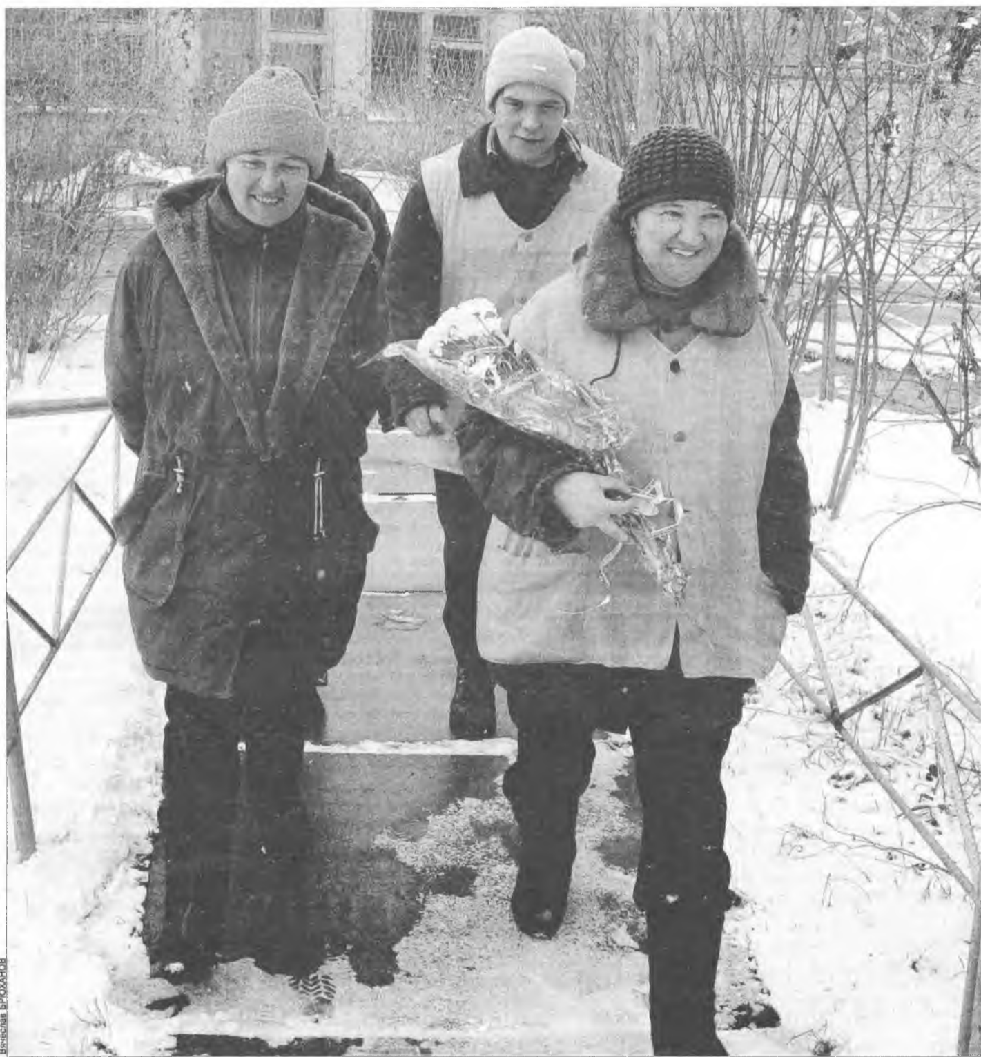
"Пилотные" дворники "Нашего дома"

Известно, что наш город первый в России, где началась реформа ЖКХ. За 2,5 года в Ангарске образовано 9 новых жилищных предприятий. В День работников ЖКХ мы поздравляем их с праздником и уже можем говорить об успехах.