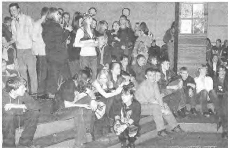
Какое время, такие зрители

Однако прошли те времена, когда в этом зале действительно играли в акустике, и