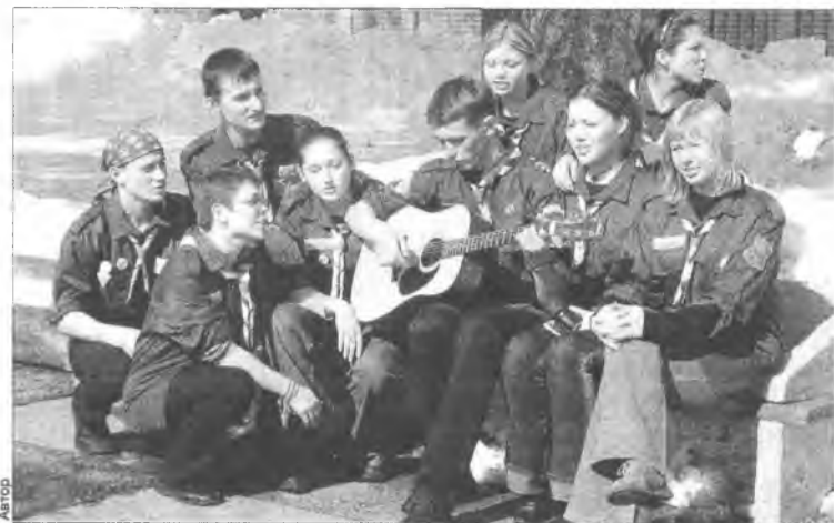
Министры "Новой цивилизации"