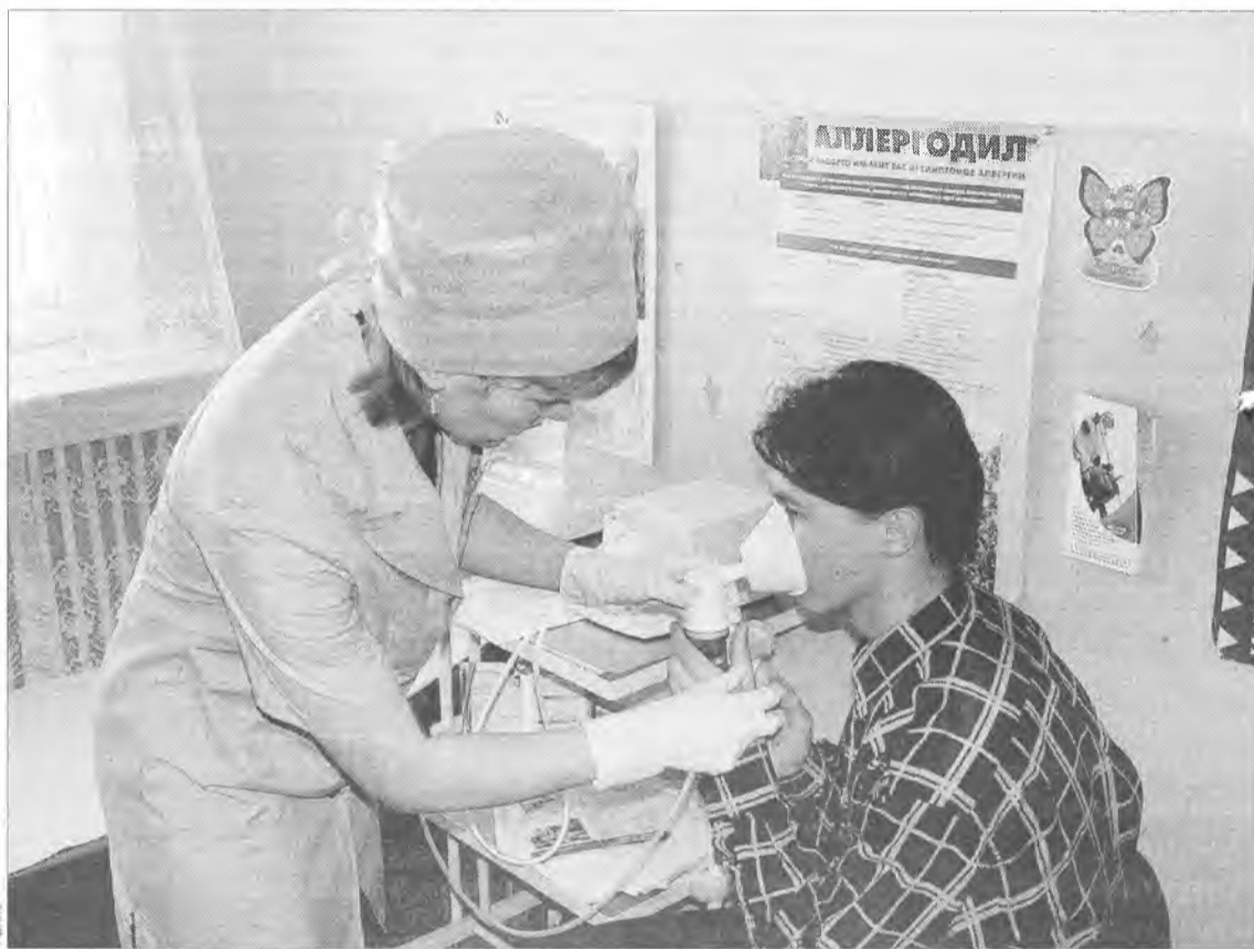
Шаг за шагом к здоровому дыханию

В следующие дни с группой занимался психолог. Обучающиеся по программе проходили курс дыхательной гимнастики, лечебного массажа грудной клетки по методу Бутейко, для них организовали показы двадцати учебных