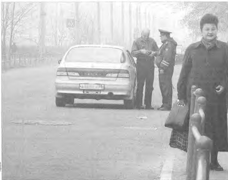
С налоговой инспекцией, как и с ГИБДД, шутки плохи

Ветераны Великой Отечественной войны, труда и инвалиды всех категорий будут сами выбирать, в отношении какого транспортного средства они желают получить освобождение от уплаты налога. Это может быть легковой автомобиль с мощностью до 100 лошадиных сил, мотоцикл или мотороллер с мощностью двигателя до 35 лошадиных сил, а также катер, лодка или другое водное транспорт-