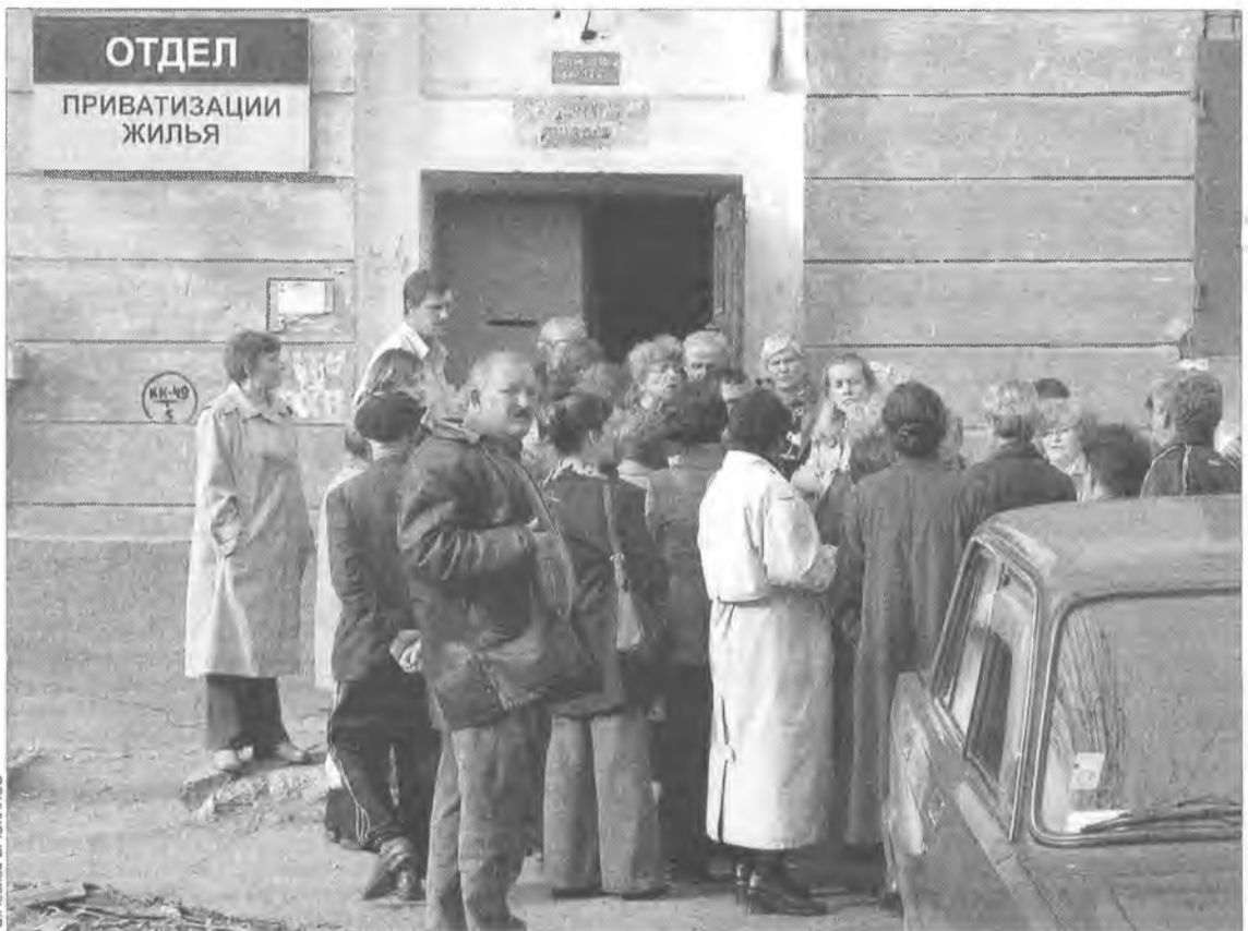
Слухи об отмене приватизации появились еще летом нынешнего года и способствовали образованию очередей

Все квартиры, полученные населением от государства по договору социального найма до 1 марта 2005 года, можно будет оформить в собственность до 2007 года. Новый Жилищный кодекс продляет бесплатную приватизацию на два года. Тем, кто получит жилье после вступления в силу кодекса, придется выкупать квартиры по тарифам, которые назначит государство. Какими они будут, пока не знает никто.