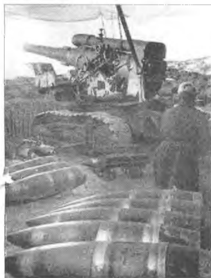
Бог войны за работой

До появления эффективного ракетного оружия артиллерию с полным основанием называли «богом войны». Пушки прокладывали путь красноармейцев, боролись с танками и авиацией. Понятно, что в артиллерийском «иконостасе» особое место занимали орудия большой мощности. Среди этих «монстров» следует выделить 203-миллиметровую гаубицу Б-4.