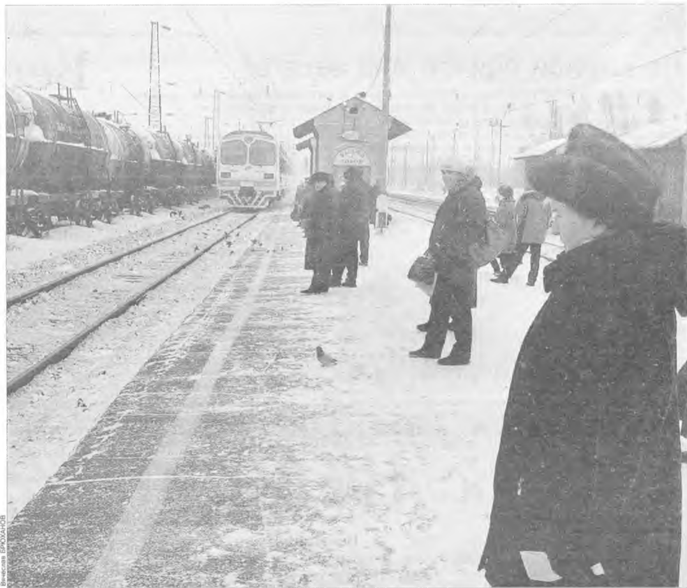
Ваш поезд ушел

Управление Восточно-Сибирской железной дороги решило отказаться от оказания помощи льготникам. Транспортникам богоугодная деятельность невыгодна. В конце января железнодорожники планировали провести социальную акцию по бесплатному проезду льготников в пригородных поездах. Предполагалось, что ветераны тыла и труда, граждане, пострадавшие от политических репрессий, могут совершить неограниченное количество поездок. Однако, взвесив экономическую сторону вопроса, руководство ВСЖД решило воздержаться от столь широкого жеста.