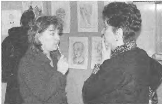
Благодаря выставке педагоги обмениваются опытом

Станция юных техников (СЮТ) открыла традиционную выставку творческих работ, выполненных педагогами школ и учреждений дополнительного образования.