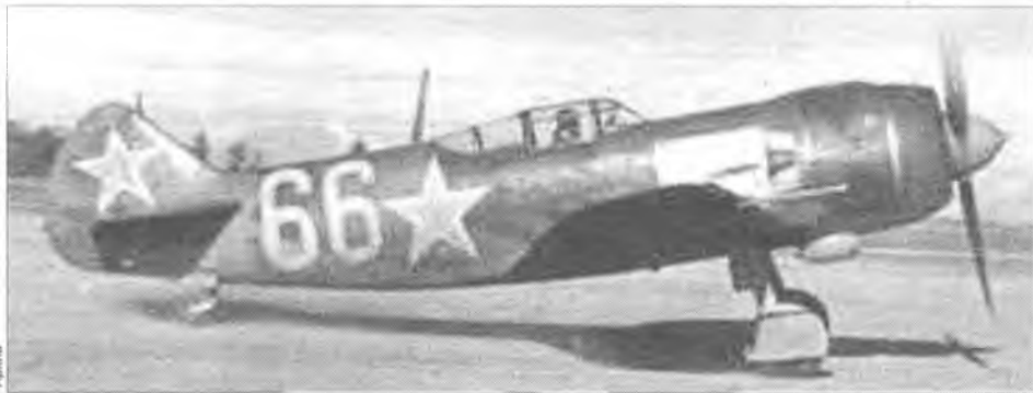
Всего за годы войны фронт получил 15753 истребителя конструкции Лавочкина

гроб гарантированный". В конце 1941 года другой известный авиаконструктор - Николай Поликарпов - передал Лавочкину чертежи винтомоторной группы своего опытного истребителя И-185. Николай Николаевич прекрасно понимал - Сталин никогда не простит ему гибели Чкалова при испытании одной из поликарповских машин, а новый истребитель необходим фронту. "Изюминкой" конструкции стало использование мощного двигателя воздушного охлаждения. Мотор М-82 был способен развивать мощность до 1850 лошадиных сил и вести бой с немецкими истребителями на равных. На высоте 5 километров Ла-5 забирались за пять минут! Вооружение составляли две скорострельные пушки, а сам истребитель был... деревянным! Это позволяло экономить алюминий для изготовления бомбардировщиков и танковых дизелей. Металлический каркас