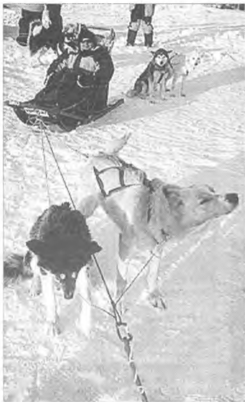
Скоро в Ангарске будет, как на Севере

Принять участие в различных гонках могут все желающие. Заявки можно подать в городской отдел по фи-