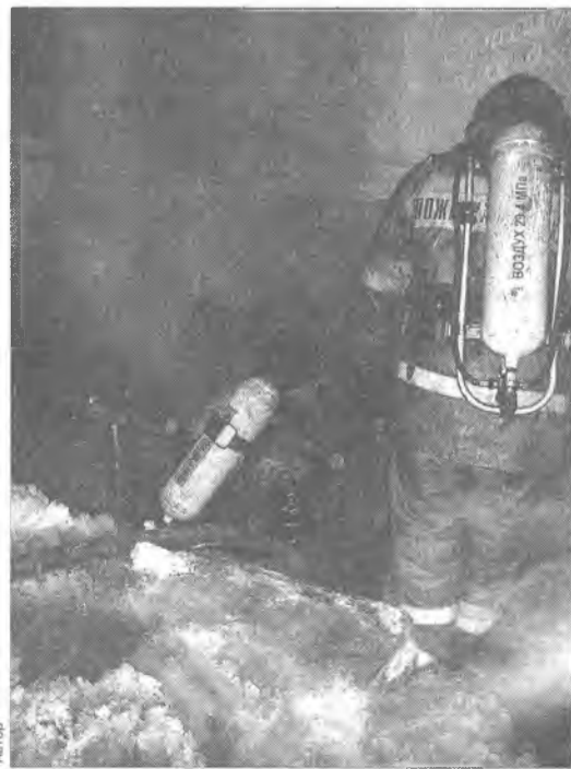
Пожарные работали в подвалах