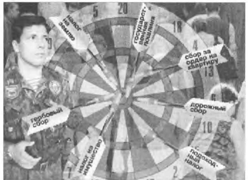
Налоговое "колесо" набирает обороты

Теперь несколько слов об изменениях в налогообложении физических лиц. Снижаются налоговые ставки по налогу на доходы физических лиц, полученные в виде материальной выгоды от экономии на процентах за пользование целевыми займами (кредитами), фактически израсходованными на новое строительство или приобретение в России жилого дома, квартиры или долей в них. Они будут обла-