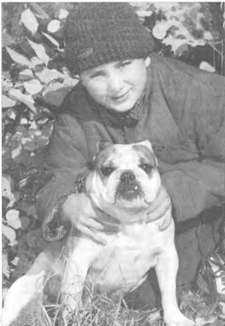
На прогулке с собакой надо смотреть в оба и не допускать контакта с противником