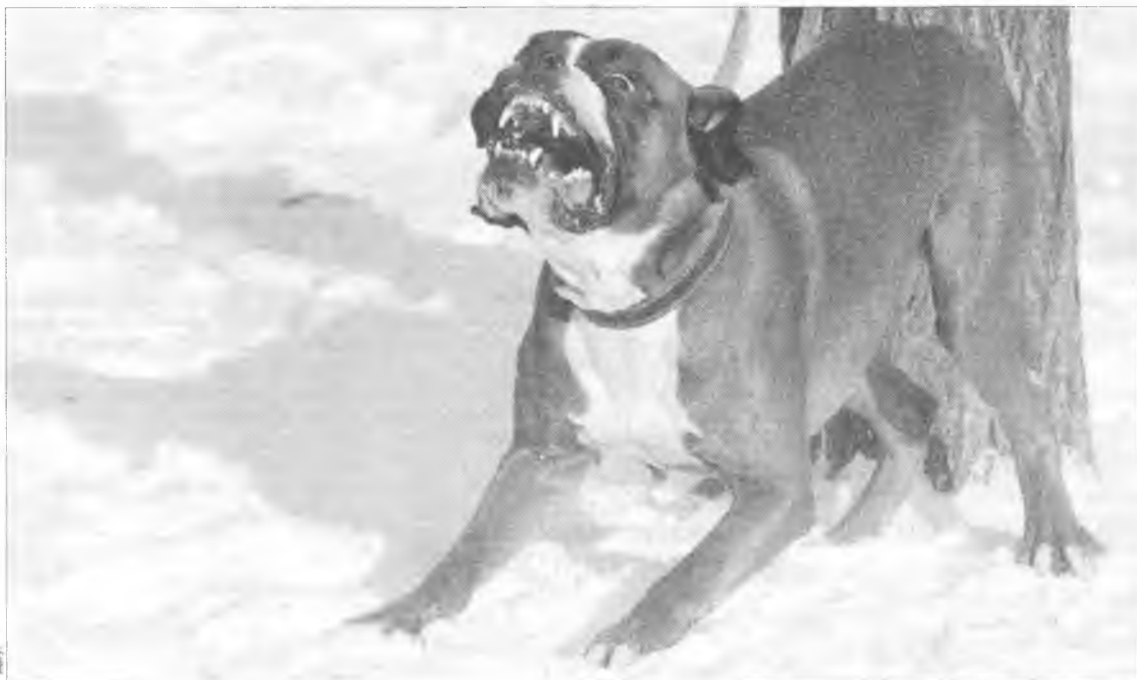
Не умеющие "правильно" драться крупные сильные псы способны принести много беды

Укусы собакой чужих людей имеют свою причину. Можно с уверенностью сказать: если животное бросается на прохожих, значит, его хозяин этого хочет. Дело в том, что растущий щенок очень восприимчив к реакции старших на свои поступки. Поощрение или категорическое запрещение каких-либо действий формируют его поведение в обществе. Да и порода питомца хозяином выбирается с определенной целью. Желание иметь рядом защитника и покровителя, пусть даже в виде собаки, свойственно, как правило, людям, испытывающим страх перед действительностью. Уверенному у