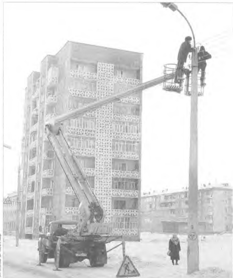
"Чувство хозяина" приходит не сразу

- Прежде всего товарищество собственников жилья получает возможность стать коллективным заказчиком жилищно-коммунальных услуг с последующим контролем их предоставления, коллективной защиты своих прав, а также возможность оформления права общей долевой собственности на земельный участок после формирования кондоминиума в соответствии с действующим законодательством. Представим себе ситуацию: вы платите в жэк или ЖЭУ определенную сумму за ремонт и содержание жилья. Кто-либо из вас знает, куда эти средства расходуются? Большинство жильцов не имеют понятия, куда уходит квартплата. Мало того, они не могут проконтро-