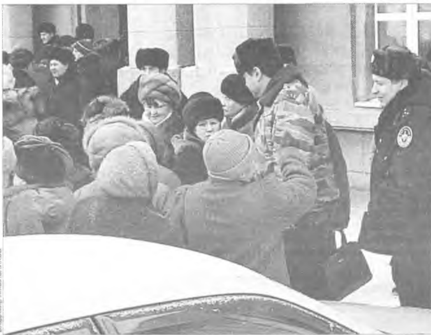
Льгот хотят все