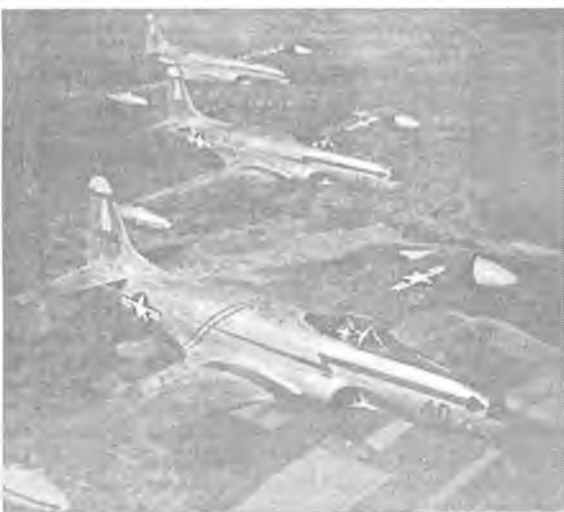
Американские истребители F-80

Вскоре после окончания Великой Отечественной войны нашим военным пришлось скрестить оружие со вчерашними союзниками - американцами. И не где-то, а на советской территории. Однако о происшествии 8 октября 1950 года под Владивостоком старались не вспоминать.