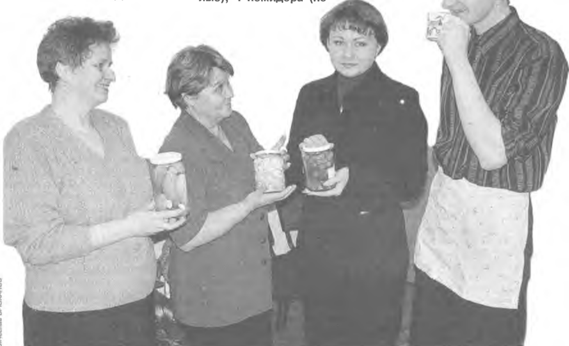
Кулинарные фантазии подчас вдохновляют...

Обрезать соцветья капусты. Бланшировать в соленой кипящей воде в течение 1 минуты после закипания. Отбросить на дуршлаг. На растительном масле пассеровать морковь, лук, добавить капусту и жарить еще 8-10 минут. 5 яиц взбить, подсолить, полученной массой залить капусту и довести до готовности. Употреблять желательнее в горячем виде с салатом из свежих помидоров.