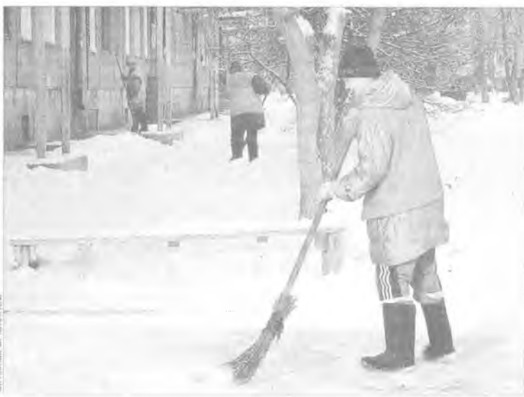
Вам навязывают слесаря, сантехника, дворника, независимо от того, нравится или не нравится вам их работа

- Членство в ТСЖ - дело добровольное, поэтому обязывать к вступлению в него никто не вправе. Однако в процессе деятельности товарищества собственников жилья необходимо учитывать интересы всех владельцев квартир, в том числе и тех, кто в него не вступил. Следует иметь в виду, что граждане, не вступившие в ТСЖ, несут бремя ответственности за содержание и эксплуатацию дома, в котором обладают собственностью, наравне с членами ТСЖ.