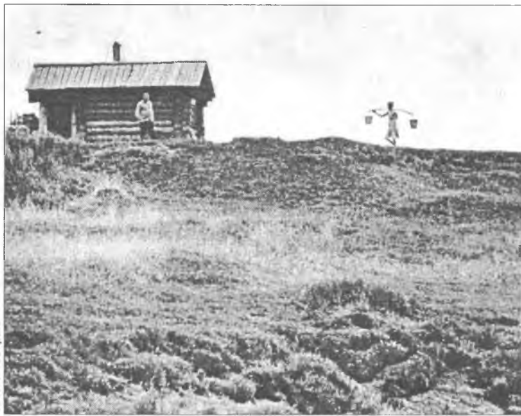
Беженке из Ленинграда пришлось привыкать к новой жизни