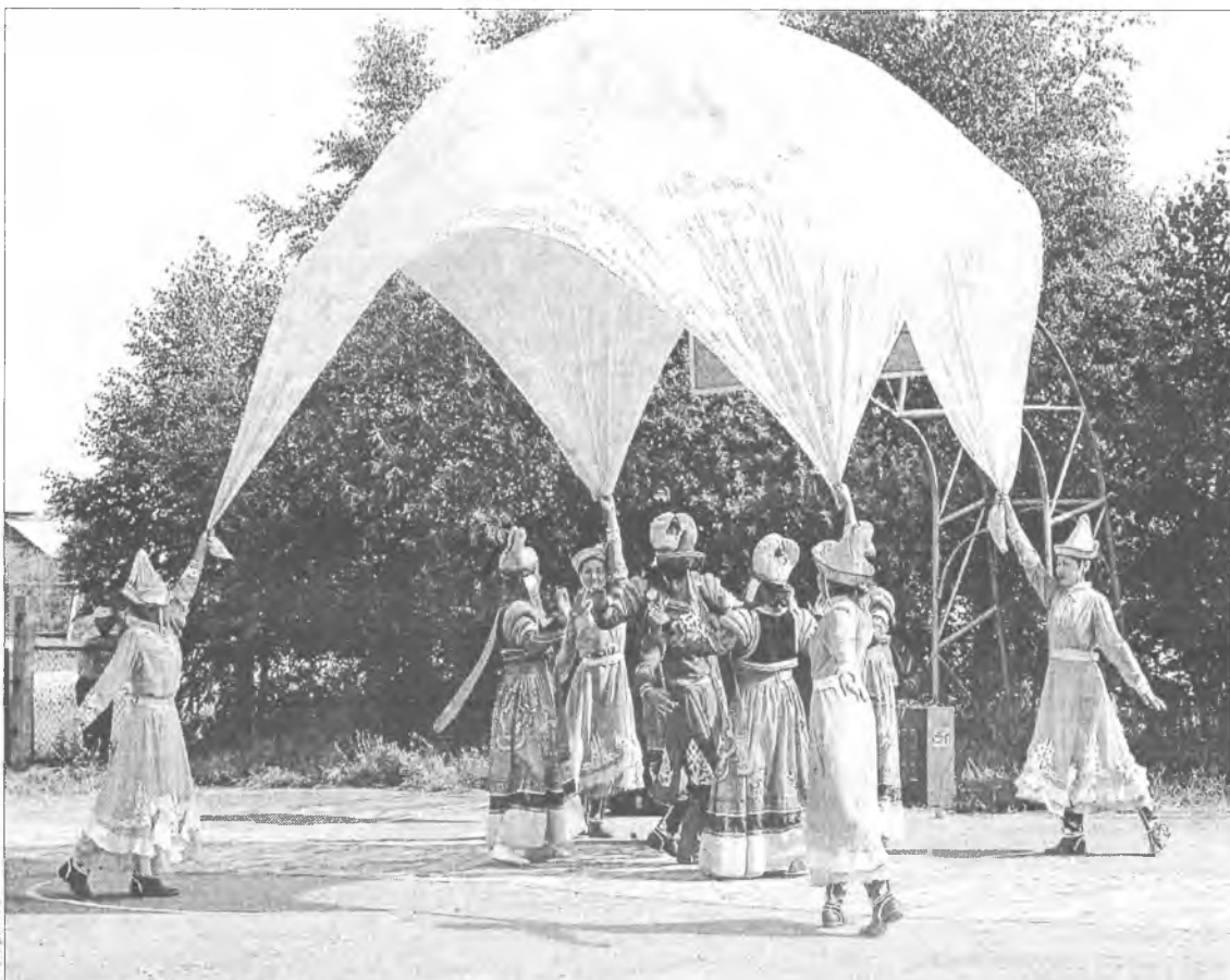
Коронный танец "Цветок Байкала": девушки превращают огромный отрез ткани то в волнующее море, то в непокорную реку, то в сказочный шатер

Пригласить ансамбль к себе считается большой честью. Например, недавно танцоры выступили на Байкальском экономическом форуме, гостями которого стали более 2000 человек из разных стран. Участникам этого престижного мероприятия на итоговом празднике ребята представили свой самый зрелищный та-