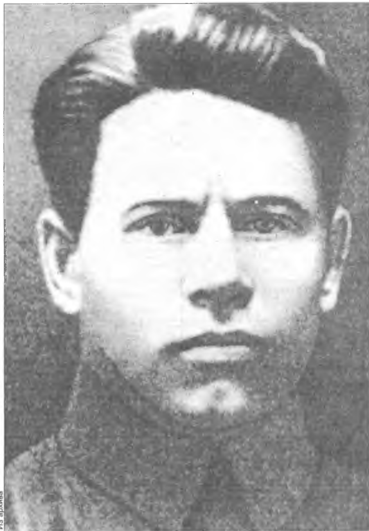
Мартемьян Никитич Рютин (1890-1937)

Наверное, поэтому группа видных большевиков, объединившихся в оппозиционный Сталину "Союз марксистов-ленинцев", обратилась к нему с просьбой создать программный документ организации. Рютин написал двухсот-