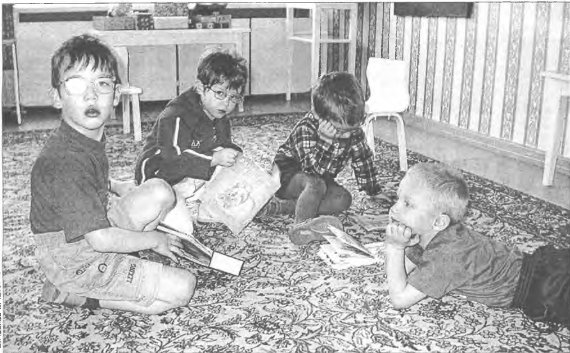
В детском саду слабовидящим детям помогают сохранить зрение