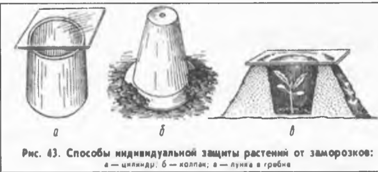
Рис. 43. Способы индивидуальной защиты растений от заморозков: а — цилиндр; б — collar; в — лунка в гребне

Расстояние между кучами должно быть не менее 5 м (со стороны господствующих ветров разложи-