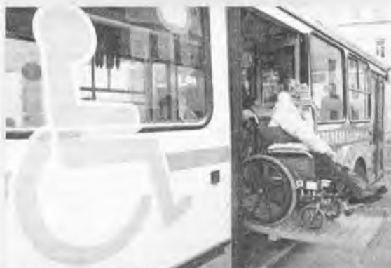
В Ангарске таких автобусов пока нет.