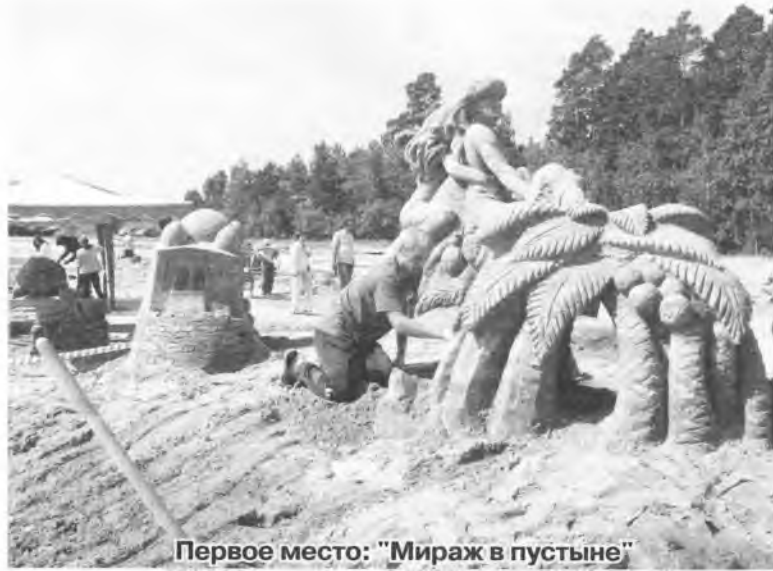
Первое место: «Мираж в пустыне»