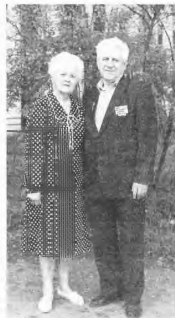
1996 год, 16 июня, Ангарск. –В браке уже 49 лет. А всего они прожили вместе без одного месяца 62 года.