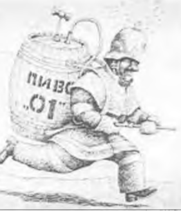
Пожарный журналисту: - Если, приехав на пожар, вы почувствовали, что там что-то жарил... - То причиной возгорания стало неосторожное обращение с огнем при приготовлении шашлыка, - перебивает его журналист.

Рыбы на этой неделе почувствуют усиление творческих способностей. Ко всем делам вы будете склонны относиться с фантазией и выдумкой. Это прекрасное время для расцвета романтических отношений. Если вы влюблены, то попробуйте сделать приятный сюрприз любимому человеку или удивите его чем-нибудь. Можно экспериментировать со своей внешностью, менять прическу, стиль одежды. Старайтесь выделиться из толпы и проявить свою индивидуальность. Если у вас есть дети, рекомендуется больше времени проводить с ними, заниматься их воспитанием. Они обязательно вас порадуют и удивят своими успехами. В семейных отношениях (особенно с родителями) может проявиться напряженность. Также не исключено, что по домашнему хозяйству останется много нерешенных вопросов, которые будут вас нервировать.