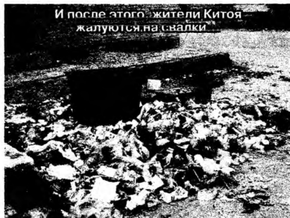
И после этого жители Китоя жалуются на свалки