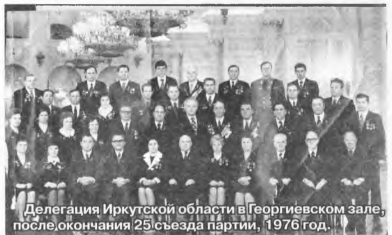
Делегация Иркутской области в Георгиевском зале, после окончания 25 съезда партии, 1976 год.