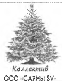
Коллектив ООО «САЯНЫ SV»

Желаем вам любви и ласки, Желаем в жизни доброй сказки! Пусть Новый год вам принесет Удач на много лет вперед!