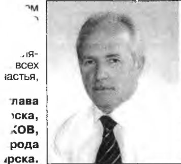
глава Ангарска, Александр Рудин.