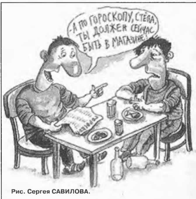
Рис. Сергея САВИЛОВА.

Вот такая вот путаница. Впрочем, горевать не стоит. Можно выбрать себе два знака (по новой и старой хронологии) и на каждый день выбирать себе гороскоп по тому или иному знаку, какой вам больше нравится. В этом случае процент совпадений с предсказаниями даже увеличится.