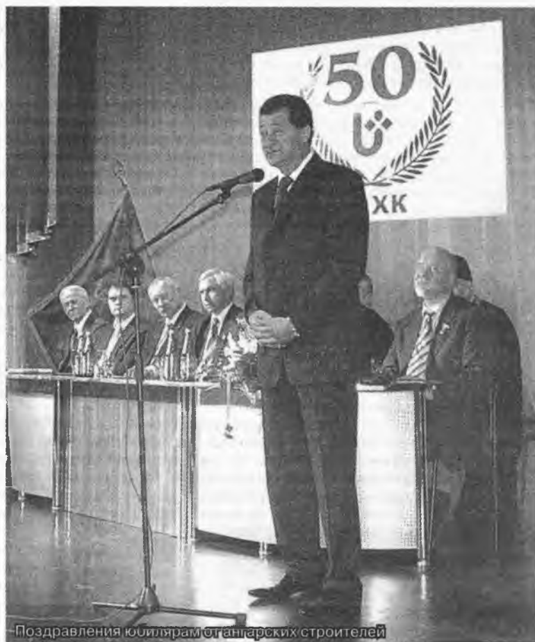
Поздравления юбилярам от ангарских строителей