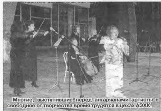
Многие, выступившие перед ангарчанами артисты в свободное от творчества время трудятся в цехах АЭХК.

Впереди ангарчан ждет еще немало мероприятий, приуроченных к 50-летию АЭХК. Раз в полвека атомщики могут себе позволить «загулять» на целый месяц.