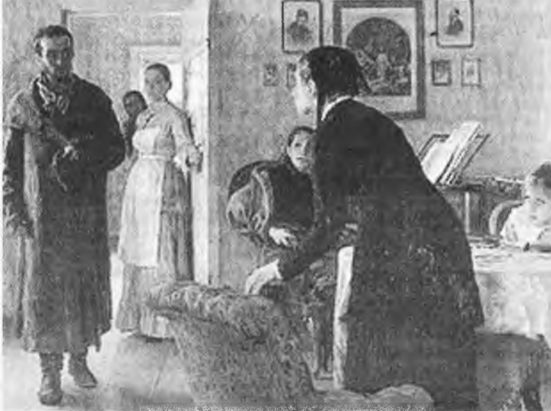
Картина Репина «Не ждали».

«Этого достаточно, ведь цель была не в операции «Преемник», а в преемственности курса. И надо было привлечь внимание к правительству, поскольку Путин намерен сделать его важным институтом власти. С точки зрения пиара правительства и ограничения возможностей Зубкова все сделано грамотно».