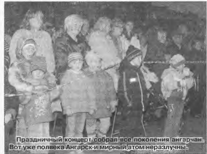
Праздничный концерт собрал все поколения ангарчан. Вот уже полвека Ангарск и мирный атом неразлучны.