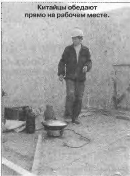
Китайцы обедают прямо на рабочем месте.

Сколько не вглядывалась, ни внутри, ни снаружи дома не смогла обнаружить следы монтажа вентиляции: на крыше есть только цилиндрические вытяжки канализации. Если вентиляция будет позже смонтирована коробами – это некрасиво, если ее не будет вовсе – при герметичных стеклопакетах через несколько лет в новом доме начнут на конденсате расти плесень и грибы. Я не очень себе представляю, как можно не иметь вентиляции в совмещенном санузле и как стряпать-варить-жарить на не имеющей вентиляции кухне. Вытяжку, конечно, над плитой можно будет поставить – но куда она будет дым и чад вытягивать? Дырку в стене прорубать? Для минимального воздухообмена в «хрущевке» можно открыть форточку. В 258-м квартале в кухнях евроокна почти от потолка и до пола; постоянно держать открытой створку, более похожую на балконную дверь, не ста-