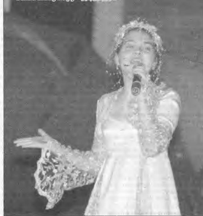
Солнечному миру – да, да, да!