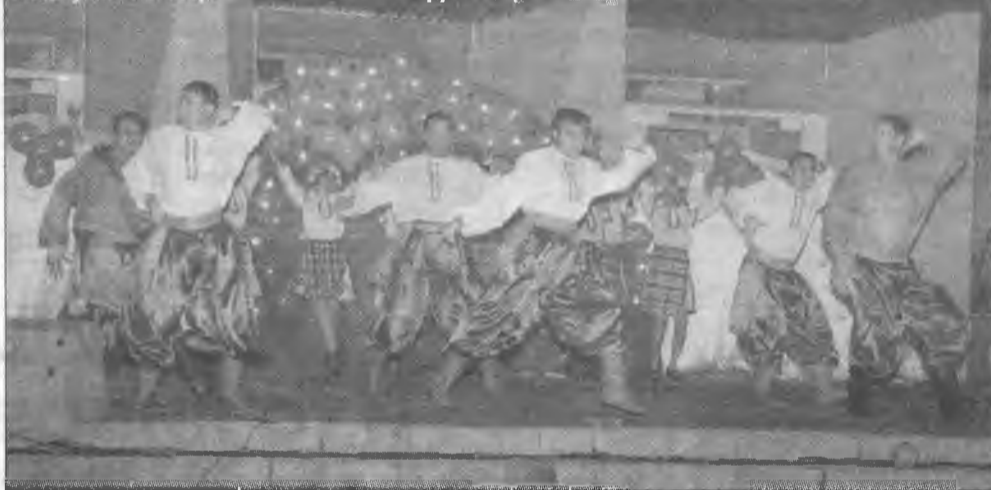
Восторг и ликование атомщиков вызвали зажигательные выступления творческих коллективов ДК «Современник».

Строительство Ангарского электролизного химического комбината началось в 1955 году. Спустя всего два года, 21 октября 1957 года, предприятие выпустило первую про-