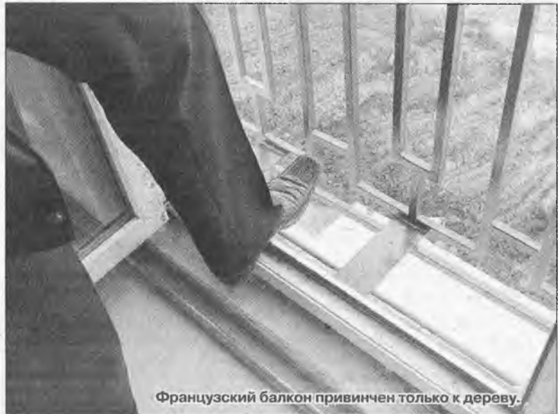
Французский балкон привинчен только к дереву.

Как оказалось, есть в Ангарске отчаянные люди, которых все вышеперечисленное не останавливает: большинство домов в «Звездочке», которые будут сдаваться в октябре-ноябре, уже проданы. Очень хочется, чтобы те, кто совершил столь рискованную покупку, не имели поводов о ней пожалеть. Тем же, кто пока раздумывает, стоит хорошенько взвесить, стоит ли менять городскую квартиру на перспективу жизни в болотистой деревне на 320 домов.