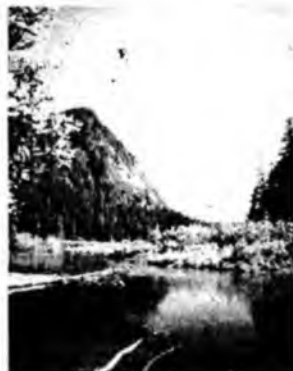
Самая длинная река в мире – Нил.