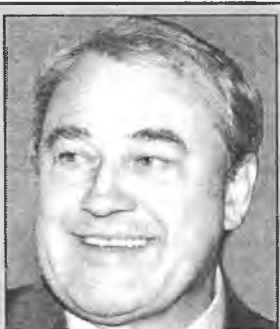
Губернатор «наследит» на Аллее любви