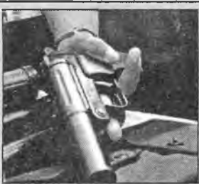
Мраки: в Ангарске ежечасно кого-то грабят и избивают.