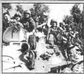
ОМОН: Родина сказала «надо»