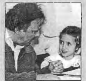
Православная школа: дорогой веры