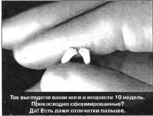
Так выглядела ваша нога в возрасте 10 недель. Превосходно сформированные? Да! Есть даже отпечатки пальцев.

Скажите: «Распущенная молодежь пошла!» Нет, дело не в распущенности, а в невежестве и нежелании просвещения. Сексуальная революция в нашей стране прошла, довольно-таки успешно прошла. А вот воспитания не было и нет. Ведь очень многие подростки, стремясь жить по-взрослому, не ведая некоторых истин, не раскрытых им. От этого учение идет на собственных, порой трагических ошибках. Иные мамы и папы, зная, что их ребенок уже ведет половую жизнь, живут «на авось»: а вдруг «не залетит!» И то, что зачастую 15-летний мальчик рискует попасть под статью, а 13-летняя девочка в дальнейшем больше, возможно, не сможет иметь детей, – такой мысли они просто не допускают. Полное молчание в семье и в школах