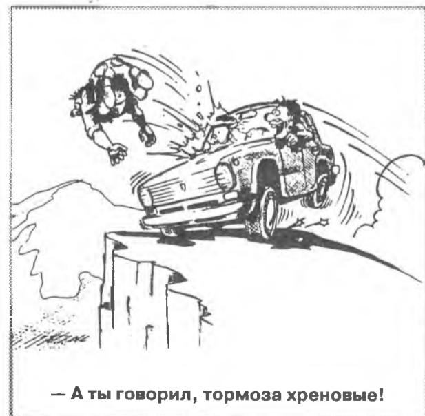
- А ты говорил, тормоза хреновые!