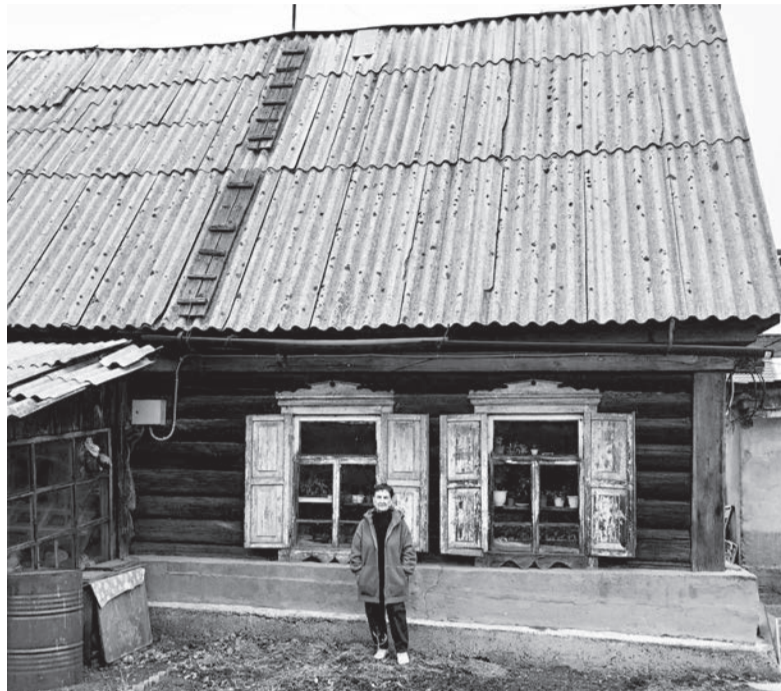
■ Дом из сосны стоит уже 72 года, держится без капитального ремонта. В огороде всё растёт