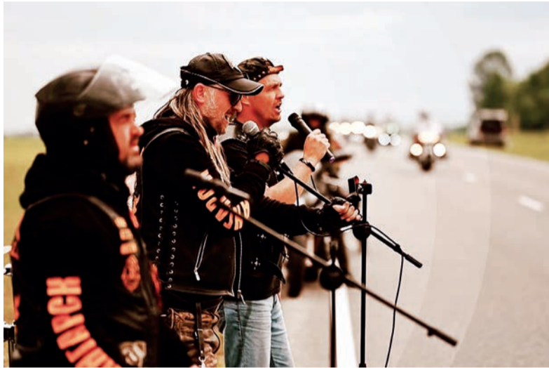
■ Настоящему байкеру, кроме скорости и верного железного друга, нужна ещё и песня

- Увлечение фотографией - а я делал снимки хоккеистов, моменты игры - объединило вокруг меня людей, которым эти фото нравились. Они брали их на память, на фото ставили автографы игроки. Этой кучкой фанатов мы стали ходить на тренировки, лучшим игрокам готовили сувениры. Однажды даже поздравили с днём рождения американца Джозефа Харчари-