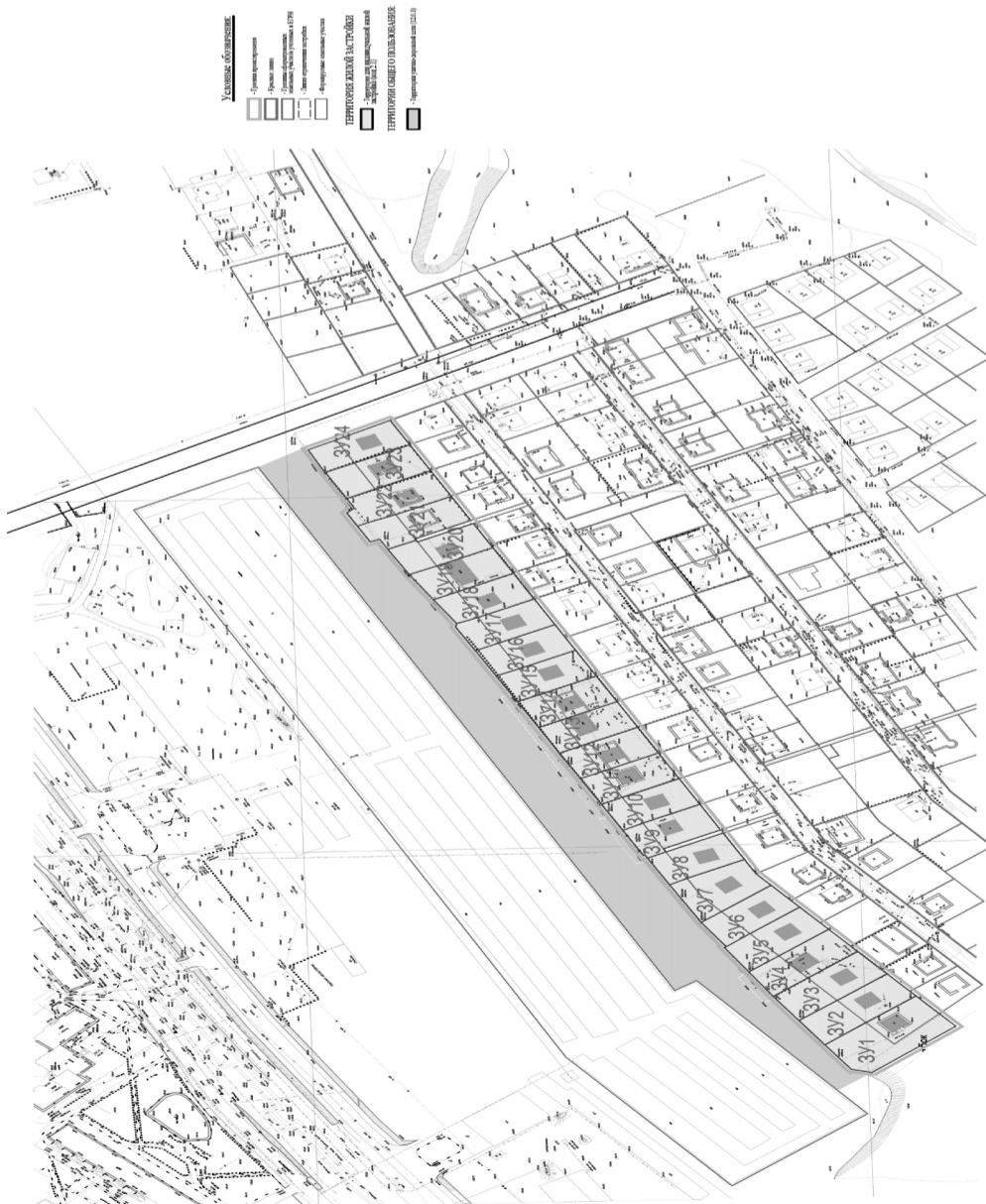
Фрагмент чертежа межевания территории (материалы по обоснованию)