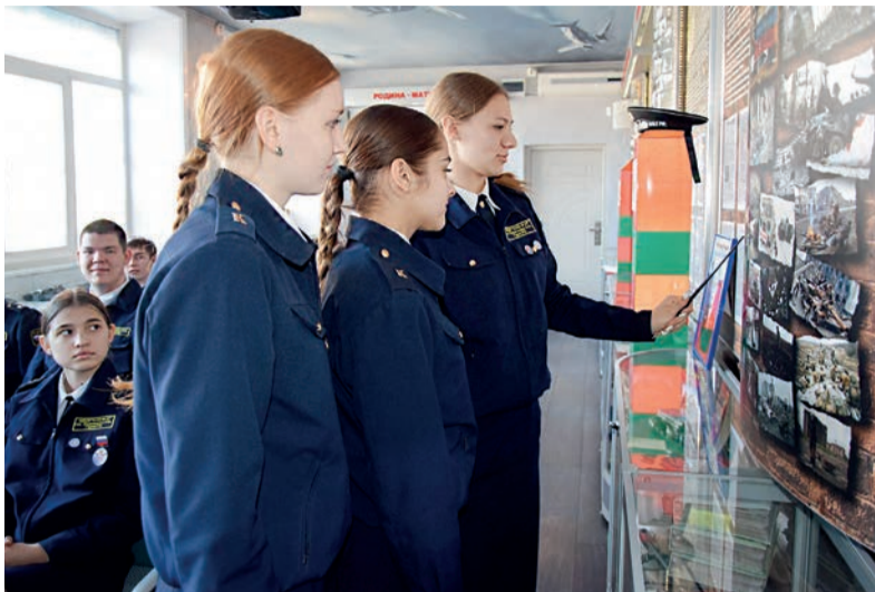
Оконными витражами и пограничными столбами экспозиция разбита на четыре раздела, посвящённых знаковым историческим событиям