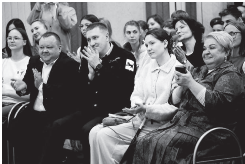
■ Сегодня первичные отделения в образовательных учреждениях являются фундаментом активности

- Независимо от того, сколько вам лет, всегда нужно учиться, не стоять на месте. Движение - это жизнь. Развивайтесь, каждый