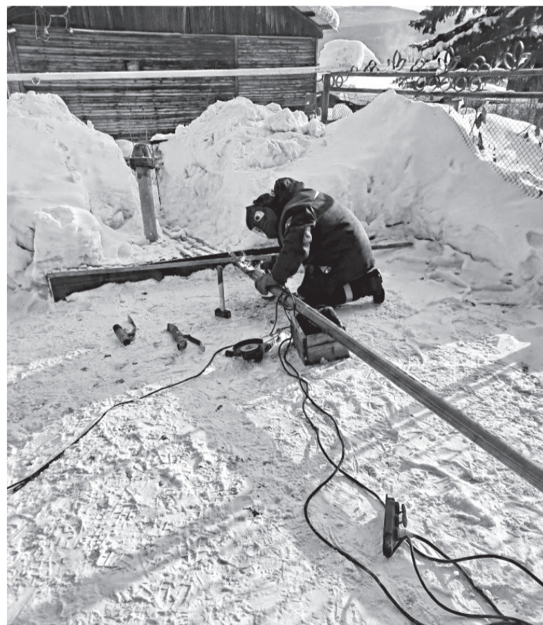
■ Работа в суровые морозы, не разгибая спины и не считаясь со временем. Водоканальцы к этому готовы

Работа в суровые морозы, не разгибая спины и не считаясь со временем. Водоканальцы к этому готовы. Мужики вспоминают: в Ангарске приходилось устранять аварию и 1 января. А как иначе? Никто вместо них