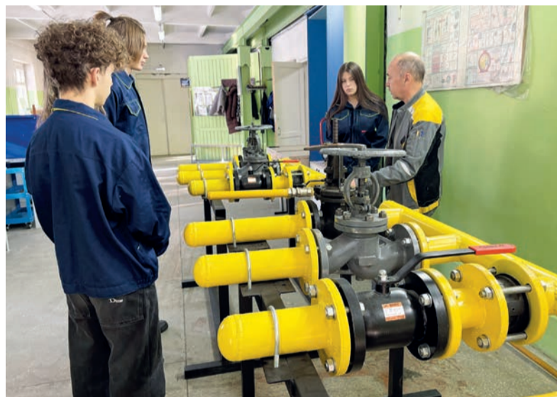
■ Со второго курса у студентов начнётся работа по модулям. Знание геодезии и геологии является ключевым фактором при замене запорной арматуры