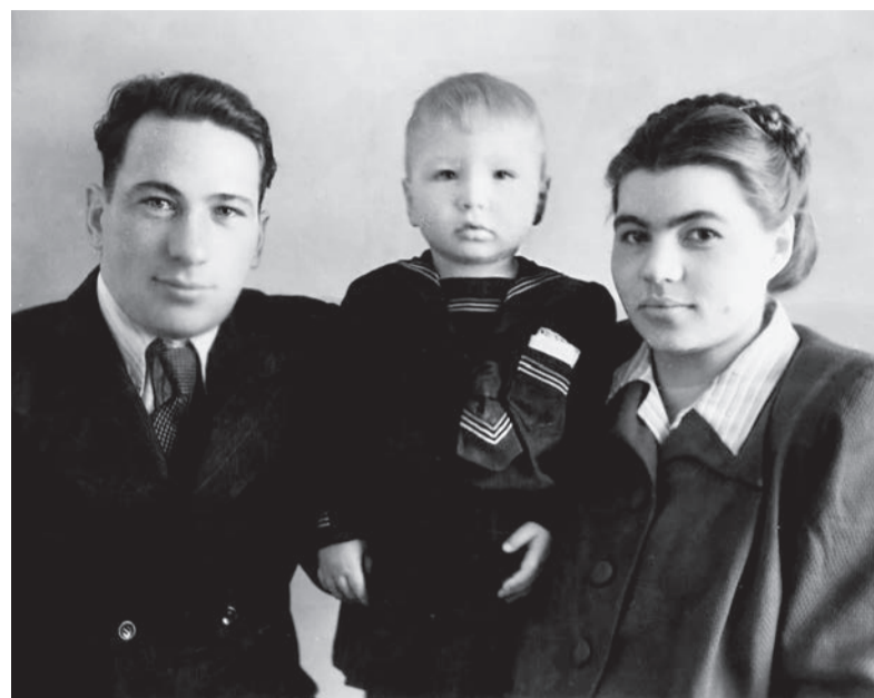
■ Ангарск, 1953

В то время получил признание так называемый гранулированный кварц. Раньше геологи просто мимо этого сырья проходили, не считали его ценным. Но оказалось, что стерильность кварцевых жил, имеющих низкий процент примесей, очень полезна при изготовлении специального тугоплавкого