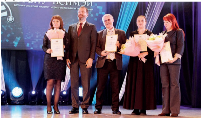
■ Поздравительный адрес и благодарственные письма работникам ВСИМЭИ вручил председатель Заксобрания Иркутской области Александр Ведерников