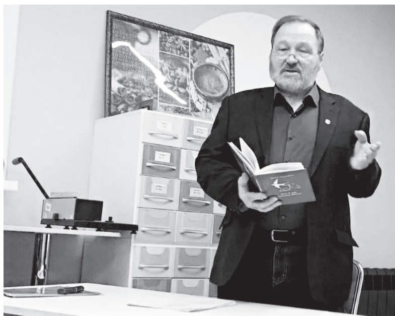
■ Творческий вечер в Центральной библиотеке г. Братска. 2023