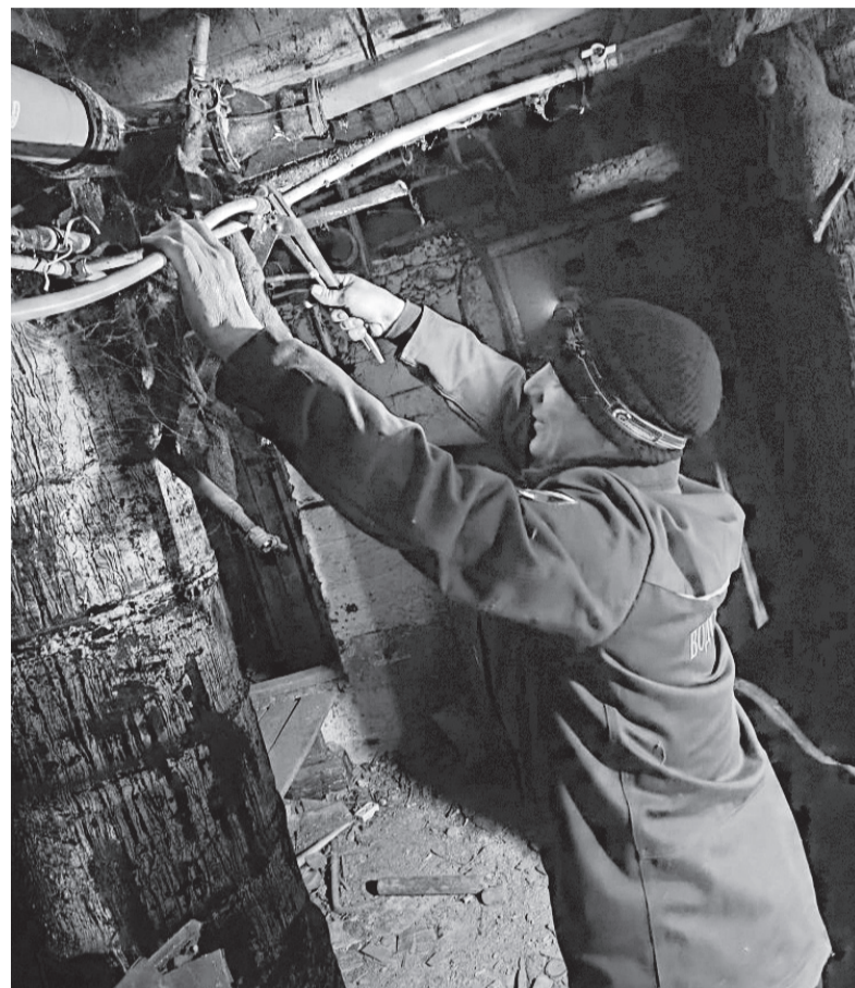
■ Жилым домам предстояла полная замена коммуникаций: демонтаж старых разорванных труб, вывод наверх стояков, разводка по квартирам