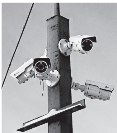
■ Камеры наружного видеонаблюдения способствуют снижению уровня уличной преступности