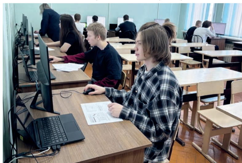
■ Будущие специалисты научатся не просто чертить, но и проектировать магистральные газы- и нефтепроводы. Это поможет лучше разобраться в процессах, которые происходят внутри громадных сосудов под давлением

емых предприятиями площадках под чутким руководством инженеров-наставников. Кроме того, сейчас предметно обсуждаются планы по строительству участка магистрального нефтепровода во дворе техникума. На учебном полигоне благодаря сооружению натуральной величины студенты получают возможность нагляднее представить, с чем им предстоит иметь дело.