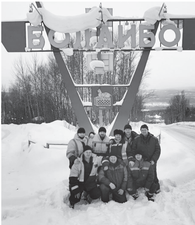
■ Сотрудники «Ангарского Водоканала» прибыли на место утром 5 февраля и сразу приступили к выполнению задач. Специалисты, способные непосредственно реанимировать тепло- и водоснабжение, были нарахвват

Наши люди. Как ангарчане помогли жителям замерзавшего Бодайбо