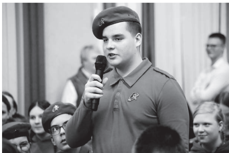
■ Ребята рассказывали почётным гостям о своих достижениях, а они не просто слушали, но и спрашивали, уточняли, дополняли

день делаете шаг вперёд! Если сегодня не сделать шаг вперёд, завтра придётся сделать два шага.