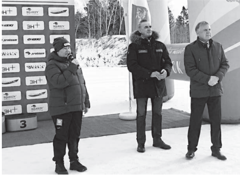
■ Елена Вяльбе: «Проект предоставляет отличную возможность ребятам оценить силы на уровне лучших сверстников со всей страны. Финал проходит на достойной площадке. В Ангарске создан шикарный лыжно-биатлонный комплекс с прекрасно подготовленными трассами»

Вектор развития. Наш округ принял юбилейный открытый финал межрегиональных соревнований