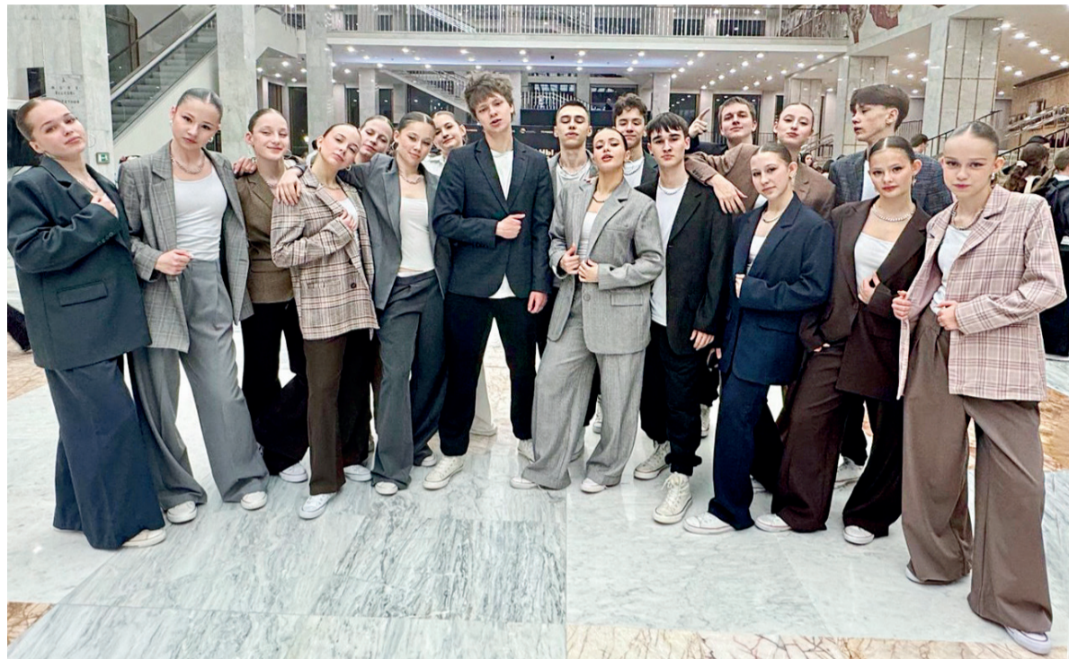
■ Танцоры «Дансера» покорили сердца жюри, доказали, что талант, труд и вера в мечту творят чудеса