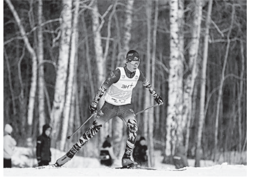
■ Полные решимости одержать победу, в наш округ съехались 157 сильнейших ребят своего возраста из 16 регионов России

Корреспондентам газеты удалось застать не только первый,