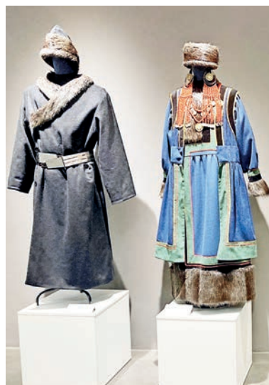
■ Бурятский женский традиционный зимний костюм эхиритских родов и верхняя мужская зимняя одежда