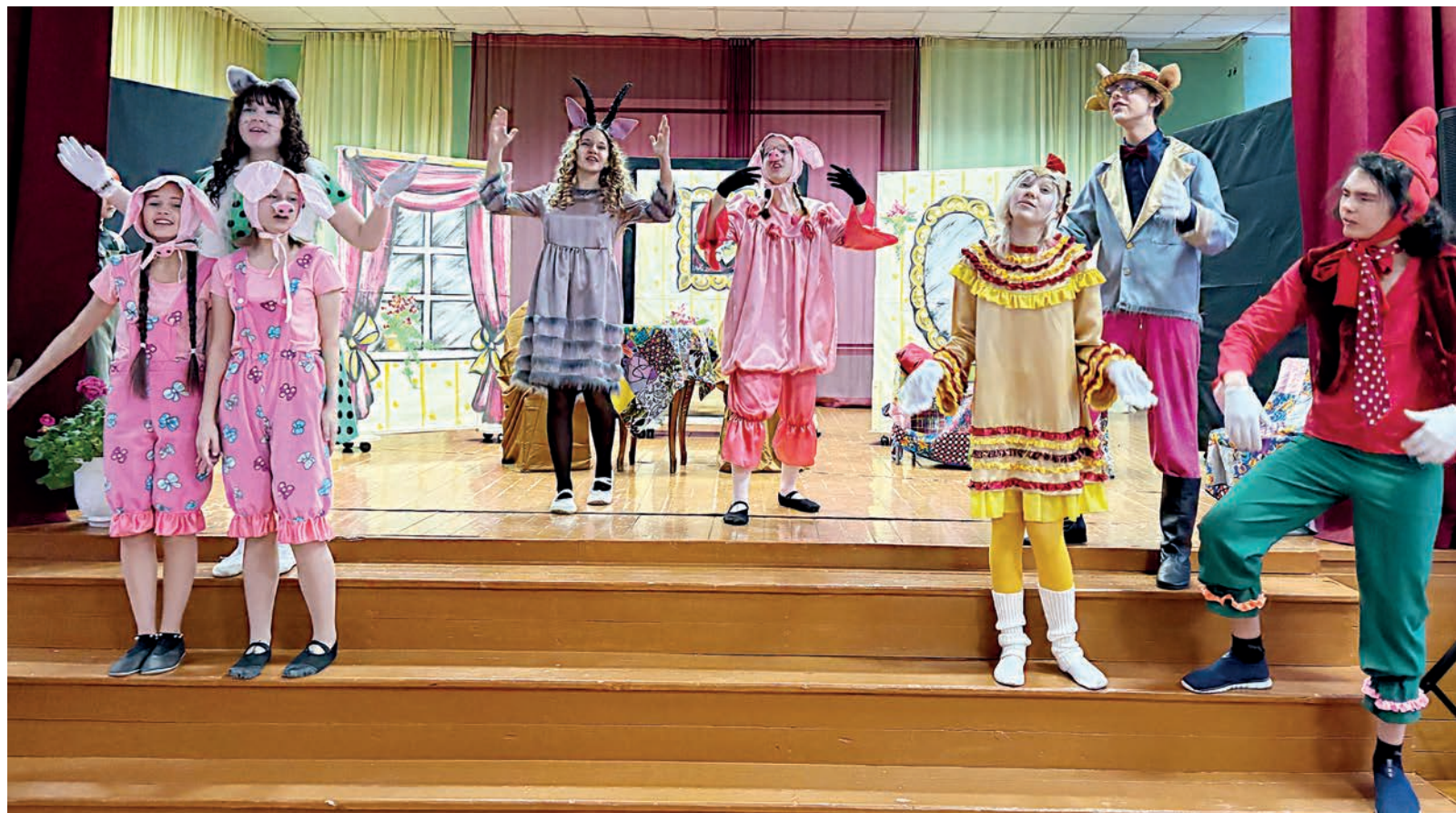
■ Безымянный, но яркий театр школы №5 проводит генеральную репетицию постановки «Кошкин дом»

Школьные подмошки. Юные артисты Ангарска растут на мировой классике