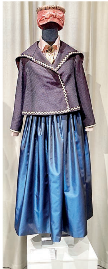
■ Шушун «нижнеудинского типа» - разлетаюка с огромным воротником