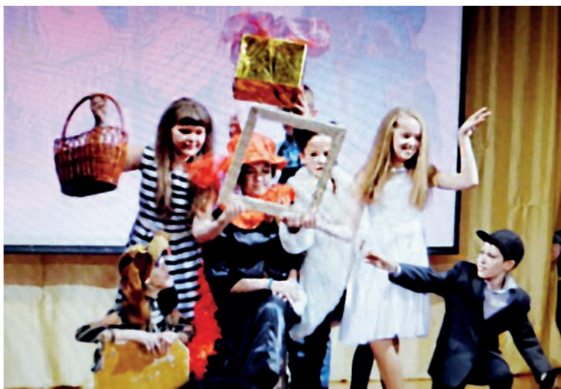
■ В школе №36 театр «Сверчок» стрекочет с 2007 года. За столько лет в копилке коллектива набралось немало спектаклей, которые становились лауреатами областных фестивалей