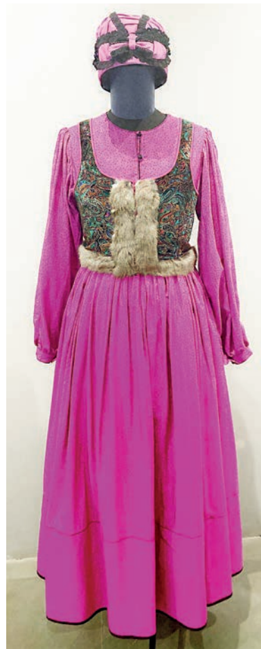
■ А какие названия были у цветов одежды! Лазуревый, багульничный, жарковый, саранчистый - от красной, алой саранки