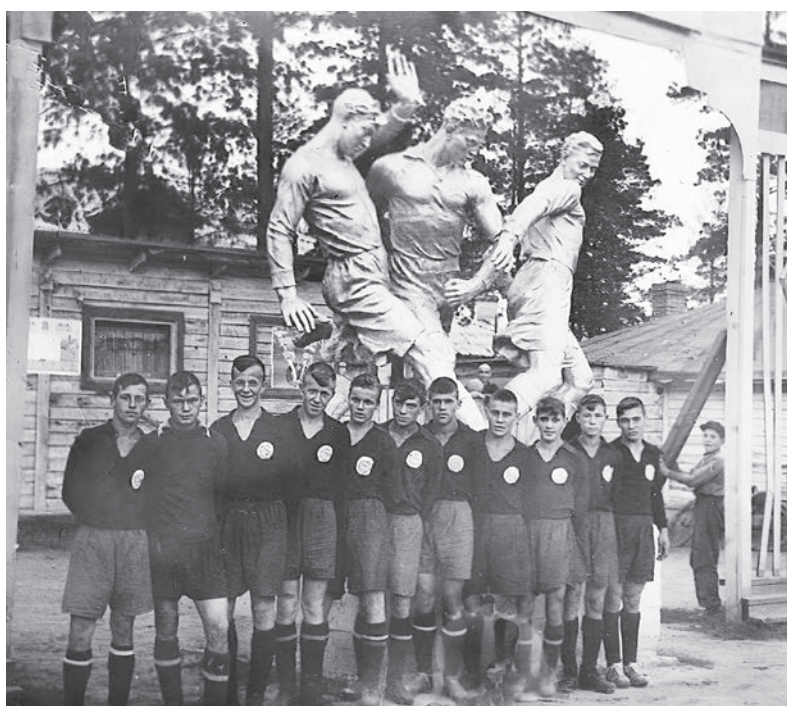
■ Трибуны стадиона «Строитель» были деревянными и едва могли вместить всех желающих. Раздевалки располагались в двух юртах, а около поля красовалась монументальная скульптурная композиция из бетона «Три футболиста»