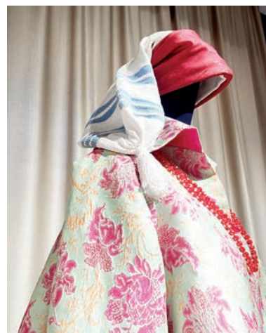
■ Колпак белёвый девичий просватанной невесты. Нить х/б, вязание на спицах, шёлковая шаль

носили на Нижней Ангаре в селе Кежда. Белоземельный - потому что белые цветы в рисунке разбросаны, как по земле.