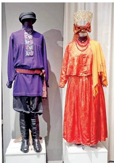
■ «Ангарская невеста» и мужской костюмный комплекс русских старожилов Восточной Сибири последней четверти XIX века