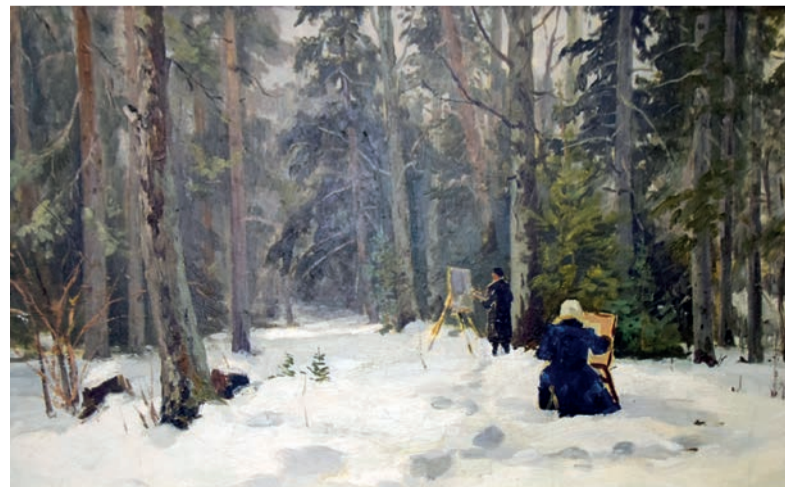
■ «На этюдах». Семён Гвоздев

Проходят годы, сменяются поколения, стирается память, а мысли, запечатлённые на холстах, остаются с нами.