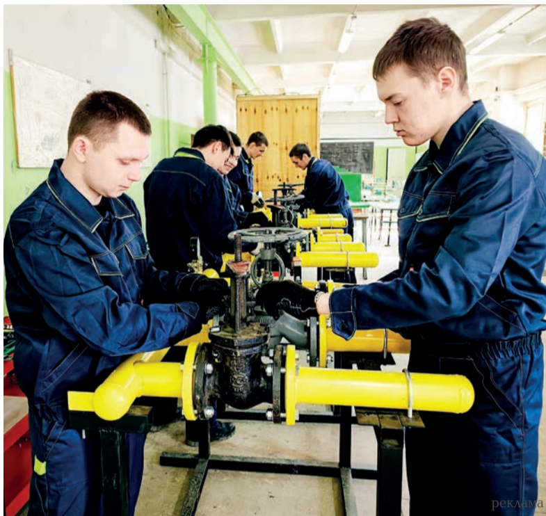
■ Ангарская нефтехимическая компания для развития кадрового потенциала сотрудничает не только с АПТ, но и с другими профильными образовательными учреждениями региона

Преимущество данных стендов в том, что они являются точной копией действующего на промышленных предприятиях оборудования, которое включает фланцевые соединения,