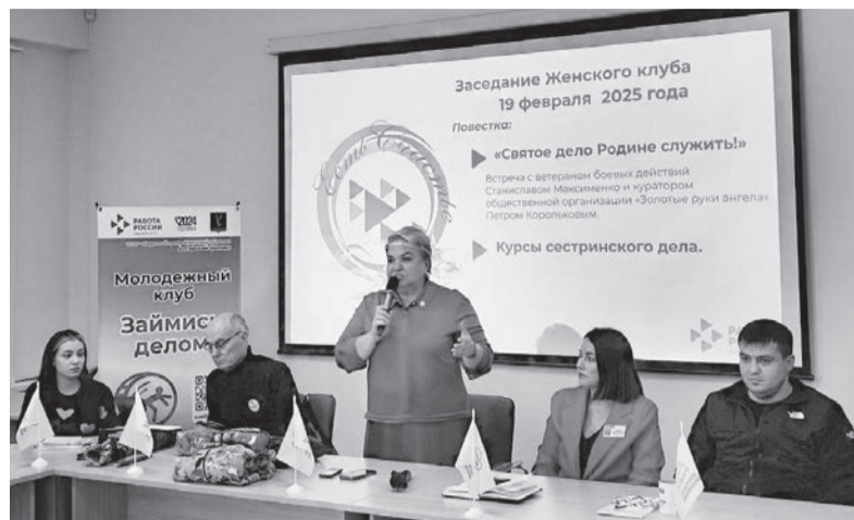
Женский клуб «Есть счастье» в Кадровом центре Иркутской области организовал встречу в честь Дня защитника Отечества