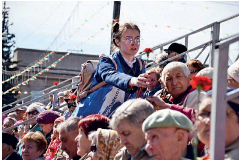
■ Сегодня, когда почти не осталось ветеранов Великой Отечественной войны, важно хранить священный огонь нашей памяти, зажигать его в юных сердцах. Большую роль в этой миссии играет волонтерское движение, созданное по инициативе президента России

Юные добровольцы на страже исторической памяти