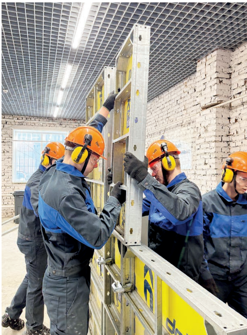
■ Практические задания студенты выполняют с помощью современного оборудования, которым оснащены мастерские техникума в рамках национального проекта «Образование»

- По существу бетонщик - инженерная специальность, ведь любая ошибка при чтении чертежей может сулить обрушением части будущих конструкций, - продолжает рассказ мастер. - Потому наши студенты ответственно подходят к обучению работе с проектной документацией, изучению основ геодезии и сварочного дела.