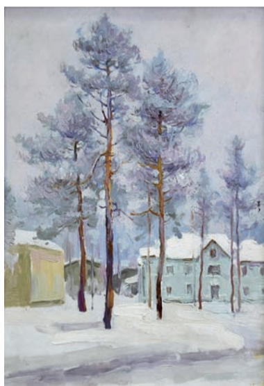
■ «55 квартал из окна дома №2». Сергей Васильев

- Выставка даёт возможность увидеть особенности искусства с середины прошлого века до наших дней, вспомнить имена ху-